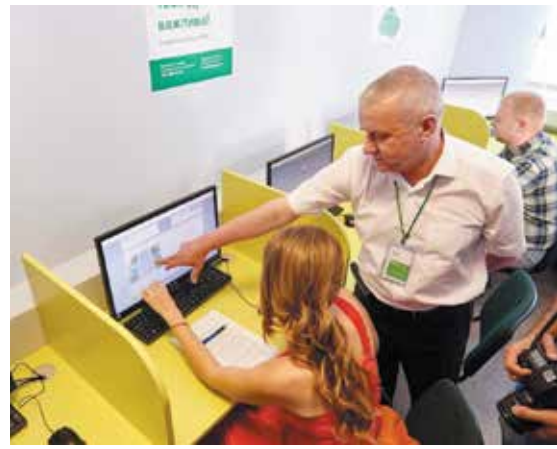
Нові питання до іспиту з ПДР. А що змінилося? с.4