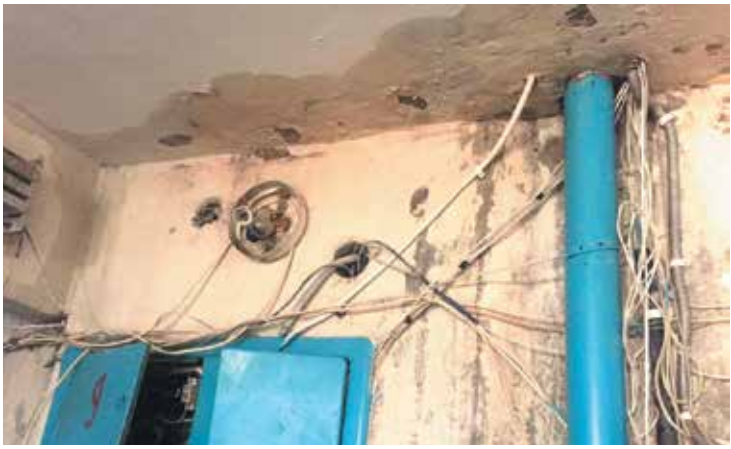
Поки 12 під'їздів не можуть об'єднатись в ОСББ, один з них «мокне» під дощами с.5