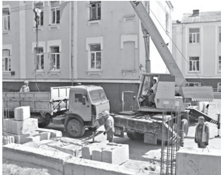
Робітники зводять нову підпірну стінку з боку школи № 17. Локацію вони мають зробити до Дня міста

А ЧОМУ «БІТЛЗ» ЗРОБЛЯТЬ У ВІННИЦІ? Ліверпульський гурт жодного разу не був у Вінниці. Тільки сер Пол МакКартні давав концерт у 2008 році, у Києві ( goo.gl/BkL13v ). Чому біля Мак-