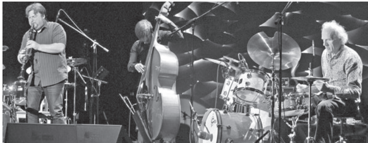
У Вінниці зірка світового значення Володимир Тарасов виступатиме зі знаменитими литовськими музикантами: саксофоністом Людасом Моцкунасом і басистом Євгеніюсом Каневічюсом. Унікальність цього тріо у тому, що вони ніколи не репетирують

Під девізом — «фартовий»! ■ Міжнародний джазовий фестиваль у Вінниці пройде 23–24 вересня. Він буде вражати легендарними іменами, виступами найвідоміших джазових зірок з дев'яти країн світу, світовими прем'єрами, незвичними жанрами, на кшталт «музики залізниць». А також новим проектом «КіноДжаз» з безкоштовними кінопоказами та величезною кількістю розіграшів