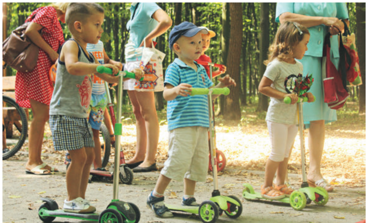
Дітлахи віком від 4 до 7 років. На старті готуються до перегонів на самокатах

Серед учасників від 8 до 12 років, які каталися на самокатах, переміг Георгій Нітішевський, який проїхав дистанцію за 19,4 секунди. На велосипедах — Олександр Дмитрик з результатом — 16,9 секунди.