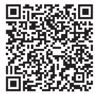
ДИВІТЬСЯ ФОТО НА 20MINUT.UA

— Мікрорайони в першу чергу називали ті, хто там жив, кожен хотів якось виділитися, і з'являлися назви, — каже він. — Принаймні, з пиріжками з лівером Ліверпуль навряд чи можна пов'язувати, вони продавалися напроти — там, де зараз бібліотека, в «Криниченці» вони теж були, але не як основний товар, кафетерій більше спеціалізувався на здобі... Але як би там не було, як на мене, «The Beatles» можна ставити де завгодно, місце в центрі — досить непогано підходить для цього.