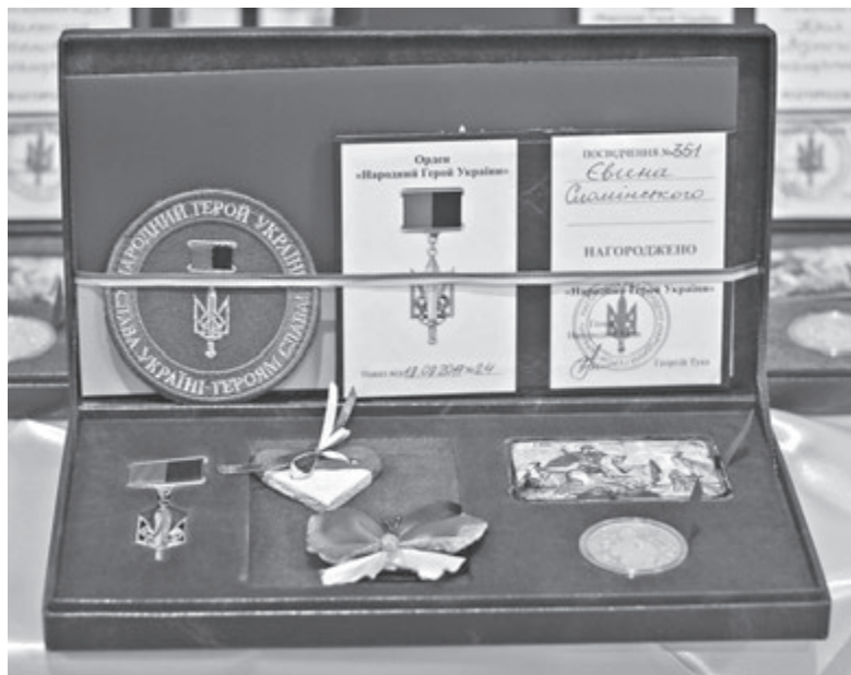
Такий комплект отримували кожен з Героїв України. Орден виготовлений зі срібла, яке збирають прості українці