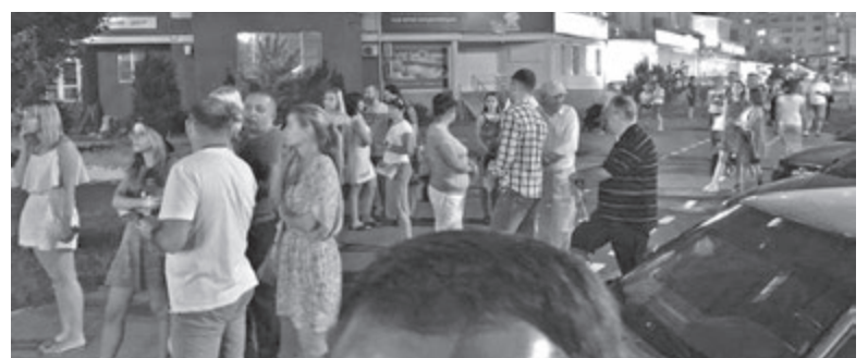
Натовп спостерігачів під конопляно-газовим будинком. Евакуації, як сказали в нацполіції, не було. Люди самі повиходили з квартир, щоб бачити, як розгортаються події