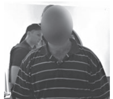
У помешканні були живі, але не дуже адекватні чоловіки. Вони не впустили до себе спецслужби, побоюючись кримінальних наслідків. Під час затримання опору не чинили