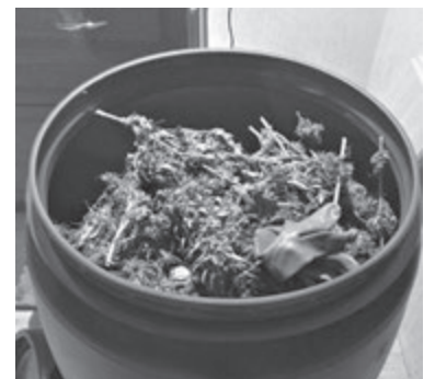
Наповнена коноплею 200-літрова бочка. Рослини залили водою, щоб сховати від людей, які гупали в двері, та пригасити специфічний запах рослини