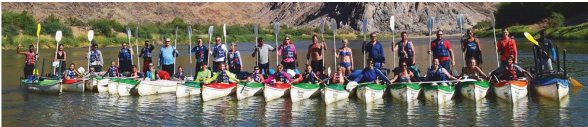
Група мандрівників разом із своїми дітками. Три дні сплавлялися Помаранчевою річкою, яка протікає в Африці