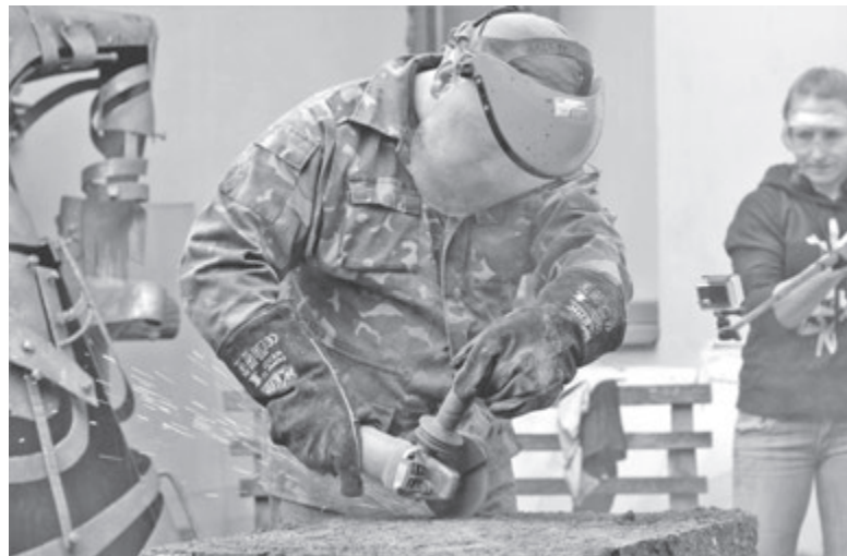
На жаль, сейф виявився без золота.

Нагадаємо, сейф знайшли під час земельних робіт на Магістратській. Ранком працівники «Вінницятеплоенерго» викликали на місце археологів. Історики одразу припустили, що металева скриня є сейфом часів Другої світової війни, та розпочали свої дослідження. Сейф відвезли у Краєзнавчий музей, де його почистили і при журналістах відкрили.