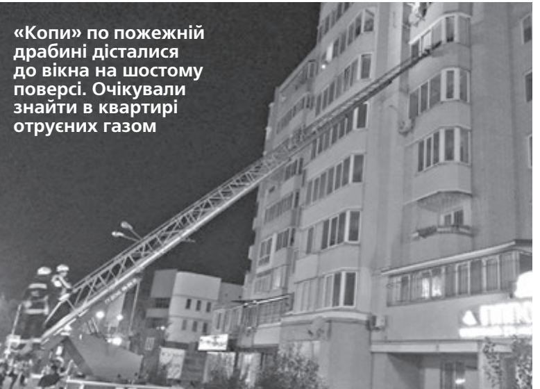
«Копи» по пожежній драбині дісталися до вікна на шостому поверсі. Очікували знайти в квартирі отруєних газом

Просто зчитайте QR-код камерою Вашої мобільки та дивіться фото! (Має бути встановлена програма QR Reader з Android-маркета або аналогічна)