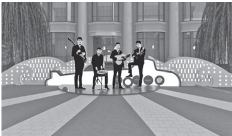
У центрі буде сцена з фігурами «The Beatles». І тут будуть лунати хіти Ліверпульської четвірки

Як встановили історики, особливої історичної цінності підвали будинку Співака не мають, адже неодноразово перебудовувалися та були пошкоджені.