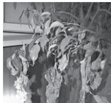
Кущі коноплі були розвішані по всій квартирі. Частина сушилася на великих кімнатних рослинах. Скільки поліція вилучила забороненого, зважають експерти