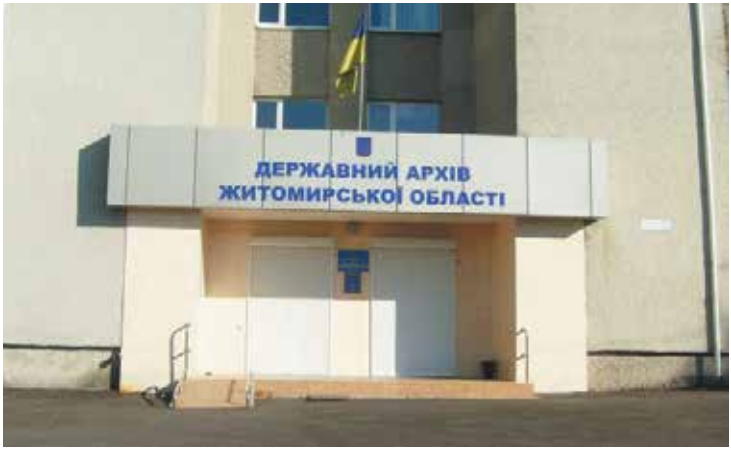
Як керівництво Державного архіву Житомирської області ламає долі с. 6