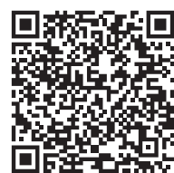
ДИВІТЬСЯ ВІДЕО НА 20MINUT.UA

вості міського бюджету і шукати інвесторів. Фактично вже у 28 із 36 шкіл в тій чи іншій мірі відбулись зміни з оновлення спортивних баз закладів», — передає слова Моргунова прес-служба мерії.