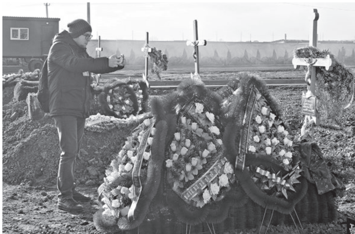
П'ять свіжих могил на Сабарівському кладовищі.

Цікаво, щоб зайти на територію діючого міського кладовища, потрібно показати невідомим людям невідомий документ. Ми хотіли вже викликати поліцію, але спочатку вирішили запитати у мерії, чому нас не пускають. Через кіль-