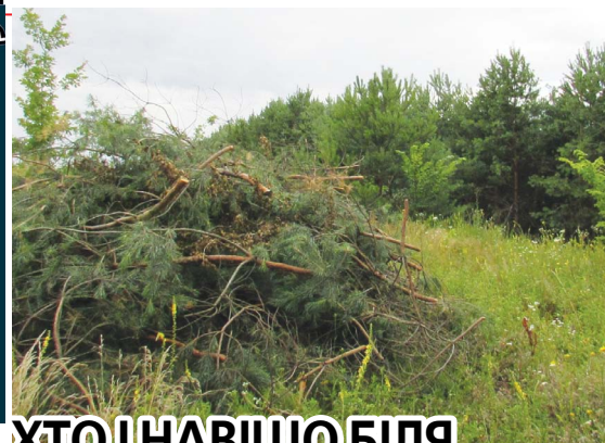
ХТО І НАВІЩО БІЛЯ «БЕЗОДНІ» РІЗАВ СОСНИ