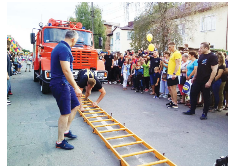
Силачі тягнули пожежну машину на швидкість. Під час вправи в одного з учасників турніру пішла носом кров, тому йому довелося повторити спробу