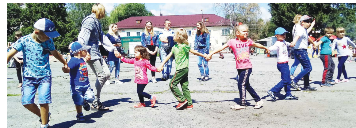
У суботу влаштували свято для дітей. Вони малювали на асфальті, водили хороводи, танцювали. А ще брали участь у конкурсах, за що отримували солодкі подарунки

О 16 годині навпроти дитячого садочка з'явилися живі скульптури. Очікували з ними фотографуватися.