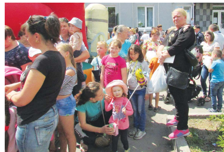
Першого дня усі атракціони були безкоштовні. Вишикувалася довга черга до каруселей та надувної гірки. Також малеча стрибала на батутах та їздила на машинках