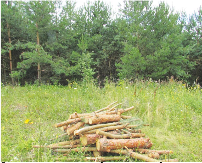
Громада так налякала людей з пилками, що й дрова вже не хочуть забирати