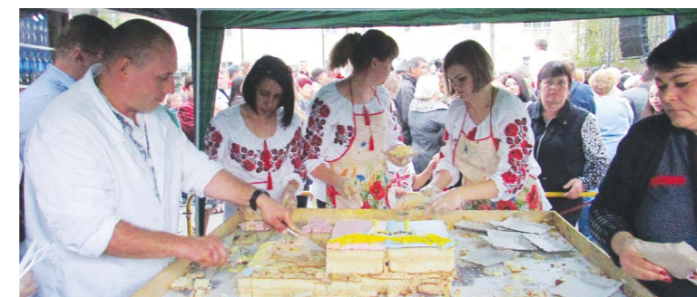
Спеціально до Дня міста «Козятинхліб» приготував величезний торт. Його вага — 145 кілограмів. Рівно стільки ж, скільки років нашому Козятину. Гостей свята пригощали гігантським смаколиком безкоштовно

— У мене своя радість, — каже він. — Коли діти та онуки придуть. Напої з консервантами я не п'ю, а щось смачного моя дружина не гірше приготує.