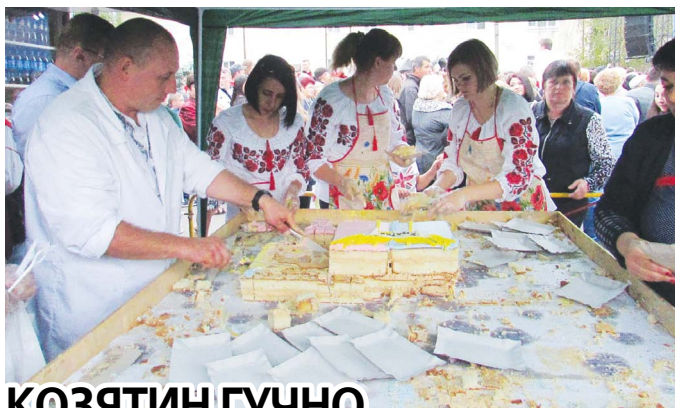
КОЗЯТИН ГУЧНО ВІДСВЯТКУВАВ 145-РІЧЧЯ