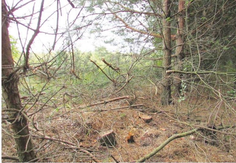
Розчищали для людей, а вишло для автівки