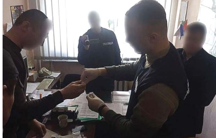
Прокурори довели взяття хабара в розмірі 300 доларів

зано винним у вчиненні кримінального правопорушення, передбаченого частиною 3 статті 368 КК України та призначенням йому покарання у вигляді 5 років позбавлення волі, з позбавленням права обіймати посади, пов'язані з використанням організаційно-розпорядчих та адміністративно-господарських функцій в органах державної влади та органах місцевого самоврядування строком на 3 роки, з конфіскацією всього майна, що є його особистою власністю, за винятком житла, — зазначають у прес-службі прокуратури області.