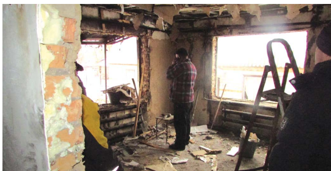
ЗАЛИШИЛИСЯ БЕЗ ДАХУ НАД ГОЛОВОЮ