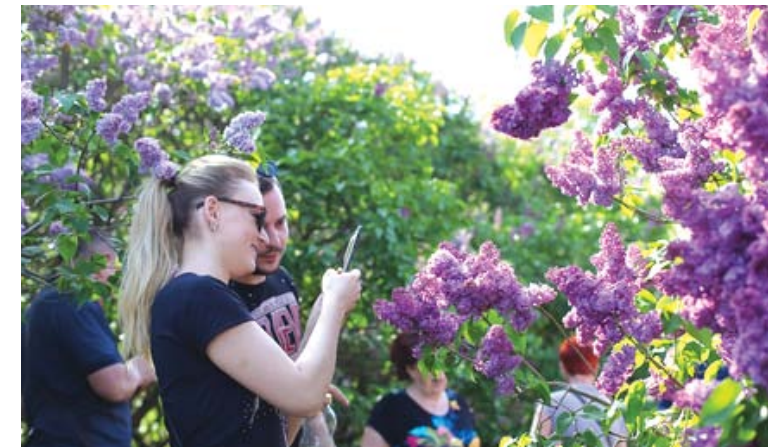
Козятин можна засадити бузковими алеями різних сотрів

Давайте разом перетворимо наше місто на маленьку перлину Поділля, для нас, для наших дітей та нащадків. На підтримку акції «500 дерев для нашого міста» також оголошуємо челендж #500дерев. Долучайтесь до захисту довкілля, допоможіть створити місто-сад.