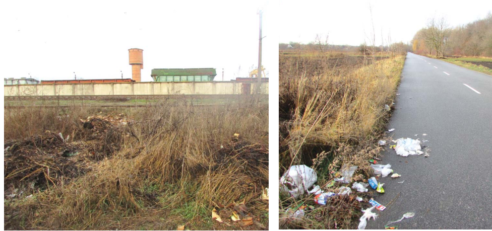
Від провулку Лісового до матеріального складу суцільний смітник

Майже всю вулицю сміттям накрили, тож виникає просте запитання: перестанемо колись сміття на вулиці кидати чи Джерельну в Смітникову перейменуємо?