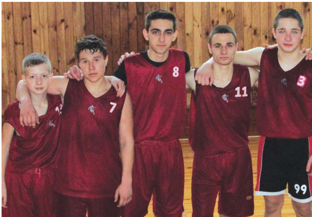
Баскетбольна команда школи №1 прославляє наше місто на спортивній арені області

У другій зустрічі суперниками козятинчан була міська команда Жмеринки. І в цій зустрічі мастеровитішими були вихованці козятинської баскетбольної школи. Вони перемогли своїх суперників з рахунком 30:25. От тільки видовищної гри в цій зустрічі не було. Гості переважали наших баскетболістів в сумарній вазі команди, тому їм на руку був атлетичний баскетбол, який нерідко виходив за межі баскетбольних правил. Складалося враження, що школярі Жмеринки востаннє переступили поріг школи минулої весни. Вони мали значно старший вигляд, ніж суперники. Але клас козятинських баскетболістів виявився вищим за зріст, вагу і вік гравців команди суперника. І вони по праву опинилися в квартеті найсильніших на сьогоднішній день чотирьох шкільних команд Вінницької області. Дві жмеринські команди провели між собою матч престижу, який не впливав на розподіл місць у козятинській зоні.