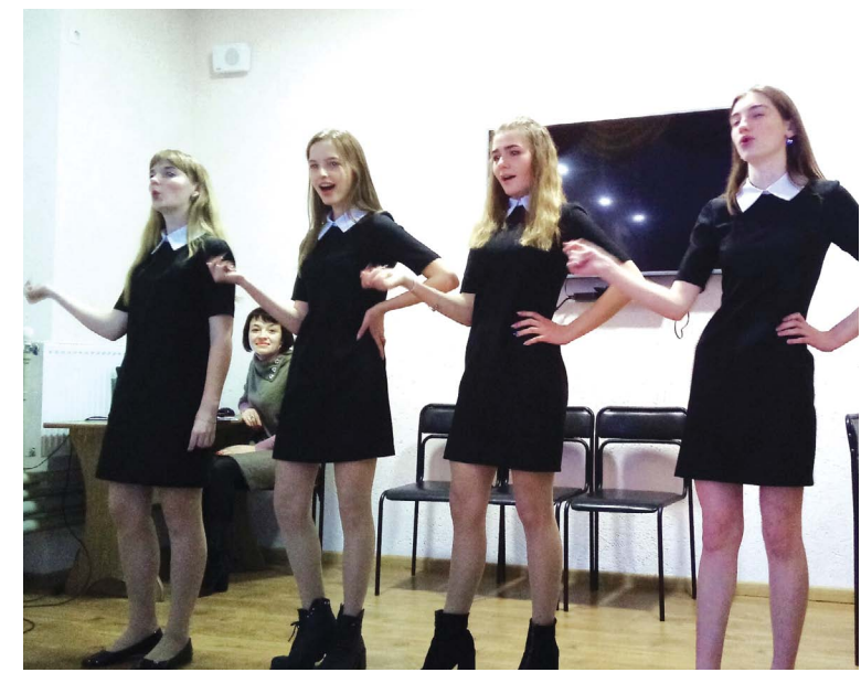
Колектив «Шарм». Дівчата співали пісню «Lucky me»