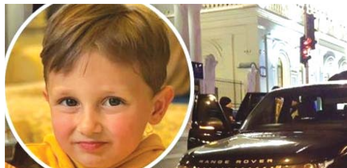
ЗАСТРЕЛИЛИ ОНУКА ЕКС-ГОЛОВИ КОЗЯТИНСЬКОЇ РДА