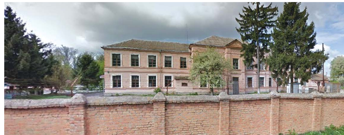
Військова частина на території Інтендантського містечка.