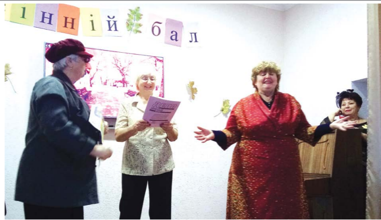
Глядачам показали гумористичну сценку з подружнього життя. За сюжетом, від адвоката дружина дізнається, що чоловікова коханка залишила їй спадок