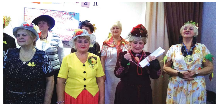
У ТЕРЦЕНТРИ ОБРАЛИ КОРОЛЕВУ ОСЕНІ