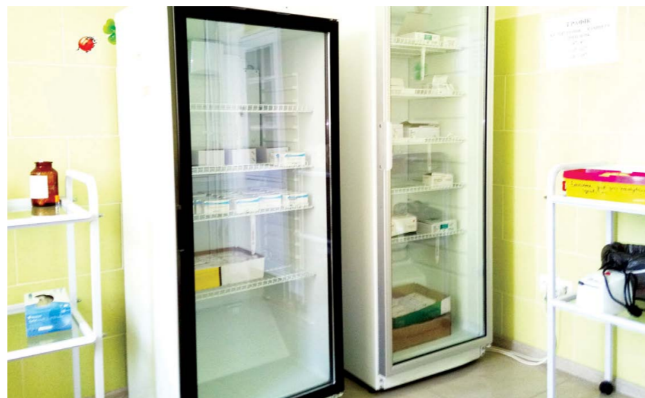
Холодильники, у яких зберігаються вакцини. Температура у них +5 градусів за Цельсієм

Місцева реакція зникне за два-чотири дні, а ви маєте надійний захист від хвороби. І це порівняно ніщо з тим, які ускладнення може дати дифтерія.