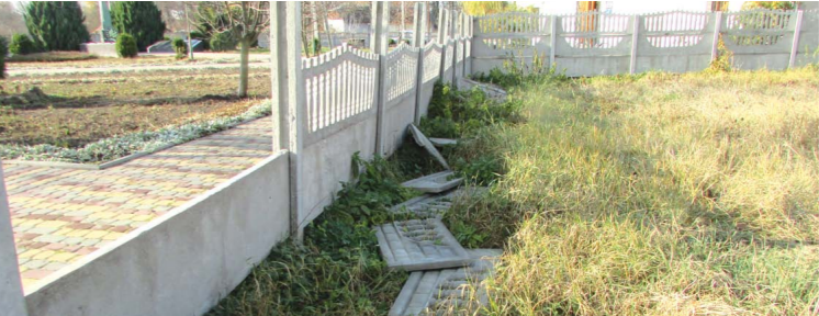
Озвірілий вандал своїм діям дасть пояснення в поліції

який перетворив підлітка на вандала. Це видно з камери спостереження, що нам показали в сільській раді. Дивує в цій історії те, що крім парканного гладіатора, біля будинку культури були ще молоді люди. Їм можливо не зовсім сподобався вчинок вандала та всі троє залишили це поза увагою.