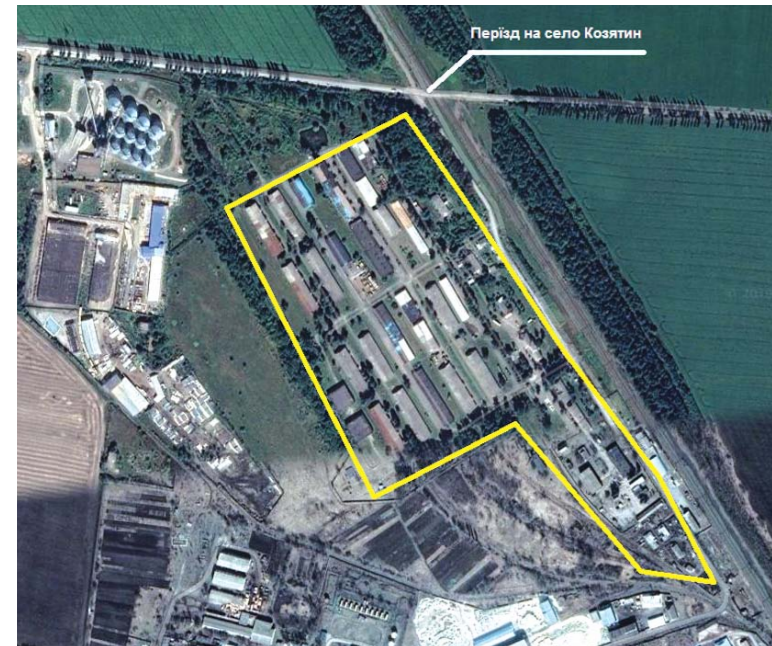
Google-карта. Виділене місце — Інтендантське містечко