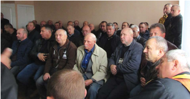
Мисливці приймають рішення на лиса роботи облави