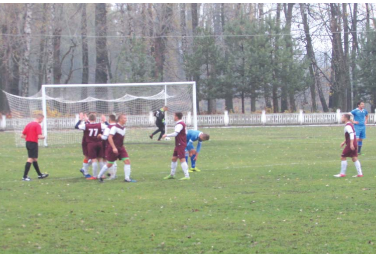
Гравці «Моноліта» святкують перше взяття воріт

За десять хвилин лідеру чемпіонату вдалося скоротити відставання, це був єдиний успіх гостей. Кінцівка матчу проходила за сценарієм гри в одні ворота.