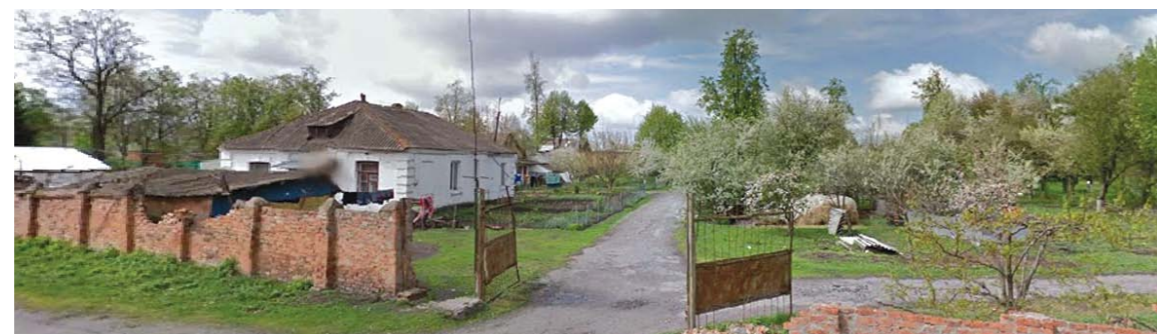
Житловий будинок в Інтендантському містечку.