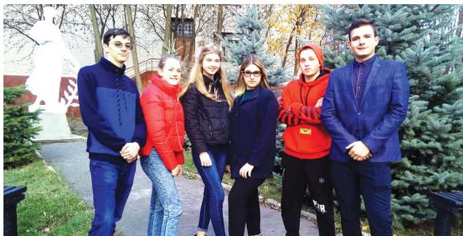
ЧИМ ЖИВУТЬ КОЗЯТИНСЬКІ СТУДЕНТИ