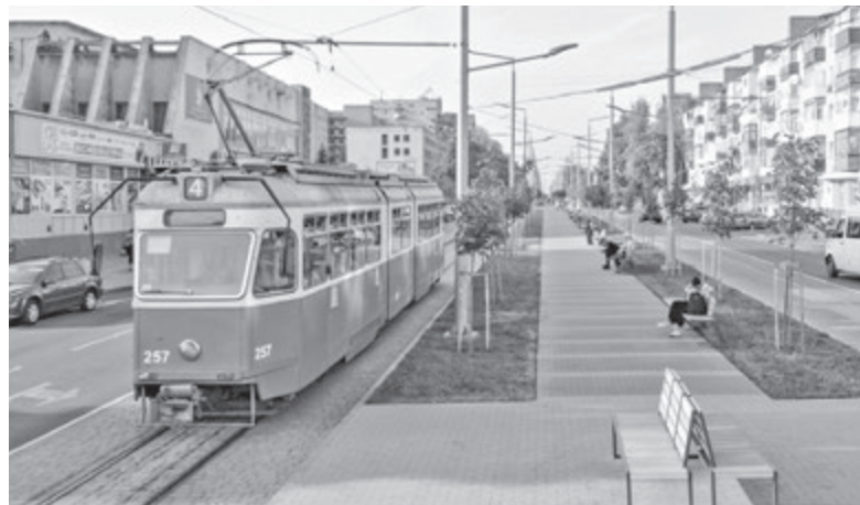
Найдорожчий об'єкт — реконструкція Замостянської. На другу чергу витратили 92 мільйони гривень, а загалом ремонт вулиці від Будинку офіцерів до 45-го заводу коштував понад 170 мільйонів!

Наступний рік буде для міської влади роботою над «відкладеним домашнім завданням»: є декілька довгобудів, які почали робити у попередні роки. Серед них Регіональний кардіоцентр, який будують за 32,5 мільйона доларів зі Світовим банком на Хмельницькому шосе (почали у 2018 році); спорткомплекс на Янгеля, 48, який завершать вже не під кінець 2019 року, а аж у 2021 році.