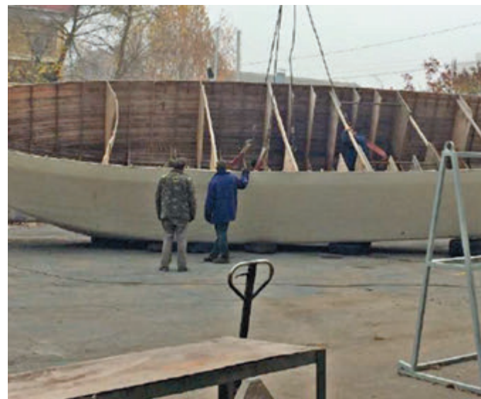
Спочатку виготовляють ось такі майстер-моделі човна, на основі яких потім роблять його корпус

Ініціатива ■ Катери на електротязі планують запустити на Південному Бугу. Електродвигуни, це принципово новий вид для водних плавзасобів не тільки у Вінниці. Ідею подали на заводі «Аналог», її підтримала міська влада. На підприємстві уже можна побачити частину виготовлених корпусів до двох катерів