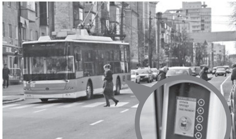
Валідатори запускають і в троллейбусах. На сьогодні вже понад 50 зі 167 машин, де можна сплатити проїзд карткою

З 2 грудня система працювала лише в трамваях. Зараз ми програмуємо валідатори в троллейбусах. І вже у близько 50 зі 167 тролейбусів можна розрахуватися банківською карткою/смартфоном/карткою вінничанина. Незабаром ми приєднаємо всі тролейбуси та