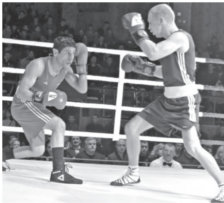
Збірна України розгромила гостей з рахунком 7:2

— Ми розпочали підготовку до відбору на Олімпіаду. Перші олімпійські ліцензії будемо виборювати в Лондоні в березні наступного року. Національна ко-