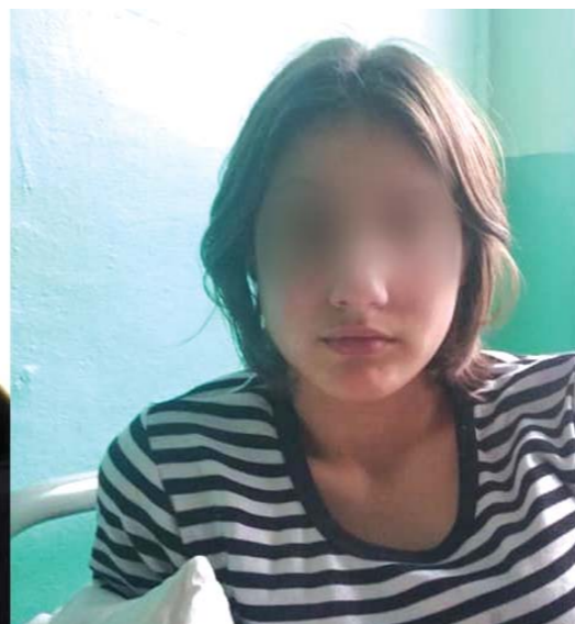
Після катування у дівчини синці та струс головного мозку