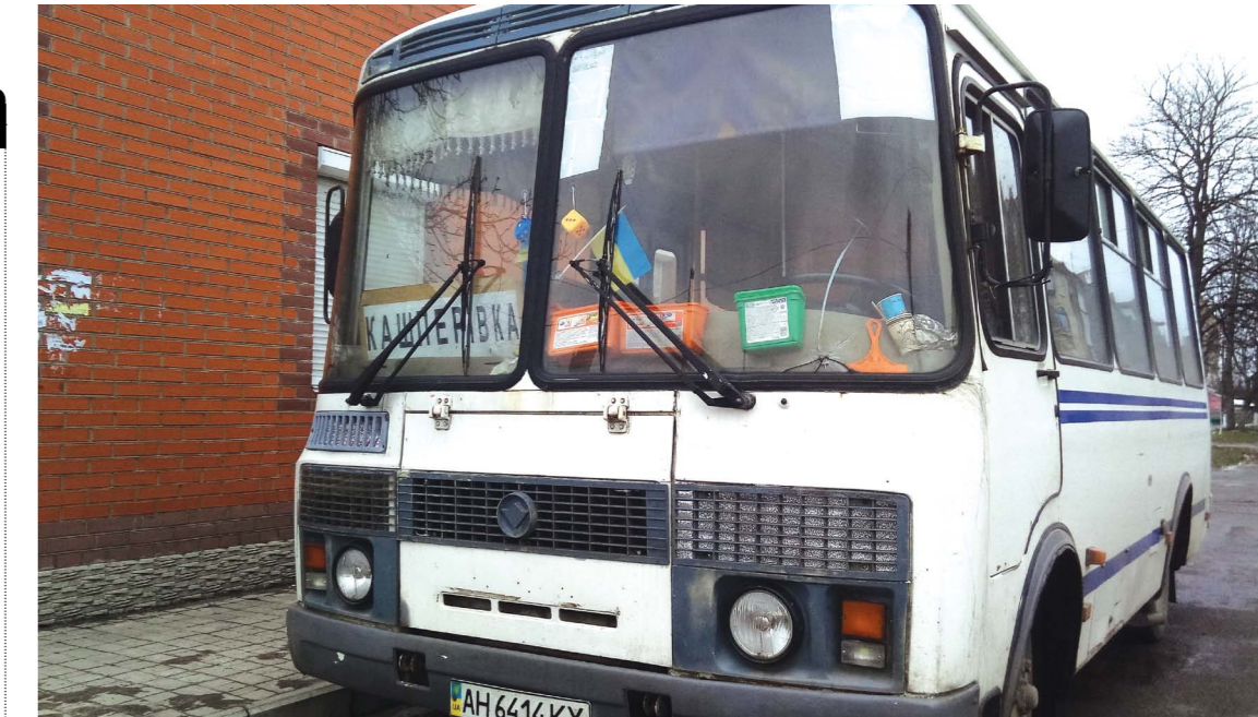
Автобус «Козятин-Кашперівка» ходить вісім разів на день. Перевізник каже, що сільські голови виступили проти скорочення кількості рейсів, тому довелося підняти ціну

змушений їздити з Вернигородка до Козятини і назад. Адже працює чоловік тут. Про те, що проїзд з Нового року подорожчав, пасажирів попередили. Перевізник повісив кілька тижнів тому оголошення, на якому написано, що вартість квитка піднімається у зв'язку з тим, що зросли податки.