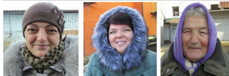
ОЛЕНА (46), У ДЕКРЕТІ: - Удома були. До мене приїздила сестра, то ми разом Новий рік святкували