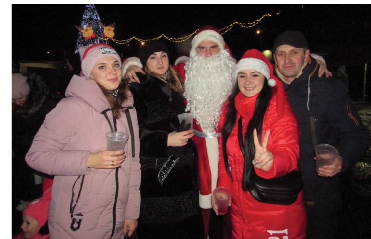
Дід Мороз скинув російські валянки, одягнув українські бурки і став Миколаєм