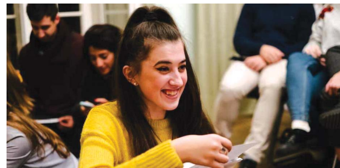
КОЗЯТИНЧАНКА ВИГРАЛА ЄВРОПЕЙСЬКИЙ ГРАНТ