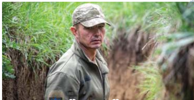
НАРОДНИЙ ГЕРОЙ УКРАЇНИ