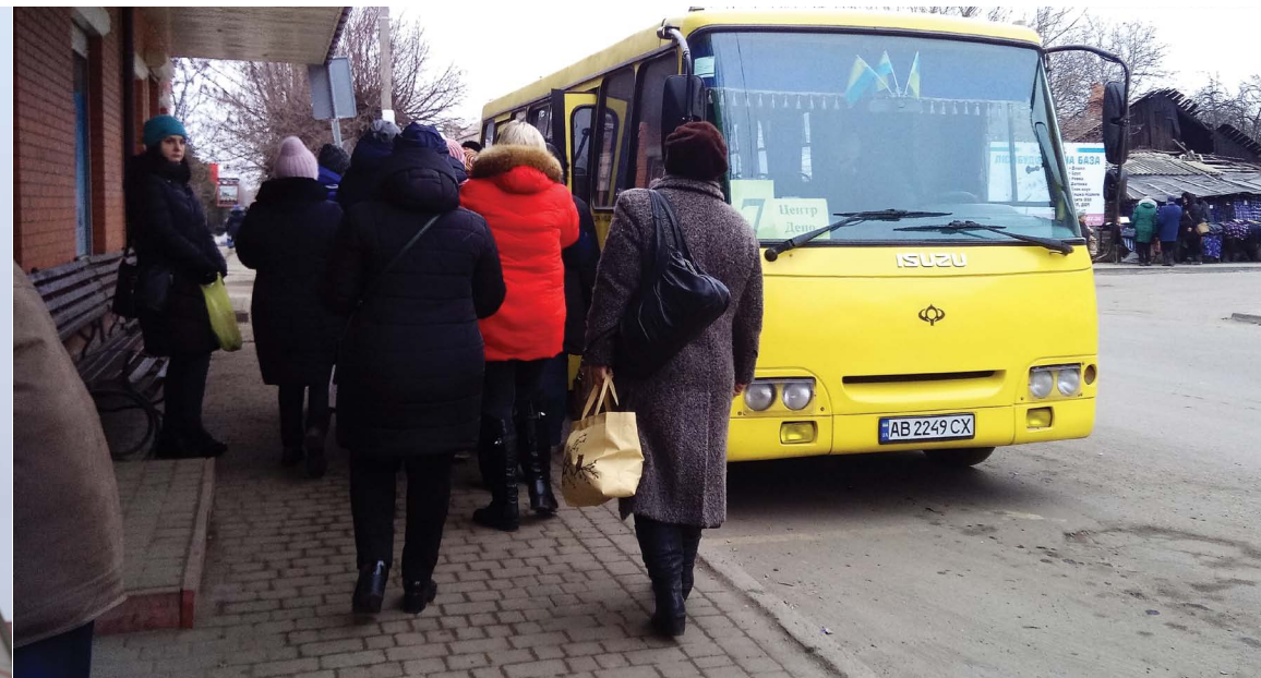
«Сімка», напевно, найпопулярніший маршрут. Пасажирів вистачає навіть вдень

Є розклад руху автобусів. Проте місцями цифри стерли-