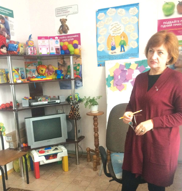
З усіма матусями працює психолог, а ще вони вчаться опанувати нову професію