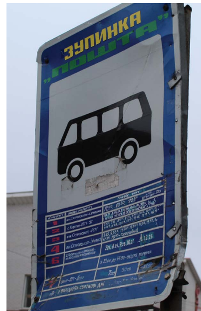
На зупинці «Пошта» розклад є. Але деякі написи стерлися

Справді, якщо користуватися громадським транспортом регулярно, то з часом запам'ятовуєш, коли на зупинку має прийти автобус. Проте якщо маршрутним