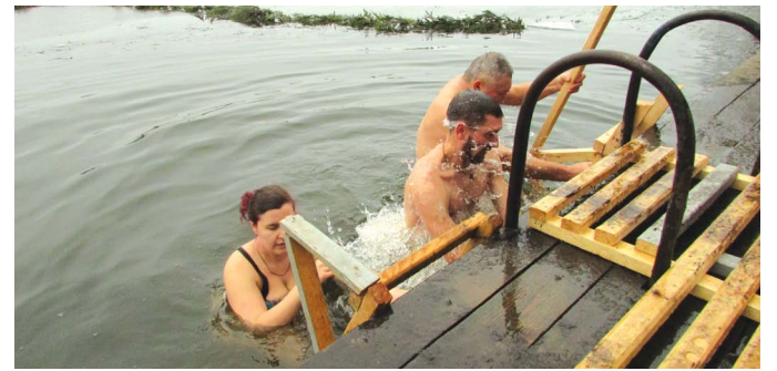
ЯК КОЗЯТИНЧАНИ У ВОДОКАЧКУ ПІРНАЛИ