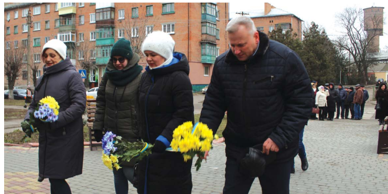
Козятинчани прийшли віддати шану Михайлу Грушевському. Вони поклали до пам'ятника квіти

День соборності ми офіційно відзначаємо з 1999 року. А за дев'ять років до цього українці створили перший живий ланцюг між Києвом, Львовом та Івано-Франківськом. Було це 21 січня 1990 року.