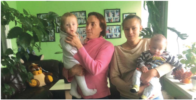
РЕПОРТАЖ З ЦЕНТРУ МАТЕРІ І ДИТИНИ