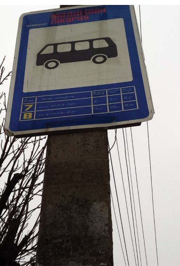
Зупинка навпроти поліклініки ЦРЛ. У розкладі немає дійки, яка тут зупиняється, а замість «четвірки» — маршрут №8

Під зображенням автобуса розклад, у якому два маршрути — №7 «Центр-МВПУЗТ-Діпо» та №8