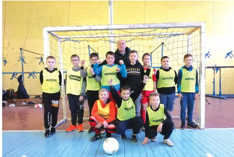
Футболісти школи-ліцею в зональному турнірі зустрінуться з командами Жмеринки та Бару

Переможець турніру, команда школи-ліцею, візьме участь у зональних змаганнях обласної гімназиади, який пройде 24 січня в нашому місті.