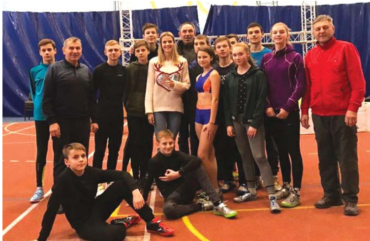
Козятинські стрибунів у висоту на Меморіалі Дем'янюка у Львові

сіновська отримала срібну нагороду з бігу на 60 метрів. Інші спортсмени призерами не стали та внесли вагомий вклад у скарбничку міської команди.