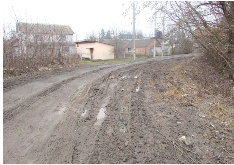
Пройти вулицею Склярова і не забруднити взуття, практично неможливо