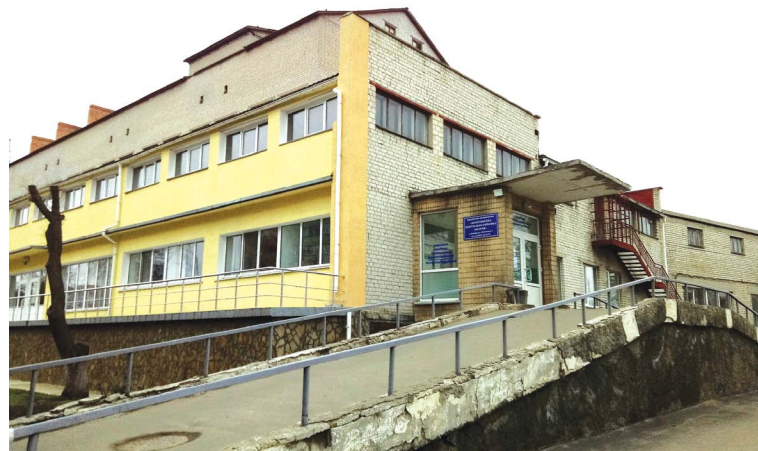
Козятинська ЦРЛ у переліку опорних лікарень. Усього в області їх буде десять

—бронхоскопія (ендоскопічне дослідження бронхів за допомогою ригідних (прямих) бронхоскопів або гнучких бронхофіброскопів).