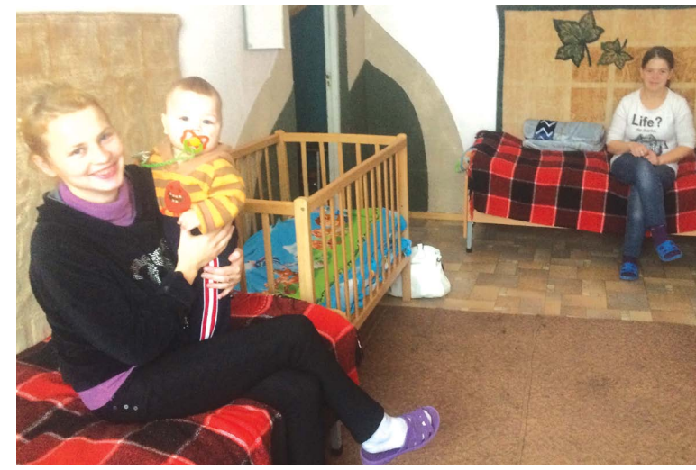
Мами і діти почуваються затишно