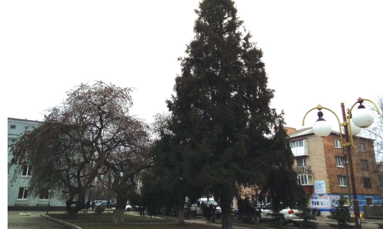
Прикраси з головної ялинки міста зняли. На демонтаж святкової ілюмінації витратили понад 4 тисячі гривень

Фігури «2», «0», «Дід Мороз» і «Пацюк» коштували майже сто тисяч гривень. Також Відділ культури двічі купував електричні гірлянди: за 10 тисяч гривень та 460 гривень.