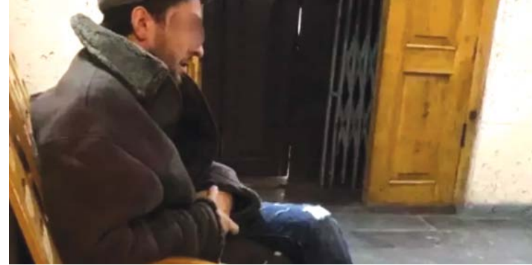
Один з бандитів, які напали на білоруса

Бандитів затримали за статтею 208 Кримінального кодексу України. У одного з четверки вилучили долари в розмірі 715 умовних одиниць, ланцюжок, білоруські рублі. Наступного дня поліція знайшла і мобільний телефон потерпілого.