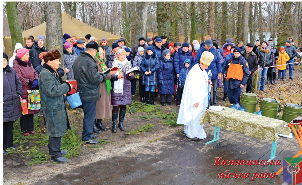
Козятинська міська рада

Після благодатної купелі на водоймі, всі мали можливість зігрітись гарячим чаєм.