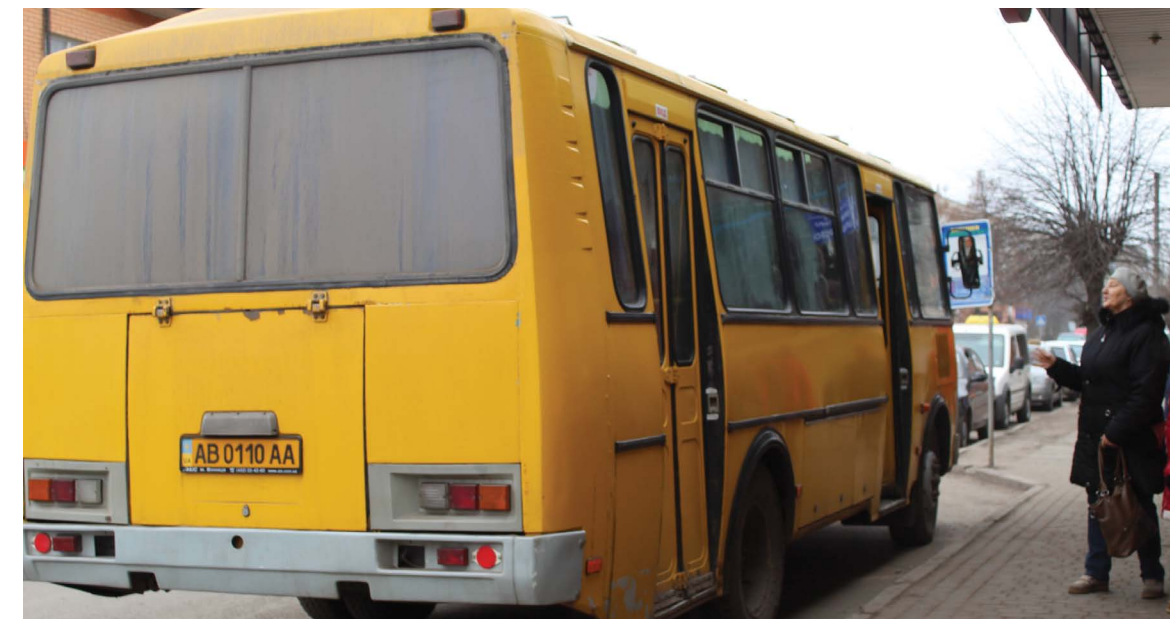
Автобус №4. На зупинку прибув вчасно, та й поїхав на три хвилини раніше