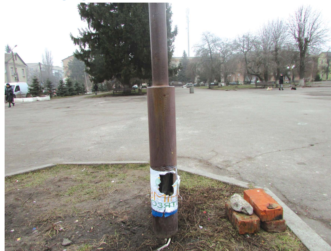
Обгортка з написом «Зміни Козятин» не змінила нічого в безпеці дітей

— Я не звернула увагу, тепер бачу. За таку організацію чула. З одного боку це дуже добре, що в нашому місті є люди, які хочуть змін в Козятині. Тільки заклейти папірцями і замотати скотчем, думаю, що скоріше на шкоду. Не кожна дитина хоче з'їсти цукерку. Зате переважна більшість дітей розмотають цукерку, тому що хочуть побачити,