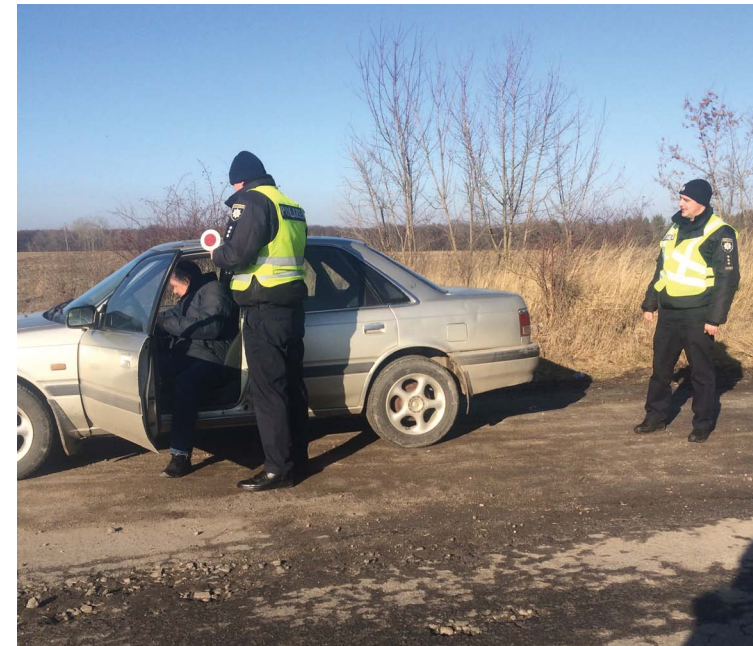
Патрульні поліцейські щодня зупиняють водіїв у нетверезому стані

— Колишній співмешканець викрав ноутбук у жінки. Ми вже його знаємо, він не один раз уже був у нашому відділі