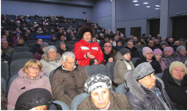
Громада в розпачі – в Козятині найвищі тарифи на воду

— Хто про Козятин почу? — розгублено гомоніли люди. — Не обов'язково залізницю чи дороги державного значення перекирвати,