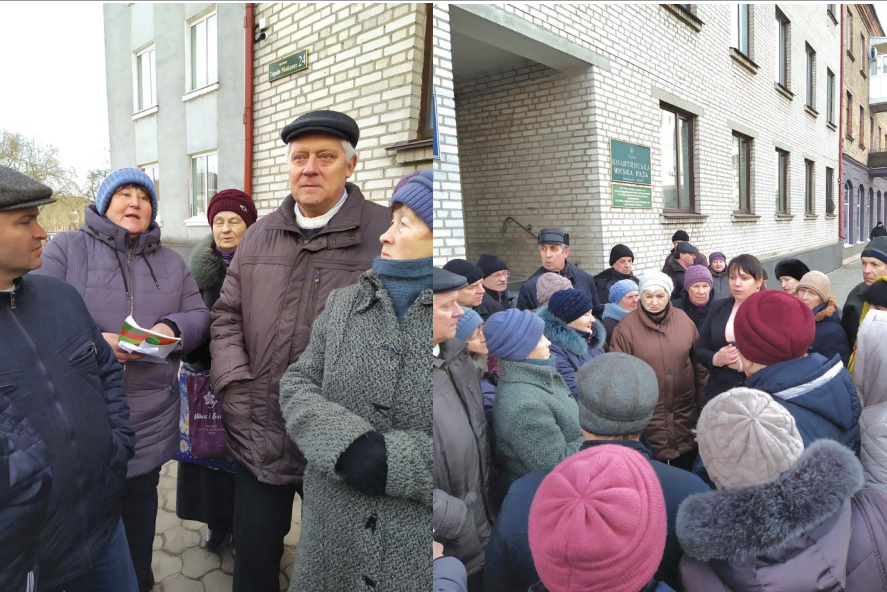
Козятинчани вийшли під міську раду. Люди обурені підвищенням тарифів на воду

— Прийняли перше рішення — звернуто до суду щодо призупинення таких тарифів, — каже пані Ірина. — Постало питання, щоб ще раз звернутися до Укрзалізниці про передачу мережі водопостачання на баланс міста. Для того, щоб можна було впливати як на цінову політику, так і на якість води. Також на сесії подається рішення про експертизу, що наша вода дійсно технічна. Підняття цін на воду по всій Україні, але в межах області, це неможливо. Підключайтесь найкращі юристи, які будуть допомагати міській раді судитися. Будемо бачити через 10 днів, коли ми подмомо звернення до «Укрзалізниці» та НКРЕКП, на основі чого вони зробили таку ціну? Якщо ми будемо стояти і мовчати, відповідно нам залишать такі тарифи