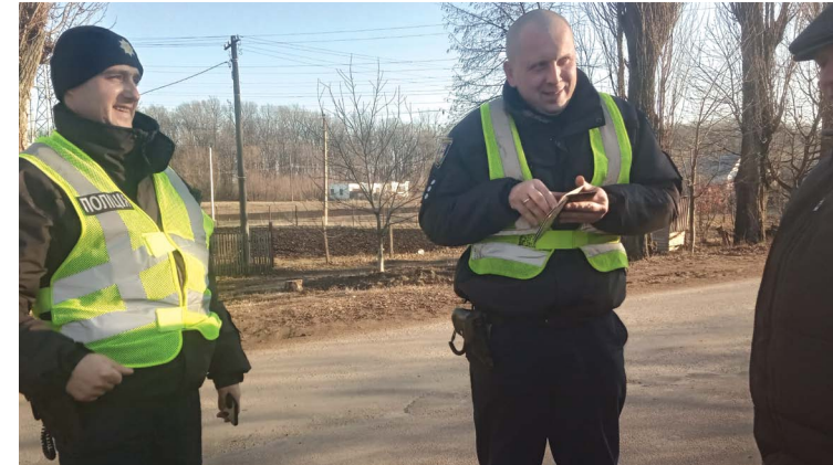
Патрульні поліцейські мають за 7 хвилин приїхати на виклик у місті

Надходить інформація, що таксист автомобіля «Ланос» їздить у стані наркотичного сп'яніння. Патрульні об'їжджають містечко і врешті знаходять водія. Оглядають посвідчення і просять проїхати на експертизу. — Я вчу закони і знаю все, але відмовляюсь їхати, — каже водій. Працівники поліції попереджають, що відмова від експертизи, це є свідоме визнання своєї вини, а далі оформлення протоколу за 130-тою статтею і судове засідання, штраф у розмірі 10 000 гривень та вилучення водійських прав. Під'їжджає ще один екіпаж патрульних, чоловіка забрали на експертизу до Вінниці. За кілька хвилин надійшов виклик про пограбування. Працівники поліції набрали швидкість і поїхали за оперативною групою.