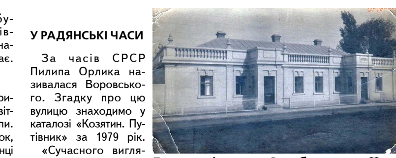
Будинок і аптека Скробецького. На — авт.) нові житлові будинки зі світлопросторими квартирами. Тут виросли багатопверхові споруди — універмаг «Ювілейний», Будинок побуту, ресторан «Козятин», — йдеться у джерелі.

«1967 року в ознаменування 50-річчя Великої Жовтне-