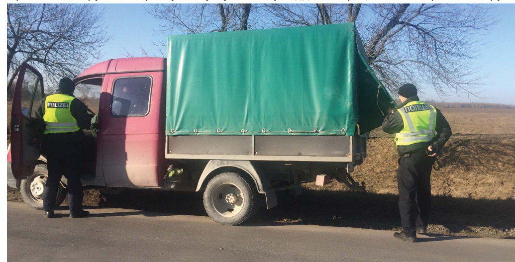
Екіпажі патрулюють по всьому району – цілодобово

— Відсипаємося, більше часу ні на що не вистачає, — говорять в один голос поліцейські. Моє денне чергування з поліцейськими непомітно добігає кінця, а от у поліцейських воно триватиме до ранку. Я побажала їм легких чергувань!