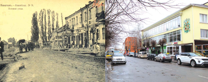
Ліворуч — вулиця Пилипа Орлика понад сто років тому. Праворуч сучасний вигляд

«1967 року в ознаменування 50-річчя Великої Жовтне-