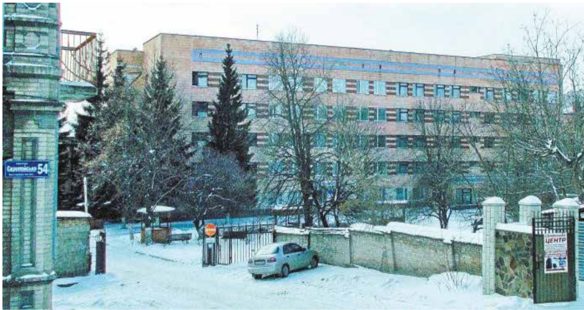
→ Бердичівський госпіталь ветеранів війни проводить лікування та реабілітацію учасників АТО безкоштовно

Життя прожити – не поле перейти. А присвятити своє життя чесному служінню людям – то є велика сила й мудрість. Професія лікаря в усі віки почесна й шанована, а якщо лікар за покликанням – то це щастя для всіх страждених.