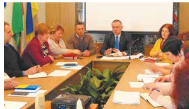
Відбулося засідання Координаційної ради з питань місцевого самоврядування