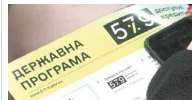
Крок до мрії про власний бізнес. Як працює програма доступних кредитів?