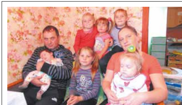
Закохані та щасливі: молода пара з Врублівки виховує вісьмох дітей

На виявлене порушення Новоград-Волинською місцевою прокуратурою в інтересах держави заявлено позов,