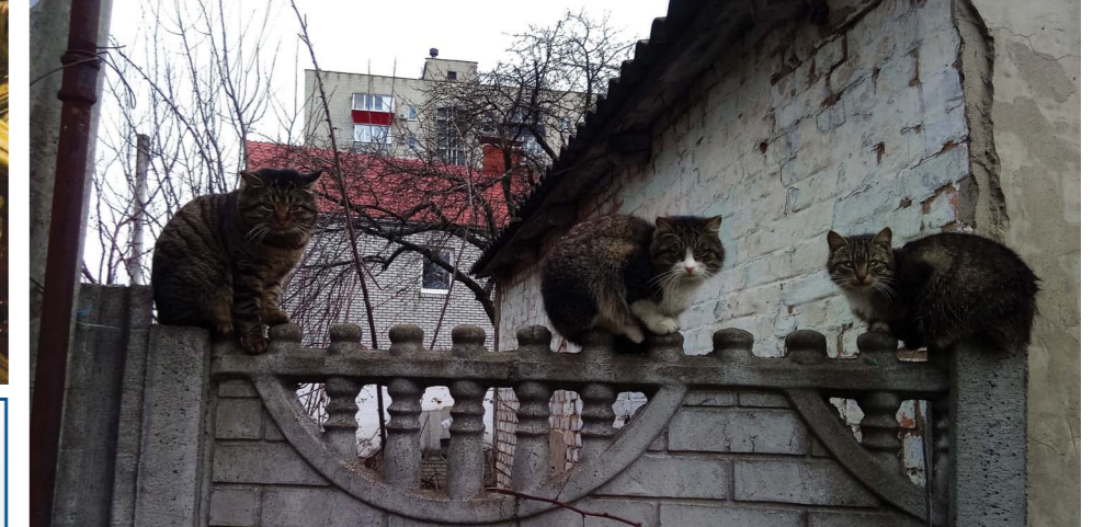
Будинок на перехресті Грушевського та Мічуріна. На паркані сиділо троє котів. На цю трійку озиралася усі перехожі.