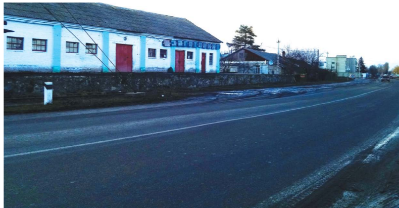
Частина вулиці Довженка в районі м'ясокомбінату опинилася за крок до перемоги. На ремонт витратили 1,4 мільйона