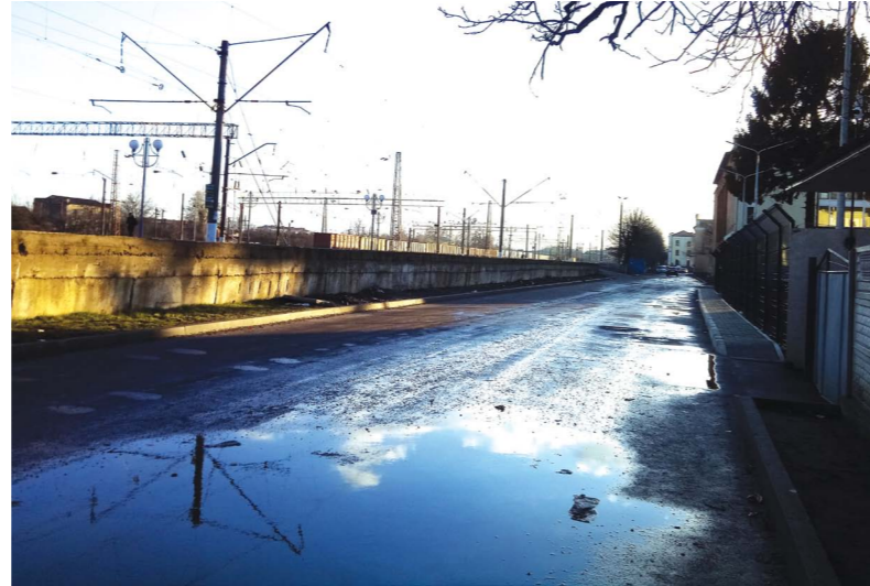
Вулиця Привокзальна. Тут зробили капремонт майже за 1,5 мільйона гривень

Власне ремонт коштував міському бюджету 1 мільйон 498 тисяч 224 гривні. Його також замовили компанії «Шляхбудматеріали». Авторський нагляд за 2 тисячі 60 гривень провела вищезгадана підприємця Валентина Васильківська. Вона також виконала проект за 12 тисяч 660 гривень. Технічний нагляд за ремонтом коштував 22 тисячі 358 гривень і 40 копійок. Його провела «Служба технічного нагляду». Ця сама фірма провела експертизу кошторисної частини проектною документації за 3 тисячі 240 гривень.