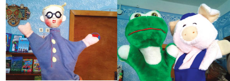
Ліворуч ляльки театру "Золотий ключик". Праворуч нові іграшки бібабо, з якими виступають у "Кольоровому диві"