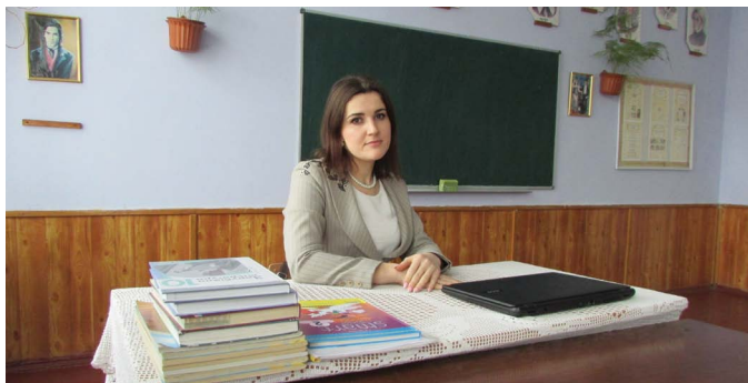
ВЧИТЕЛЬКА, ЯКА МРІЯЛА СТАТИ ПРАВООХОРОНЦЕМ