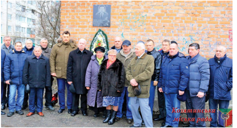
Козятинська міська рада

пам'ятного знаку «Чорний тюльпан» стало можливим завдяки зусиллям козятинської влади. Саме за кошти міського бюджету, а це 300 тис.грн, вдалося встановити даний монумент. Відтепер сюди приходитимуть рідні, побратими загиблих бійців і всі, хто прагне їх згадати.