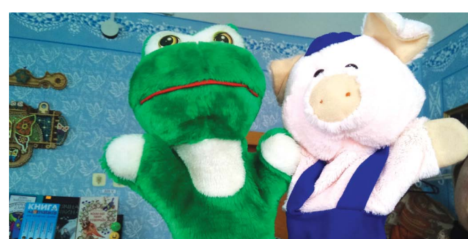
ПРО ГУРТОК ЛЯЛЬКОВОГО ТЕАТРУ