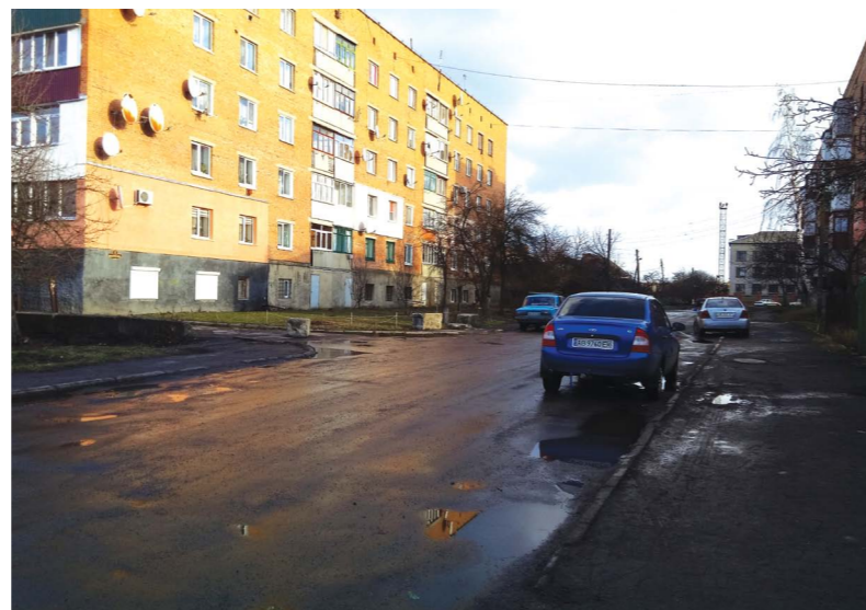
Вулиця Підгорбунського могла посісти першу сходинку у нашому рейтингу. Але через відміну торгів на аукціоні тут зробили лише поточний ремонт за 88,6 тисячі