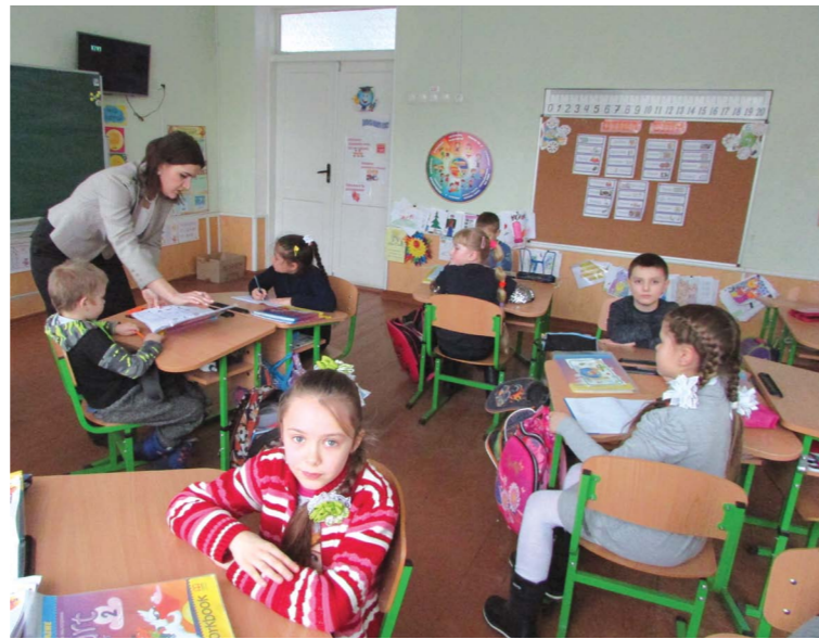
Урок англійської мови в другокласників Махаринецької школи