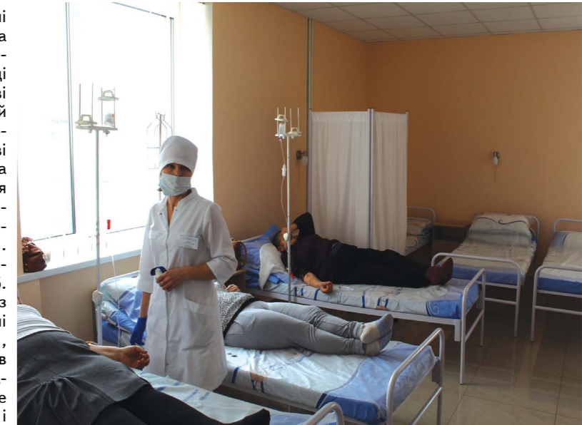
Денний стаціонар сімейної медицини розрахований на 10 ліжок

такими діями стоять людські долі, понад дві сотні працівників медичного закладу, а також за вершувати ваше логічне мислення і озвучувати, що при об'єднанні потрібно буде скоротити більше ста осіб, але це ви хочете робити тепер іншими руками.