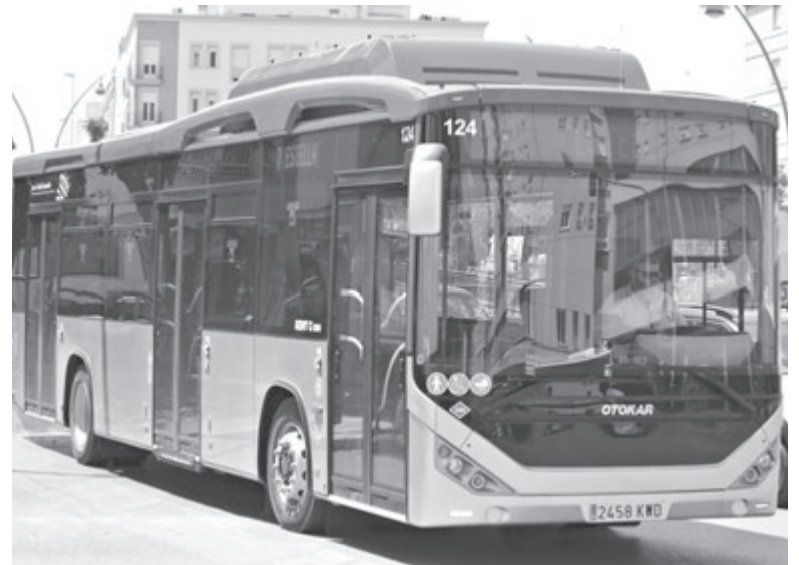
Автобус Otokar у Іспанії. Машина має довжину 12 метрів та може одночасно перевезти до 100 пасажирів

«Otokar Kent CNG» — це автобуси з низькою підлогою, довжи-