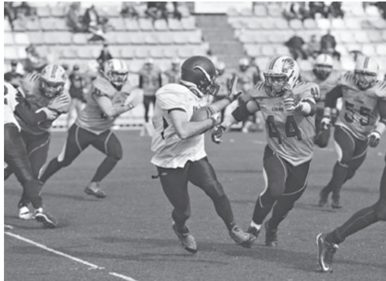
«Вовки» у суперлізі будуть міряться силами з трьома столичними клубами