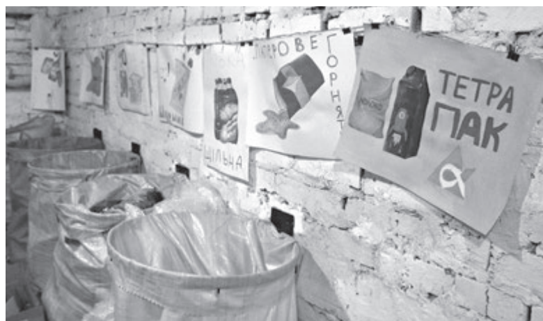
Щомісяця школярі здають на переробку близько 400 кілограмів сміття