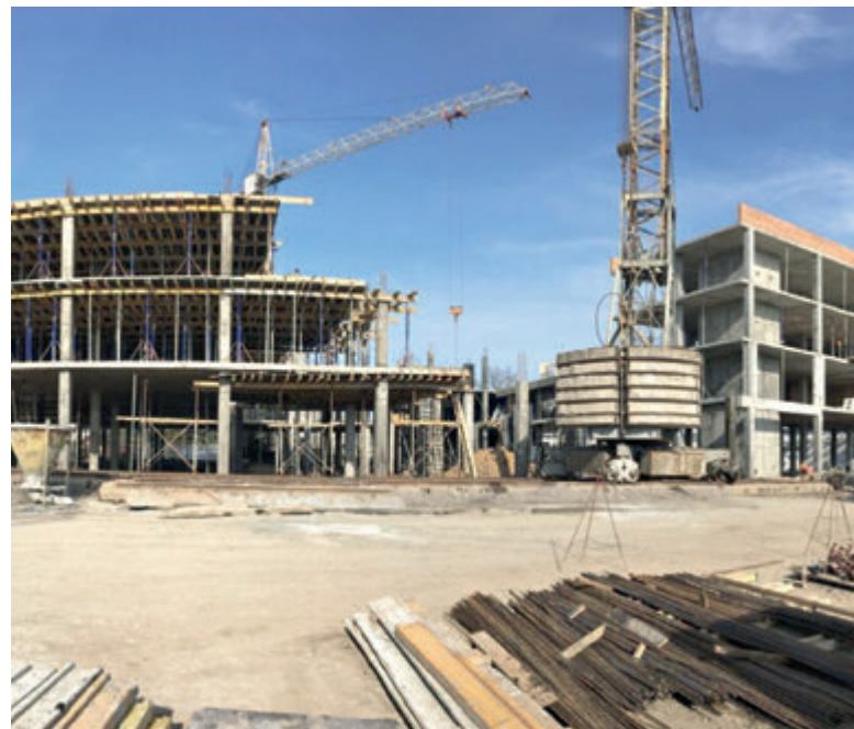
Об'єкт будують з минулого року. За цей час робітники товариства «БМУ-6» звели каркас та декілька поверхів

До того ж, будівництво без дозвільних документів не є кримінальним правопорушенням, за твердженням апеляційного суду. Отже, арешт ділянок, який раніше наклали за ухвалою міського суду, скасували. І ухвала апеляційного суду оскарженню не підлягає ( bit.ly/3aKW3rX ).