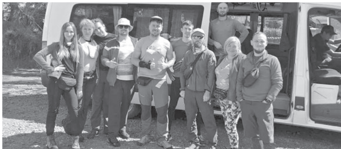
Українці в столиці давньої імперії інків Куско. Група вінницького турклубу поки що знаходиться в Перу та очікує на інструкції від українського МЗС

Пізно ввечері того ж дня оголосили надзвичайну ситуацію. Від сьогодні (16 березня — авт.) сталася моментальна заборона на поїздки міжміським транспортом, зупинився туризм і не працюють всі заклади, крім продуктових та медичних крам-