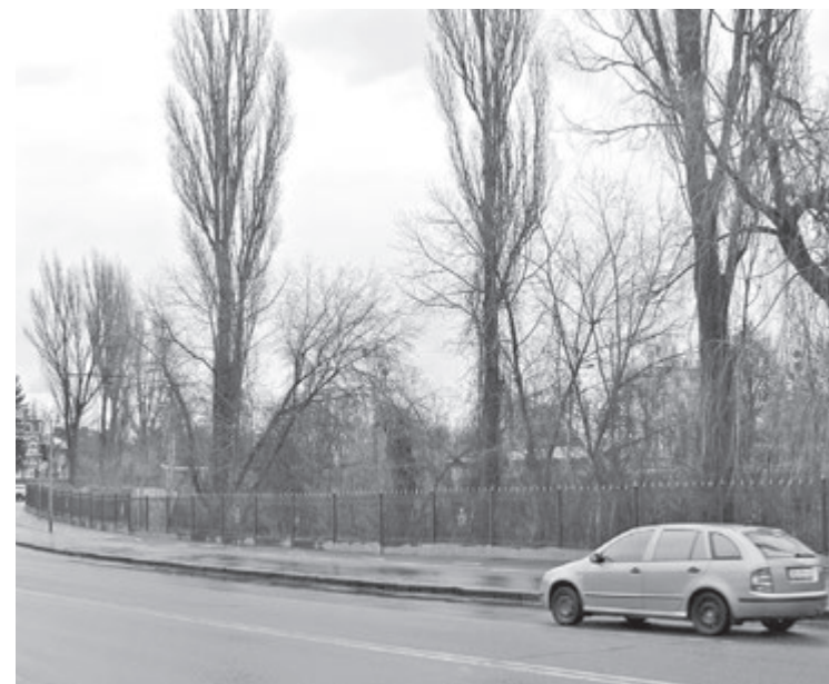
Орієнтовне місце розташування нового об'єкта біля Центрального парку. За планами, він матиме 44 офіси, 25-метровий басейн та зелений сквер просто на даху

нерухомого майна. За наявною інформацією, у компанії всього два співробітники (станом на 2017 рік).