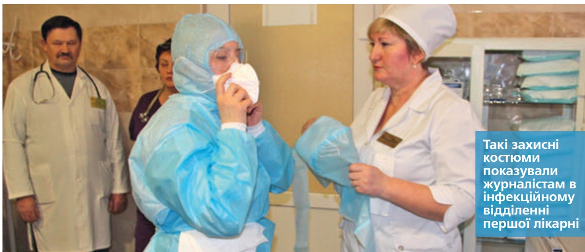
Такі захисні костюми показували журналістам в інфекційному відділенні першої лікарні