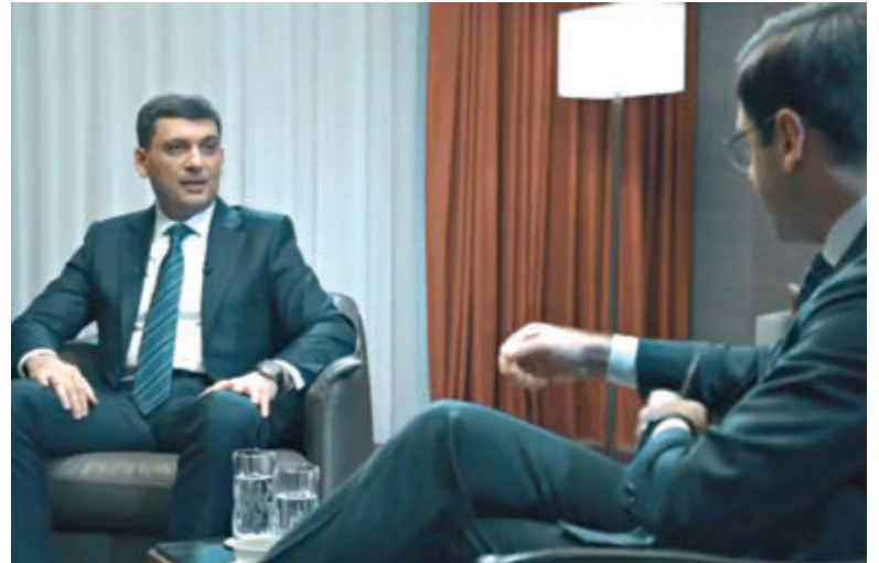
Володимир Гройсман назвав коронавірус тестом на здатність долати виклики

Наслідок безвідповідальності — не тільки хвороба, а й згорання можливостей — розвитку, зрос-