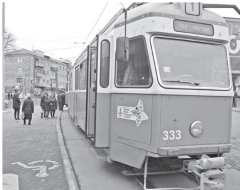
Простяг не заходити в транспорт, де багато пасажирів. Таке обмеження діятиме протягом всього карантину

— Що на поліцію покладені функції з дотримання виконання