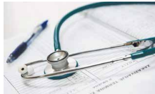
Медреформа «вторинки»: робота над помилками