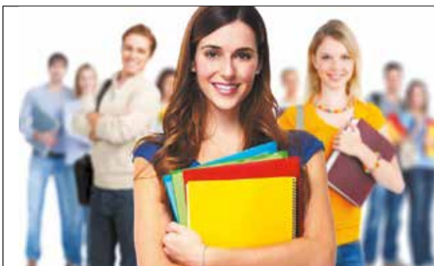
До уваги абітурієнтів: як проходитиме цьогорічна вступна кампанія

День матері – це ще один чудовий привід нагадати неньці про свою любов і турботу. Всі матусі чекають уваги своїх дітей у цей день, хочуть бачити їх щасливими і бути поруч. Важливо цінувати матерів, поки вони з нами, поважати і дякувати їм за все.