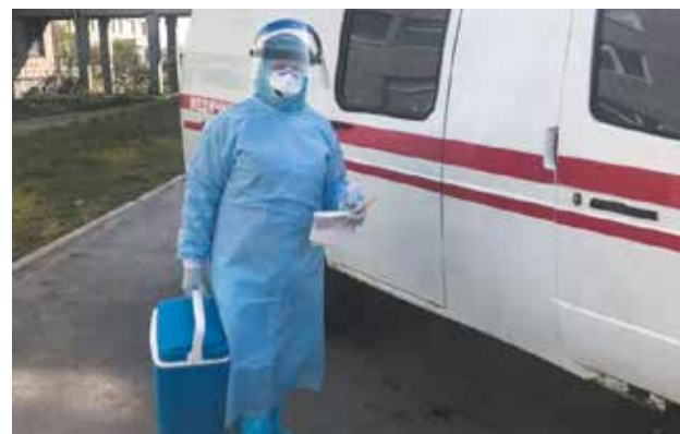
На Романівщині – перший випадок COVID-19