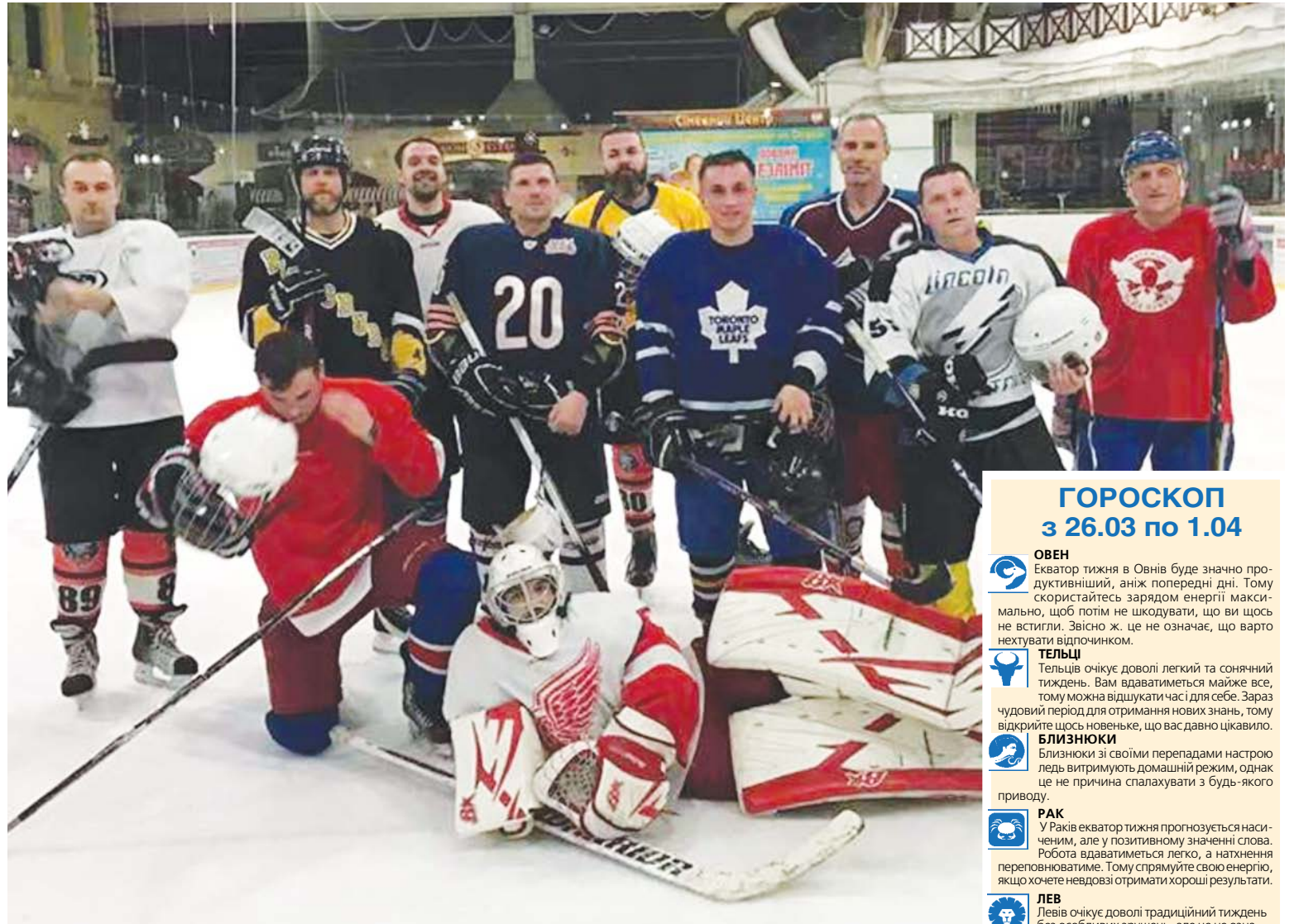
Команда "Мегалот" після матчу

— Зараз в нашому чемпіонаті через коронавірус перерва. Тож на ігри у Вінницю з 12 березня не їздимо. Коли їздили,