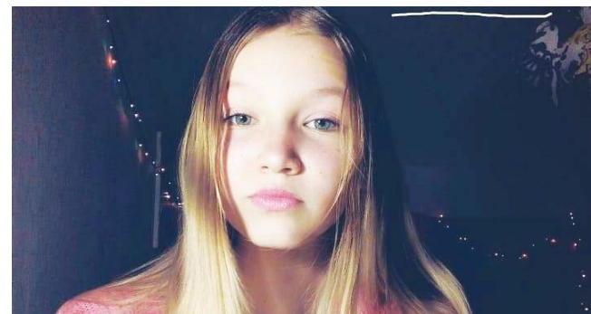
ОЛІ БАЛЬШАНЕК ПОТРІБНА ДОПОМОГА