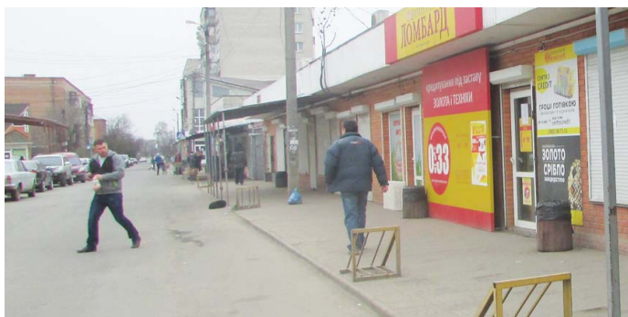
ЯК ЗМІНИЛОСЯ ЖИТТЯ КОЗЯТИНА В КАРАНТИНІ