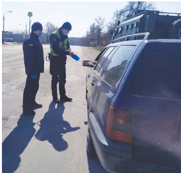
Нацгвардієць з поліцейським проводять перевірку на Махнівському блокпосту

— Усіх без винятку не можемо перевірити, мабуть, фізично. Більше транспорт зупиняємо, заповнений пасажирами, — каже речниця. — Робимо температурний скринінг кожній людині в авто і, якщо буде підвищена температура, повідомлятимемо медиків або навіть викликатимемо швидку допомогу, якщо є в людини ознаки захворювання.