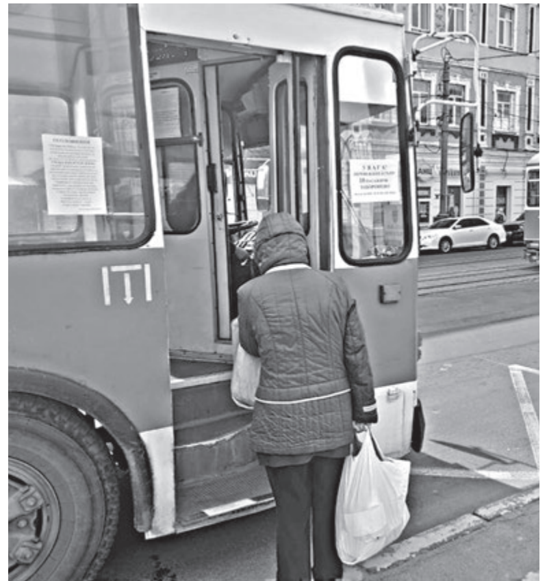
На тролейбусах є нові наліпки «Спеціальні перевезення». Також у мерії дозволили перевозити більше 10 пасажирів на час карантину

— Працівники «Муніципальної варті» сьогодні зупинили одну машину, в якій було два пасажири без цих перепусток. Вони їм пояснили, що на час карантину для проїзду в транспорті потрібні ці довідки, захисні маски та рукавички. Але висаджувати не стали, — каже Гота.