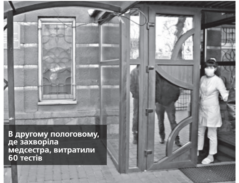
В другому пологовому, де захворіла медсестра, витратили 60 тестів

Лабораторна перевірка — це коли тести роблять лише у вірусологічних лабораторіях зі спеціальним обладнанням методом ПЛР (полімеразна ланцюгова реакція). Таке тестування вважають більш точним, результати очікують майже через тиждень.