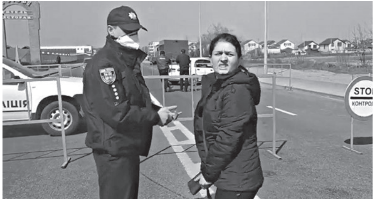
На пунктах є правоохоронці та військові. Вони вибірково перевіряють автомобілі, опитують про самопочуття людей та можуть попросити відкрити багажник

Очільник ОДА Владислав Скальський 30 березня повідо-