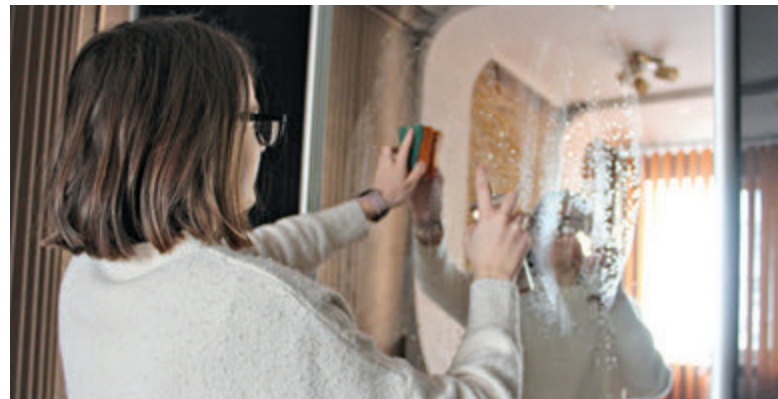
Двічі на день треба робити вологе прибирання. Одне з деззасобами, інше — з миючими засобами