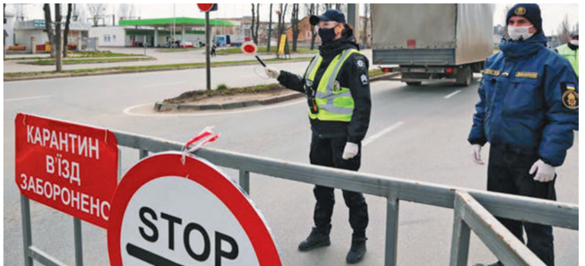
На пунктах є правоохоронці та військові. Вони вибірково перевіряють автомобілі, опитують про самопочуття людей та можуть попросити відкрити багажник