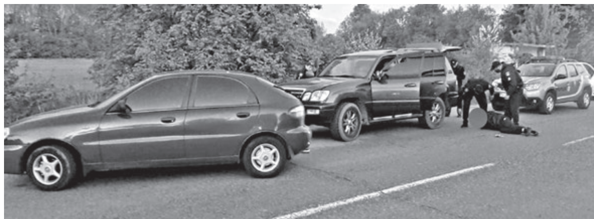
Зловмисників затримали за містом. Туди вони вивезли постраждалих і вимагали грошей

— Поки що можемо говорити тільки те, що дозволено у межах розслідування, — одразу зауважив Ковальський. — Підозрювані затримані. Під час обрання запобіжного заходу суд задовольнив усі клопотання прокуратури. Слідчі ДБР також підготували клопотання про арешт транспортних засобів, прокуратура