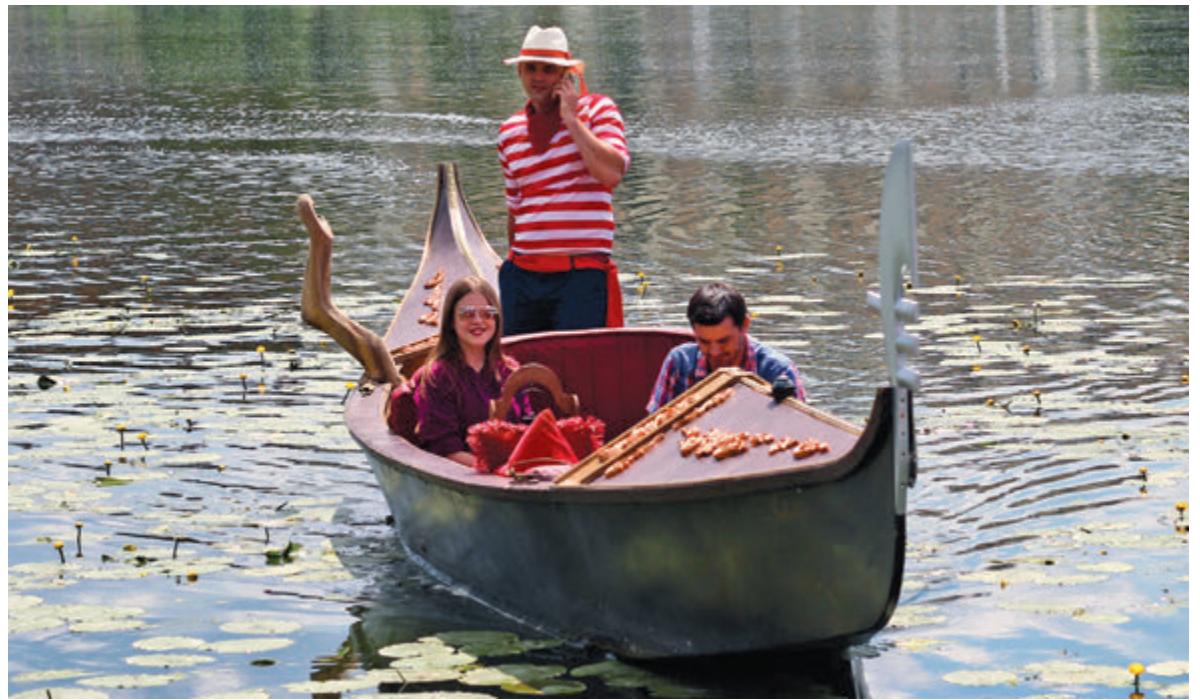
Коли прогулянки на гондолі стануть можливими, поки що невідомо. Це залежить не тільки від карантину, але й від нересту риби

— За питаннями навігації щороку окремо слідкують іхтіологи, які дивляться, чи вилупилась