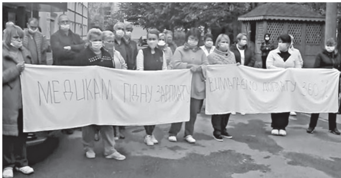
Медики районки вийшли на протест 4 травня. Один з лікарів заявляв, що отримав 86 копійок доплати за роботу з хворими на коронавірус

«За квітень медперсонал надбавок ще не отримував. Постановою Кабміну від 25 березня була виділена Вінницькій області субвенція на медицину в сумі майже 110 мільйонів гривень. Гроші надійшли. На Вінницьку ЦРЛ для