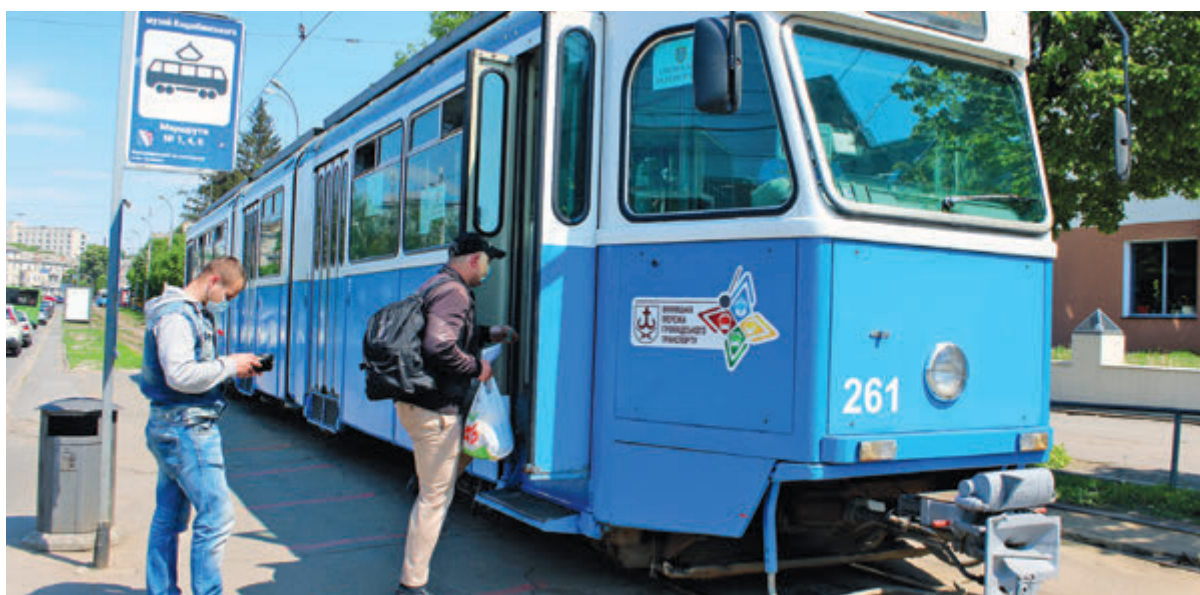
Проїзд під час карантину — це наче гра в лотерею. Якщо водій не зверне увагу на перепустку, то можна проїхати й без неї

► Як працює транспорт, чи можна розраховуватися готівкою та де і як за новими правилами оформити перепустку?