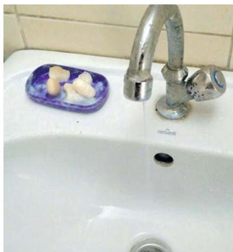
У туалеті в парку ім. Тараса Шевченка на рукомийнику є лише обмилки господарського мила