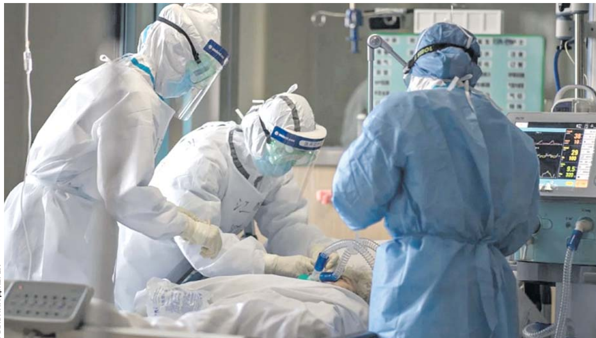
Рішенням штабу визначено перепрофілювати Тернопільську лікарню швидкої допомоги у госпіталь. Про це й раніше говорили на засіданнях. Госпіталь розгорнуть, якщо ситуація буде ще гіршою

— У лікарні швидкої допомоги бачимо напружену ситуацію, — каже начальник міського