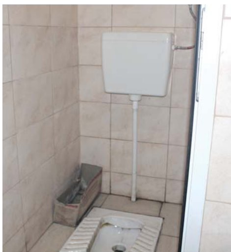
У «Топільче» вбиральня виявилась найчистішою. Тут є туалетний папір та мило