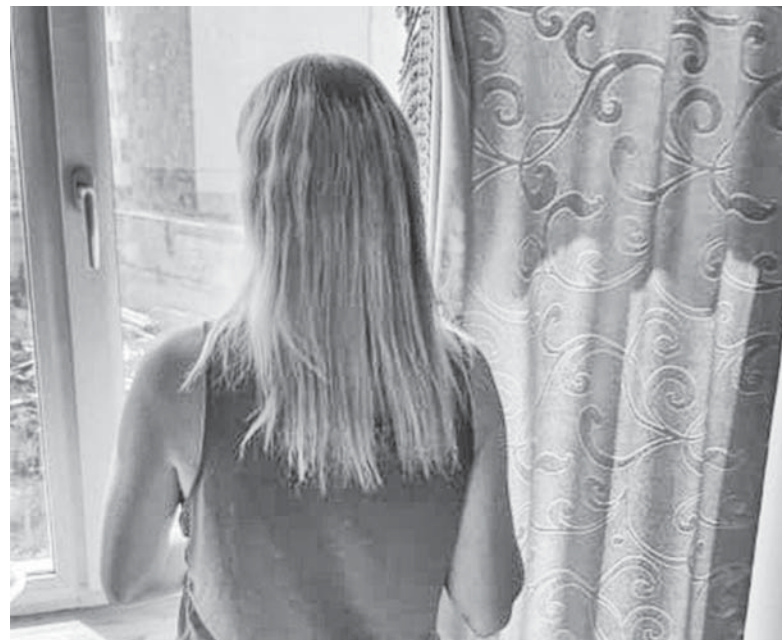
Це була друга вагітність жінки. Вона розповідає, що чоловік після звістки про вагітність відразу запитав, скільки коштує переривання

Ми більше не спілкувались, хоч живемо практично в сусідніх будинках. Я залишилась сам-на-сам з проблемами. Він жодного разу не намагався налагодити зв'язок. Тай я сама думаю, що все, про що ми мали поговорити — ми вже сказали.