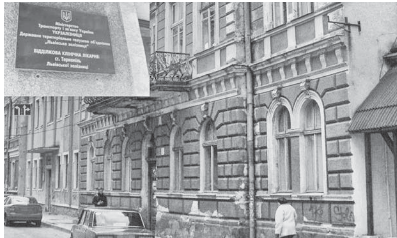
Залізничну лікарню закрили, а приміщення хотіли віддати за здешевленою ціною