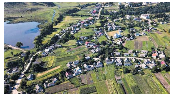
Для більшості відео та фото використовують професійну техніку. Чимало кадрів знято з висоти пташиного польоту