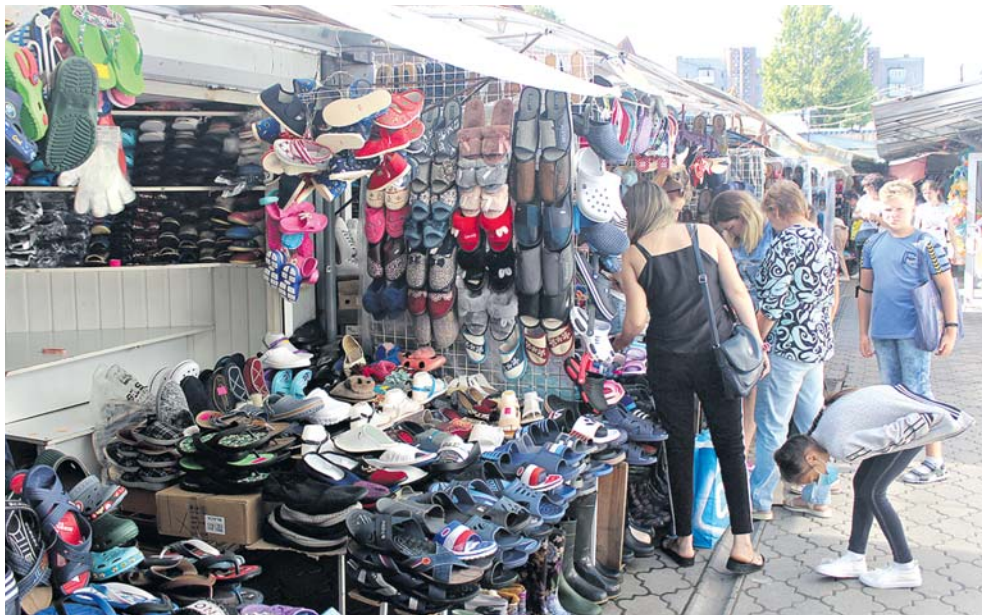
На ринку є чимало скупчень людей