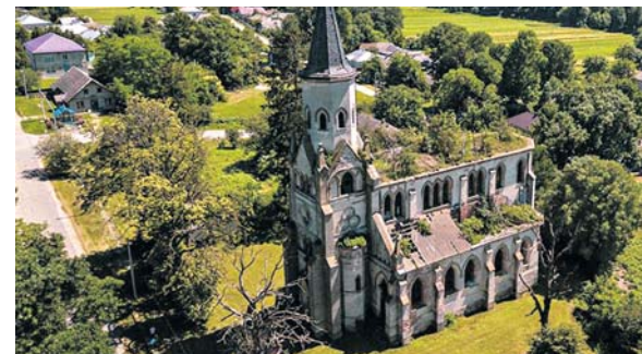
Одна із останніх робіт — відео з Іванівської ОТГ на Тербовлянщині