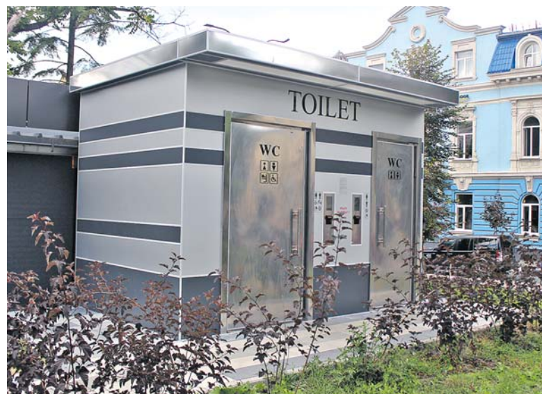
Туалет біля фонтану «Кульбаба» встигли понищити. Один із дисплеїв розбили