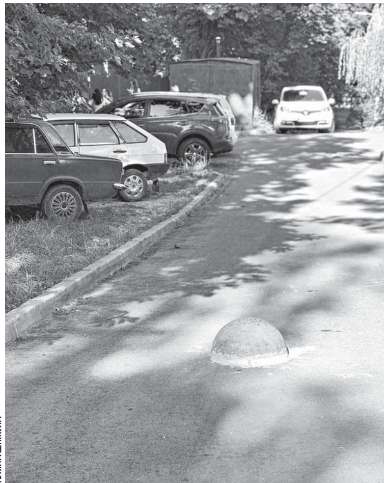
Обмежувач руху біля садка з'явився кілька тижнів тому. Батьки просять забрати, мешканці сусіднього будинку — проти