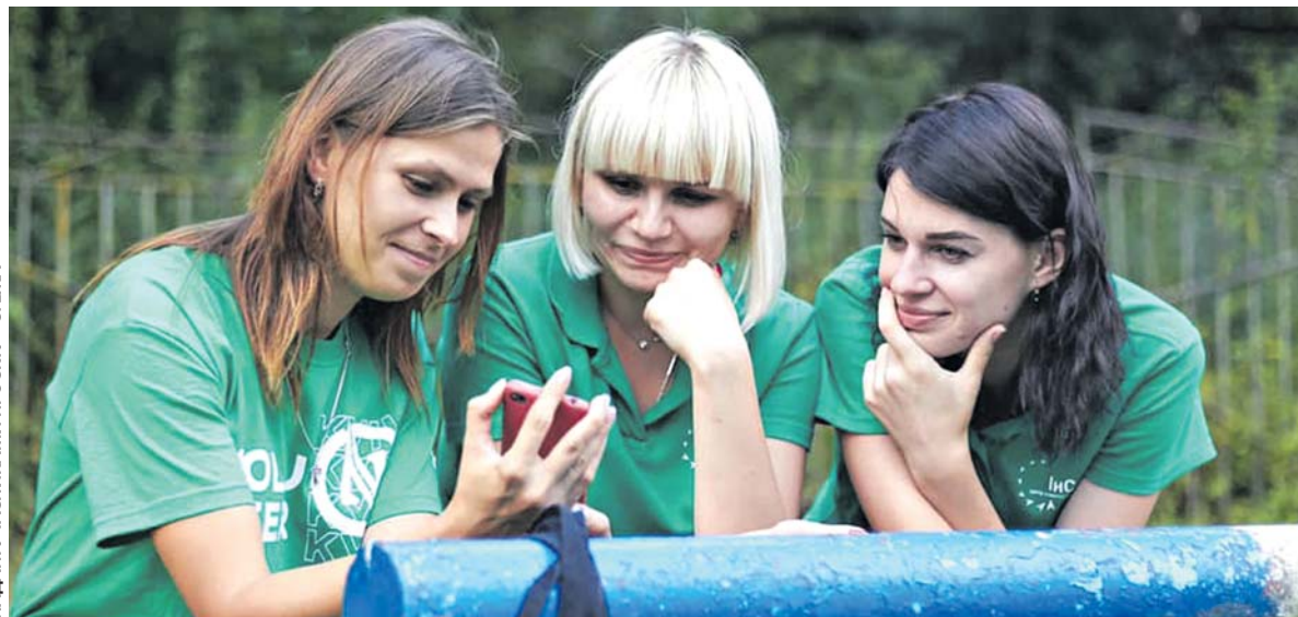
У команді авторів проєкту активісти із Шумська та Кременця

Активісти кажуть, що їм приносить задоволення і процес, і відчуття того, що з допомогою відео та фото про такі місця дізнається весь світ.