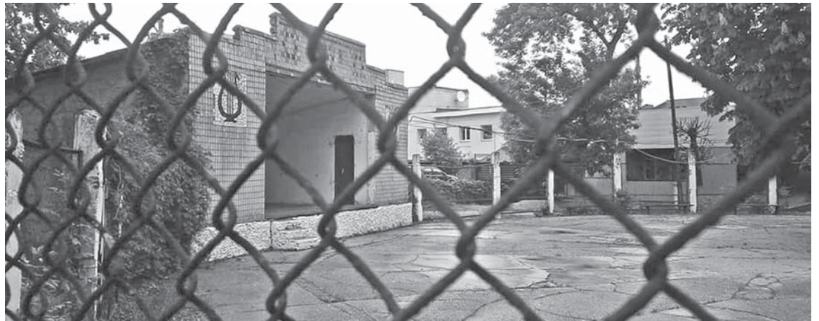
Нині Клітка забута й захаращена. На сцені вже давно ніхто не виступає