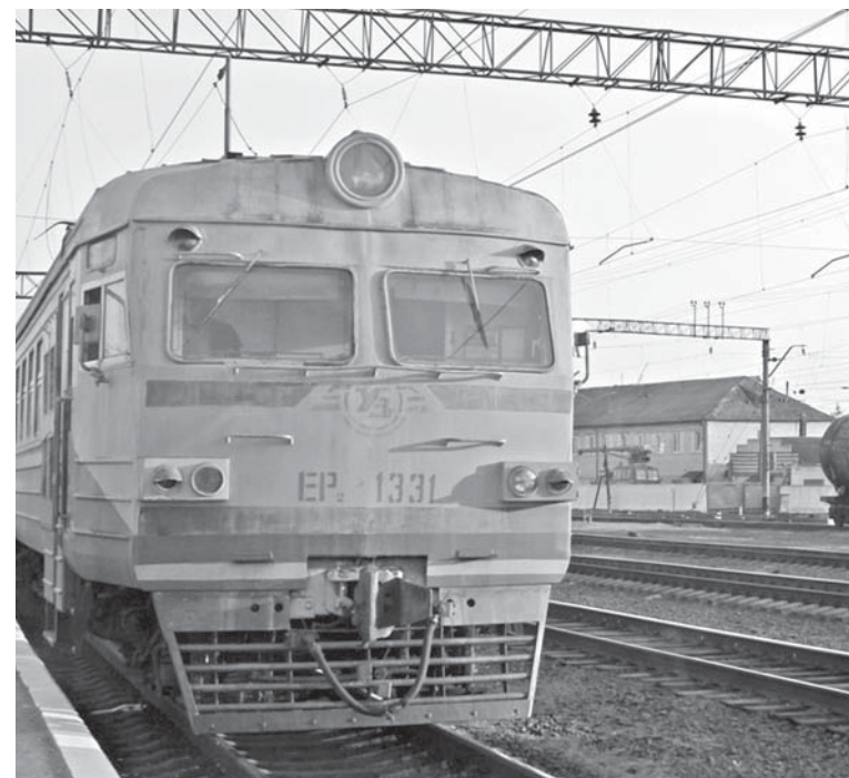
Відновлення електро та дизель поїздів відтермінували на 15 червня

— На підставі рішення комісії техногенно-екологічної безпеки та надзвичайних ситуацій ОДА про погодження чи непогоджен-