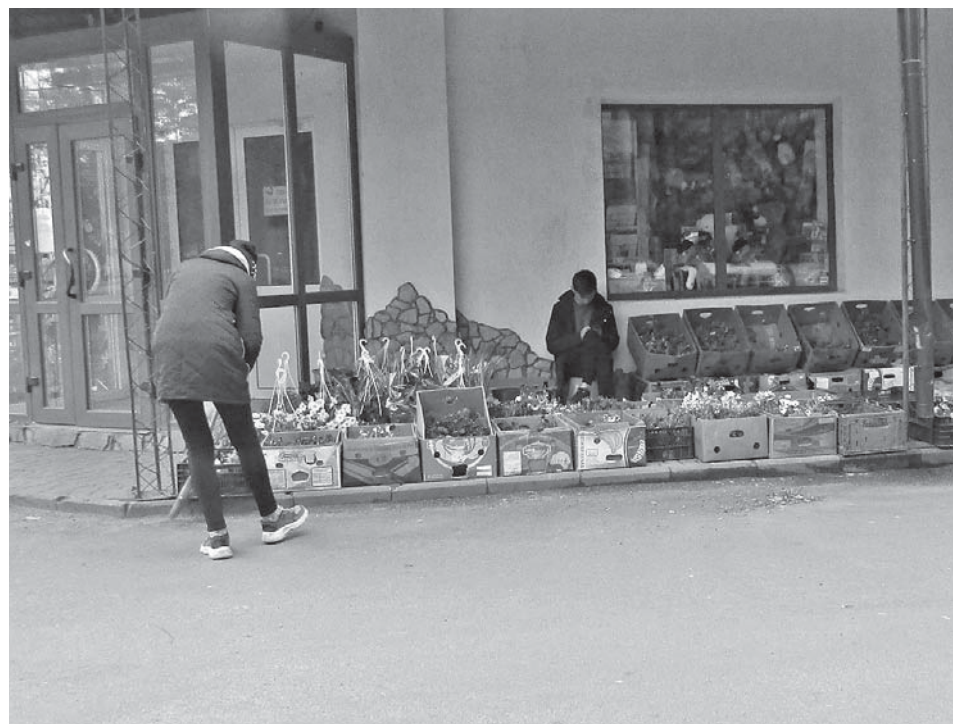
Свого сміття не мають, метуть те, що вітром принесе

На вулиці Бойка, Виговського, Чехова, Д. Нечая, Червоної Калини просять поставити ліхтарі, хоч на перехрестях. Біля магазину вуличне освітлення є. Але дев'ять ліхтарів на п'ять вулиць — це небагато, кажуть люди.