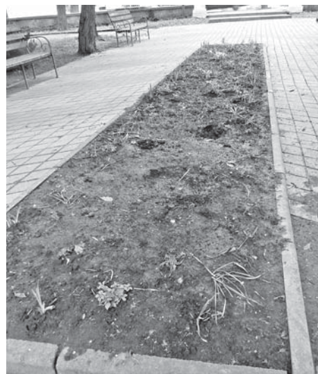
Три проблеми клумби — мало сонця, заливає дощем і не може сховатися від злодіїв