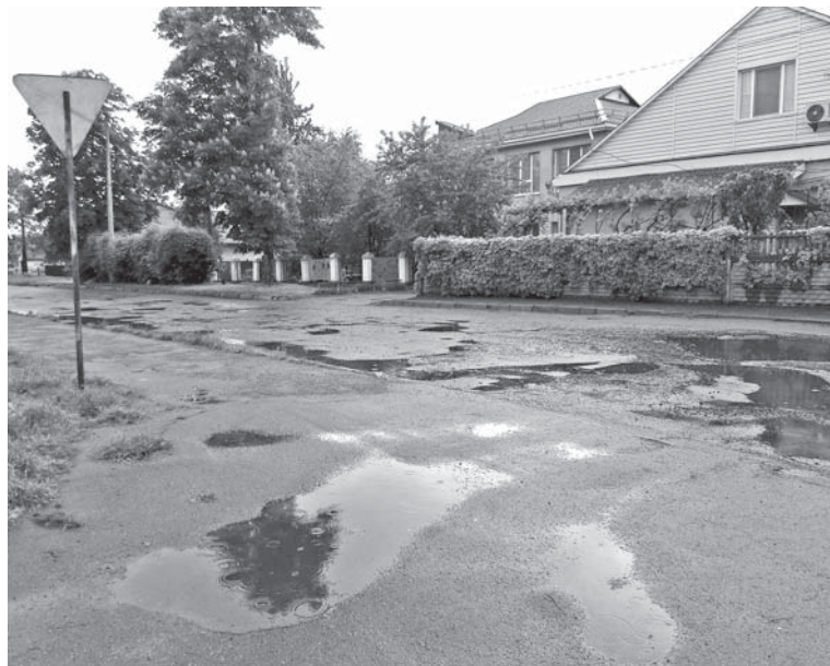
Найбільше вибоїв на тій частині дороги, що за перехрестям із вулицею Героїв Майдану. Саме ця ділянка найбільше потребує ремонту