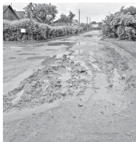
Бездоріжжя на вулиці Чайковського