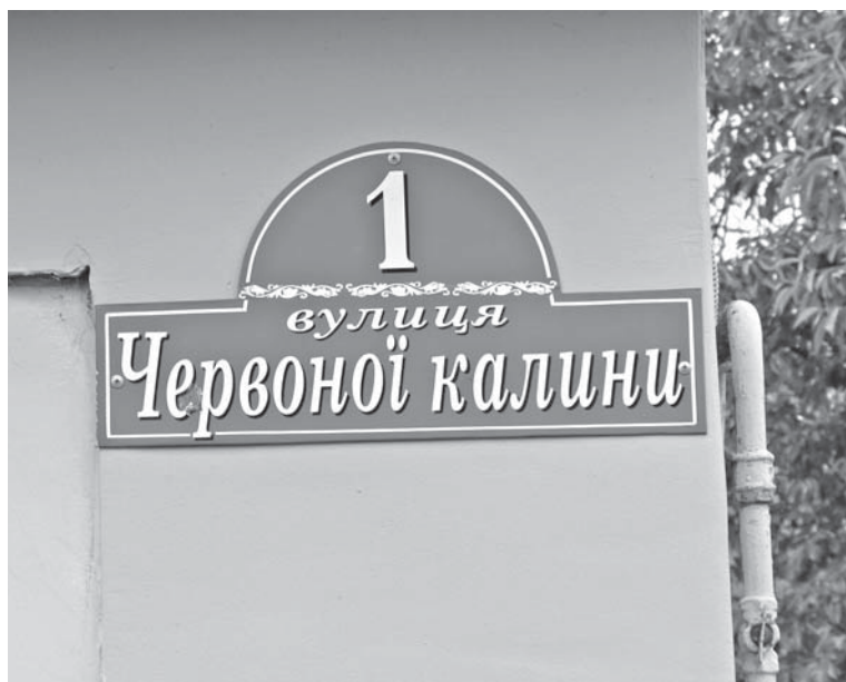
Таблички вкрай потрібні для екстрених служб, щоб вчасно відреагувати на виклик