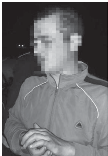
У цього водія рівень алкоголю в крові перевищував допустиму норму в 20 разів