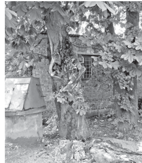
Аварійний каштан у дворі пошти. Трухлявий стовбур не витримав стільки води