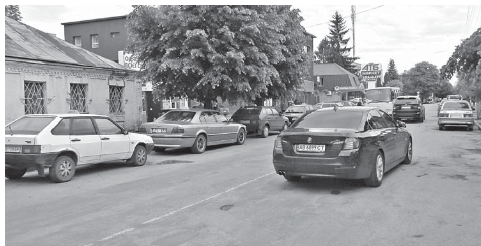
Під час карантину деякі вулиці міста чимось нагадують авторинок