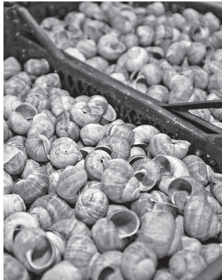
Щоб заробити на равликах, потрібно назбирати мінімуми 20 кілограмів, — їх багато у лісах та біля ставків

Додамо, що в природі равлик живе в середньому 7–8 років. Вони виконують роль асенізаторів, поїдаючи рештки рослин, що розкладаються, та екскременти тварин. Однак молоді равлики дуже шкодять культурним рослинам, поїдаючи бруньки, плоди.