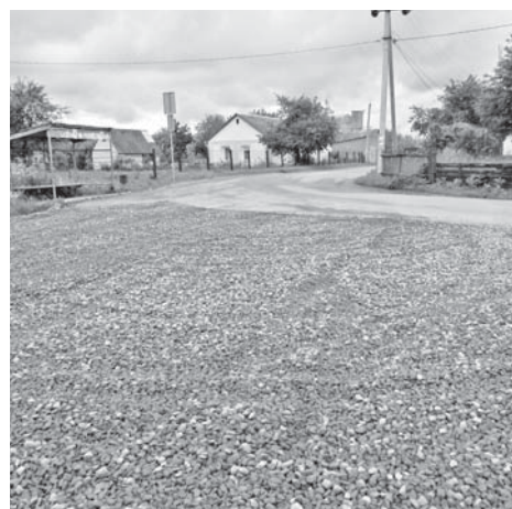
Підсипали розворот маршруту №3. Тепер взимку не доведеться йти на зупинку до магазину