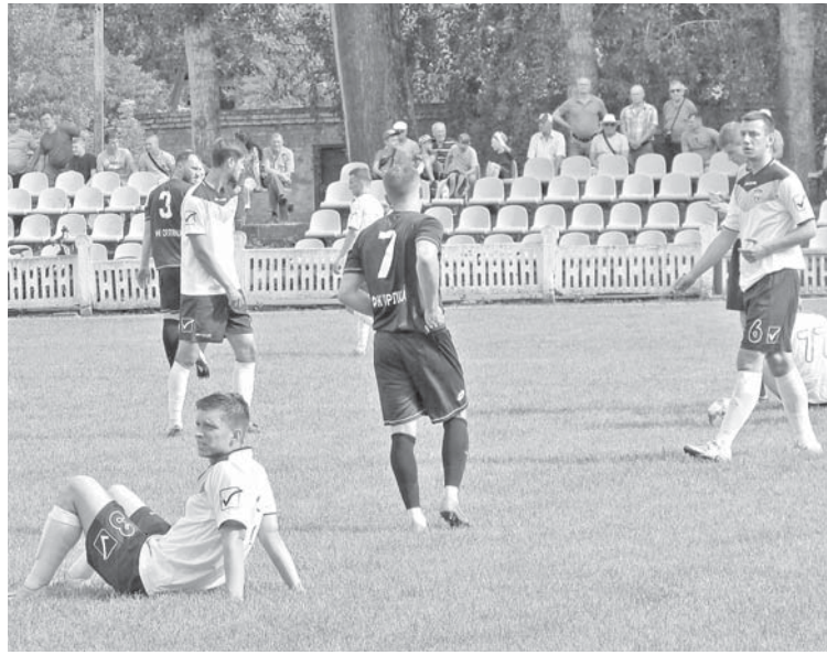
В кубкових зустрічах легких перемог не буває. Але не зважаючи ні на що, наші земляки перемогли з рахунком 3:1

— Грають, як можуть — відповів той. — Захист команди в такому складі грає вперше. А в «Томашпіль» перейшли гравці середини поля минулорічного лідера обласної першості «Світанок Агросвіт». Без ігрової практики команди, якої ви хочете гри? У команді «Моноліт» є класні виконавці.