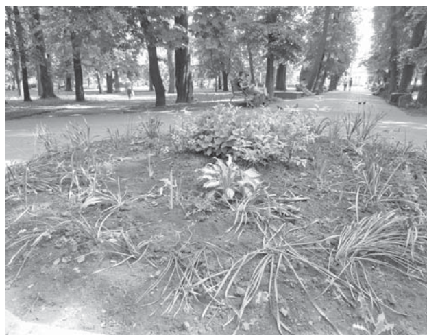
Бідні квіти в міському сквері. Якщо рукасті не копають, то собаки виспляться