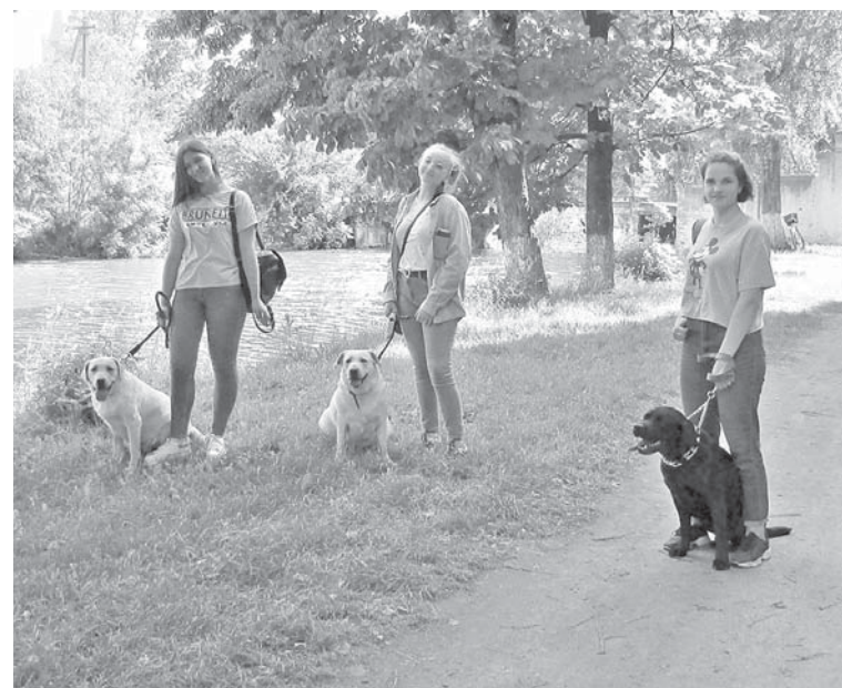
Лорд, Дора та Беті на прогулянці. Звісно, не самі, зі своїми господарками)