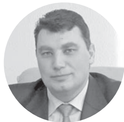
Олександр Пузир міський голова Козятина