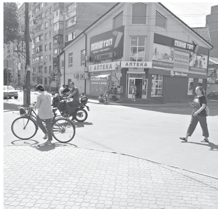
Пішоходів-порушників будуть карати штрафами у 255 гривень

У Козятині ситуація з пішохідними переходами та пішоходами не проста. Багато козятинчан нарікають на те, що автівки часто-густо не зупиняються перед «зебрами». Мовляв, водії не звертають уваги та «не поважають» пішоходів на дорозі. У свою чергу водії скаржаться, що козятинчани нехтують правилами дорожнього руху і перебігають дорогу, де їм заманеться.