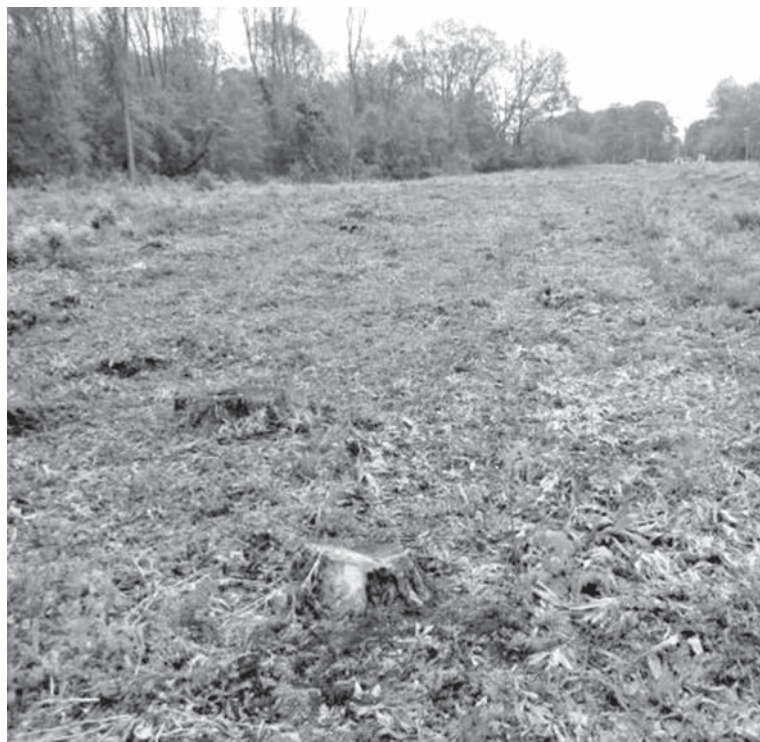
В урочищі «Сестринівська дача» на місці вирубки садять молоді дерева. Тут ростуть маленькі модрина