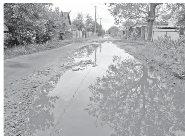
На вулиці Данила Нечая рух транспорту такий, що місцеві мешканці не встигають засипати канави