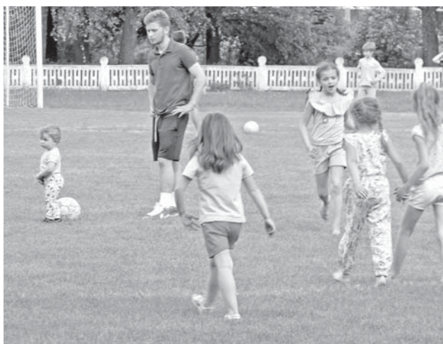
Нарешті сонячно і дітлахи можуть побігати. Добре, що на стадіоні місця вдосталь