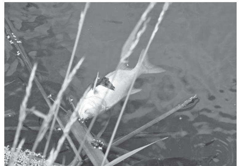
На Новий став злетілися чайки ловити рибу, яка плаває на поверхні, ловлячи ротом повітря