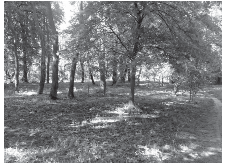
Сільський парк Дзідзінок заживе новим життям. Тут буде кілька спортивних майданчиків

— Щоправда, до кого я безпосередньо звертався, мені ніхто не відмовив, проте надалі хотілося б, щоб мешканці нашої громади були більш активними. Лише від них самих залежить, як сьогодні розвиватиметься наша громада, — резюмує пан Віталій.