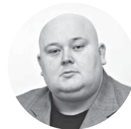
Юрій Світлак в.о. міського голови Жмеринки