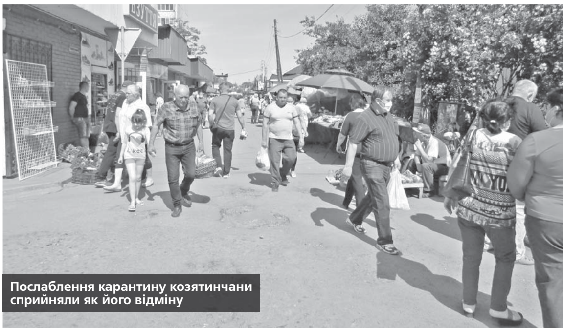
Послаблення карантину козятинчани сприйняли як його відміну