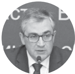
Владислав Скальський голова Вінницької ОДА