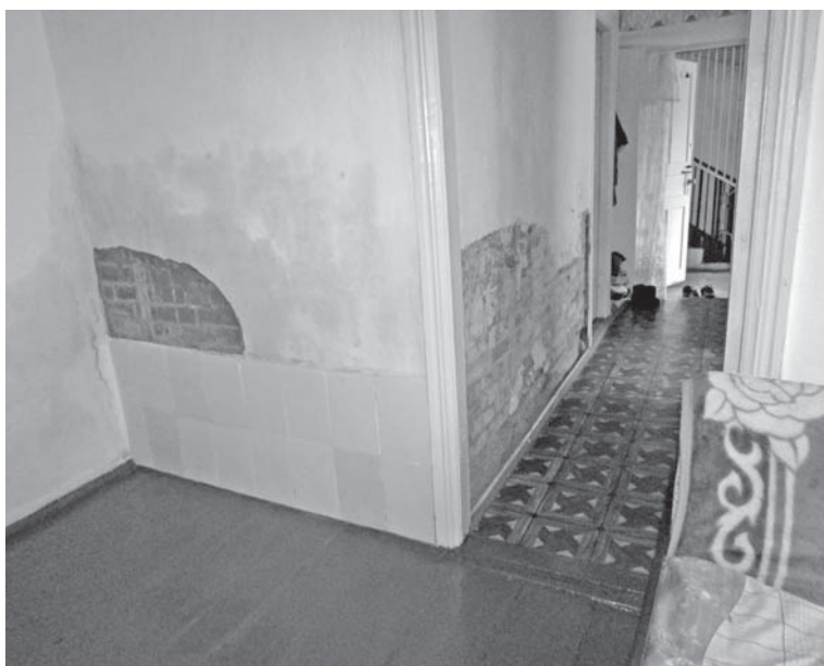
У вітальні та спальні на нижній частині стін сліди вологи. У вітальні відпала штукатурка