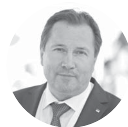
Сергій Редчик міський голова Хмільника