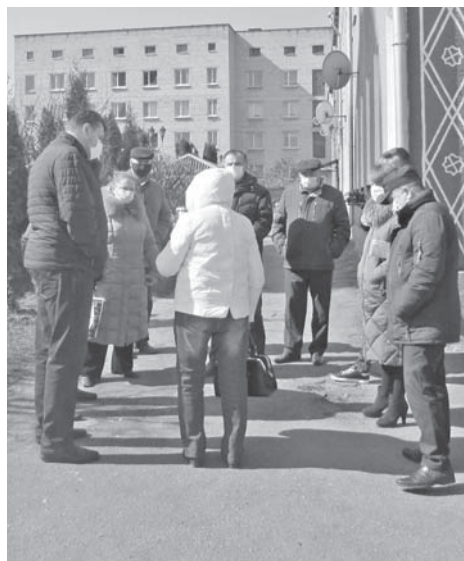
Тема переселення в терцентрі піднімалася не раз