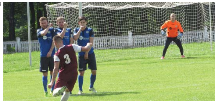
ЗІГРАЛИ ДВА МАТЧІ ЗА ТРИ ДНІ