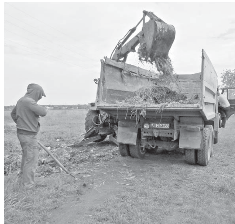
На сільському кладовищі є господар. Перед проводами бур'яни прибрали

Останньою нашою зупинкою була вулиця Данила Нечая. Інтенсивність автомобільного руху на цій вулиці зростає в рази, коли зробили дорогу на Джерельній. Раніше, коли на Нечая було більше молоді, вони дорожні вибоїни власноруч засипали відходами від будматеріалів. Зараз ремонтувати дорогу на згаданій вулиці місцевим мешканцям не під силу.