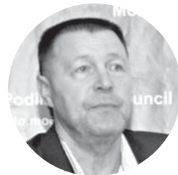
Петро Бровко міський голова Могилів-Подільського