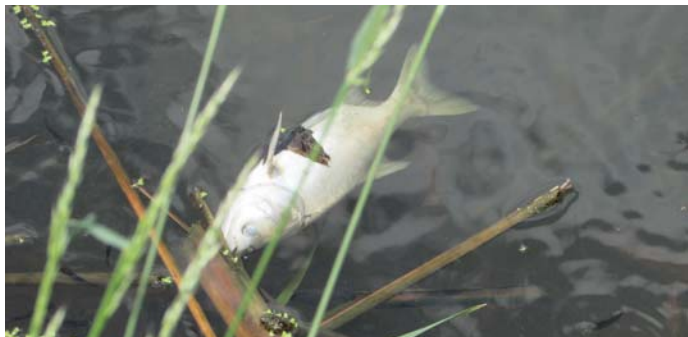
В ІВАНКІВЦЯХ ЗНОВУ ГИНЕ РИБА