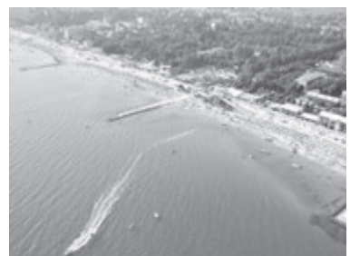
ЗАЛІЗНИЙ ПОРТ (Херсонська область)

Це без перебільшення одне з найпопулярніших курортних міст країни. Щороку Бердянськ відвідують сотні тисяч туристів, і не лише українських. Крім моря, місто приваблює відпочивальників своїми ринками, де можна купити свіжу, засолену або копчену рибу, молюсків та креветок. У межах міста розташована Бердянська коса з численними ресторанами, санаторіями, базами відпочинку і аквапарком, який користується тут шаленою популярністю. Серед того, що бували відпочивальники радять відвідати під час перебування в цьому місті: міський пляж, оглядовий майданчик на проспекті Праці, міський порт і Азовський проспект. Бюджетний варіант житла: від 200 гривень/доба. Відстань від Вінниці: 855 кілометрів.