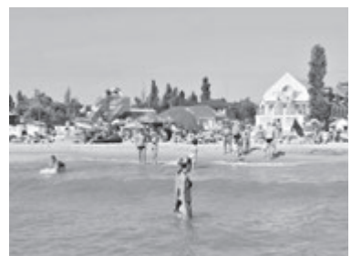
ЗАТОКА (Одеська область)

Тут ви не знайдете нічого зайвого. Є тепле море, недорогі кафе, недорогі готелі і будиночки. Транспортне та залізничне сполучення з іншими містами. Вулиці та пляжі Кирилівки обладнані камерами відеоспостереження. По-перше, це безпека, адже на морі часто трапляються крадіжки, які вмиль можуть зіпсувати весь відпочинок. Завдяки веб-камерам кількість подібних злочинів суттєво скорочується. По-друге, перед тим, як їхати на море, ви зможете промоніторити в режимі реального часу, наскільки вам буде там комфортно проводити свою відпустку. Бюджетний варіант житла: від 100 гривень/доба. Відстань від Вінниці: 761 кілометр.