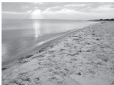
КІНБУРНЬКИЙ ПІВОСТРІВ (Миколаївська область)

Додамо, що деякі заклади, що описані в добірці, наразі закриті і почнуть працювати лише після наступних етапів послаблення карантину.