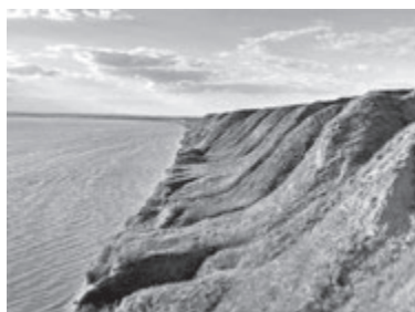
СТАНІСЛАВ (Херсонська область)

Крім, власне, самого півострова, туристів сюди манить Кінбурнська коса, яку часто називають українськими Мальдівами. Таку назву вона отримала завдяки білосніжному пісочку на своїх пляжах і блакитному кольору води. До речі, омивається це місце також з одного боку морськими водами, а з іншого – прісними, на самому ж півострові є чимало солоних озер з рожевою водою. Крім ніження на сонечку та купання у теплому морі, тут можна влаштувати фотополування на птахів. У цих місцинах, за різними даними, їх водиться понад дві сотні різновидів. Серед них лебеді, журавлі і навіть пелікани. Нерідко до берегів підпливають дельфіни, Бюджетний варіант житла: від 150 грн/доба. Відстань від Вінниці: 630 кілометрів.