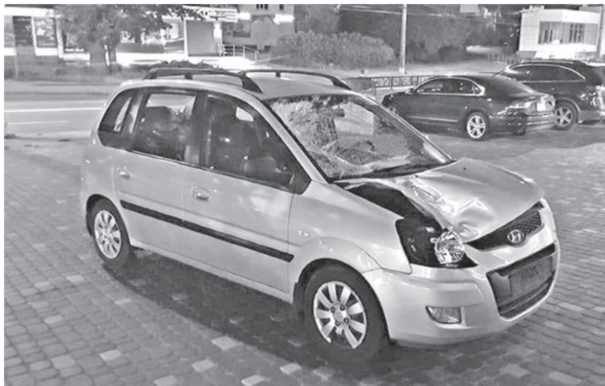
Автівка після ДТП. Її знайшли покинутою і без номерних знаків в одному з вінницьких дворів

Резонансне ■ У вихідні неподалік центру сталося резонансне ДТП. Повертаючись зі святкування Дня медичного працівника, водійка напідпитку на пішохідному переході збила хлопця і, не зупиняючись, поїхала геть. Зараз хлопець знаходиться в лікарні, а медику загрожує умовне покарання