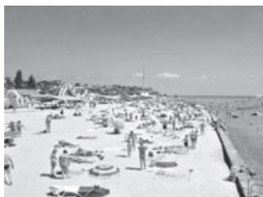
ГЕНІЧЕСЬК (Херсонська область)

Мова про ландшафтний заказник «Станіславський», площа якого майже 700 гектарів. Це те місце, де степ зустрічається з морем. Сюди потрібно їхати, якщо хочеться помилуватися неймовірними краєвидами. На узбережжі є чимало високих круч, які часто називають Херсонськими горами. Саме з них можна якнайкраще роздивитися Дніпровсько-Бузький лиман. До речі, саме на цих горах гурт «Скрябін» знімав кліп на пісню «Місця щасливих людей». Заказник знаходиться лише за 40 кілометрів від Херсону, тому дістатися сюди буде не складно. Якщо плануєте заночувати, то краще скористатися послугами кемпінгу. На місці можна орендувати намети, спальники, скористатися душем та всіма іншими зручностями. Відстань від Вінниці: 507 кілометрів.