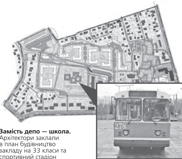
Замість депо — школа.

Зелені зони, сквери та прогулянкові алеї, за намірами архітекторів, мають займати майже шість з 38 гектарів території, на якій планується забудова. А ще запроектували дитячі та спортивні майданчики, будівлі