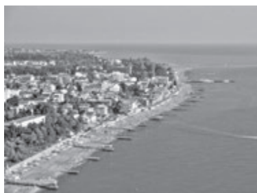
КОБЛЕВО (Миколаївська область)

Цей острів є найбільшим в Україні та Чорному морі. На ньому можна зустріти як червонокнижні рослини, так і диких тварин. Однією з небагатьох пам'яток острова є маяк, який, за легендою, був збудований відомим французьким інженером Гюставом Ейфелем (або ж одним з його учнів). Також на острові кілька сотень солоних озер різних розмірів. Дістатися до острова можна зі Скадовська на теплоходах, або винайнявши приватний човен. Варіантів з житлом тут не так багато: або намет, або невеликі будиночки. Біля останніх можна поповнити запаси прісної води, скуштувати щойно вилонених крабів, рапанів. Відстань від Вінниці: 600 кілометрів.