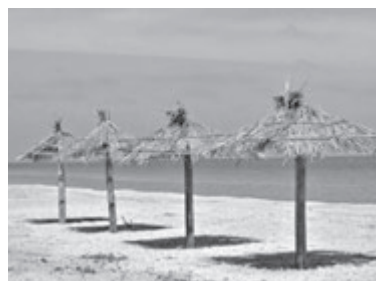
КИРИЛІВКА (Запорізька область)

Очаків має пряме автобусне сполучення до великих міст, у тому числі Вінниці. Тут є всі умови як для спокійного проведення часу та насолодою морем; так і компаніями друзів, які люблять розважатися: у місті та неподалік нього можна займатися віндсерфінгом, кайтсерфінгом, вейкбордингом та покататися на водних лижах. За вісім кілометрів від Очакова знаходиться один з небагатьох островів Чорного моря – Березань, – туди можна легко дістатися. А за 30 кілометрів розташований історико-археологічний заповідник «Ольвія». Бюджетний варіант житла: від 150 грн/доба. Відстань від Вінниці: 488 кілометрів.