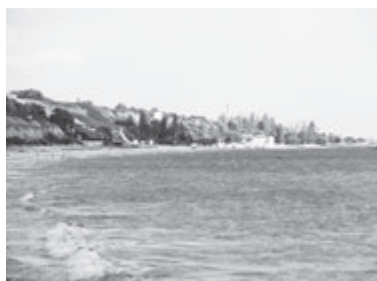
ОЧАКІВ (Миколаївська область)

На шести кілометрах узбережжя безліч пансіонатів та готелів. Вдень можна просто ніжитися на сонечку, або вибрати більш активний відпочинок. Наприклад, відвідати аквапарк, сходити на виставу до дельфінарію чи то пак покататися на водних скутерах. Є в селі і родео парк з атракціонами скажених биків, басейни і майданчик для міні-гольфу. Багато туристів полюбують ходити на дегустації вина до місцевого винзаводу. Вночі життя продовжує вирувати. Свої двері відкривають нічні клуби з дискотеками і ресторани біля моря, де грає жива музика. Бюджетний варіант житла: від 200 гривень/доба. Відстань від Вінниці: 476 кілометрів.