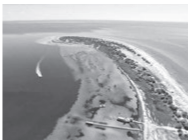
ДЖАРИЛГАЧ (Херсонська область)

Не варто лякатися назви, адже вона ніяк не впливає на якість відпочинку. Якщо оминати увагою неймовірно довжелезні пляжі і не починати водити гастро-екскурсії, можна зосередитись на одних лише розвагах, якими це місце і славиться. Уявіть собі, з населенням у менш ніж дві тисячі людей, село має три аквапарки, колесо огляду і навіть плавучий острів з атракціонами. Острів має назву «Лонг Айленд» і розташований він у відкритому морі. Лише задля того, щоб на ньому побувати, варто вирушати на відпочинок до Залізного Порту. На острові чимало надувних гірок, батутів, басейнів, є водний банан, вишка для стрибків у воду і навіть дайвінг. Бюджетний варіант житла: від 100 гривень/доба. Відстань від Вінниці: 592 кілометри.