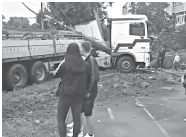
Внаслідок цієї аварії було небезпечно пересуватися тротуаром. Адаже з порваних електродротів іскрило напруга