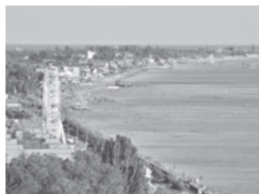
БЕРДЯНСЬК (Запорізька область)

Скоріше за все, в цьому місті ви не знайдете шикарних розваг, проте маєте всі шанси відпочити, як то кажуть, і тілом, і душею. Головні цікавинки, які і в будь-якому прибережному місці, починаються на пляжі. Це водні банани, гірки і засмагли люди, які пропонують за не надто велику суму скуштувати пахлаву, кукурудзу та рибу з холодними напоями. Чимало розваг зосереджені в парку імені Шевченка в центрі міста. Туристам, які мають час та бажання, пропонують побувати в, напевно найцікавішому, заповіднику України «Асканія Нова». Саме там у дикій природі можна побачити коней, зебр, буйволів, антилоп та інших тварин і птахів. Бюджетний варіант житла: від 100 гривень/доба. Відстань від Вінниці: 705 кілометрів.