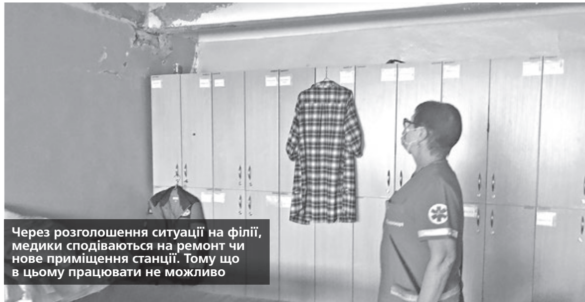
Через розголошення ситуації на філії, медики сподіваються на ремонт чи нове приміщення станції. Тому що в цьому працювати не можливо