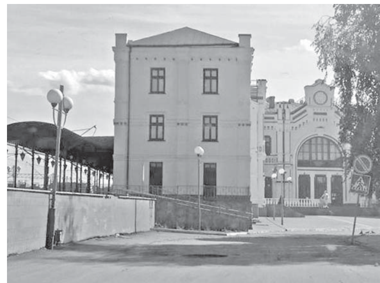
Козятинський залізничний вокзал в очікуванні пасажирів

вагоні пасажирського поїзда встановлено санітаїзер, яким можуть користуватися пасажирі. Також розміщені рекомендаційні наліпки щодо правил особистої гігієни в умовах карантину. Для посадок в поїзд пасажирі обов'язково повинні одягати захисну маску. З огляду на заходи безпеки, пасажирів рекомендовано якнайменше пересуватися вагонами.