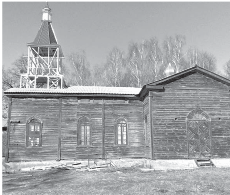
Дерев'яна церква у Збаражі. Фото 2005 року

У селі діяла Свято-Успенська церква. Лаврентій Похилевич у своїй праці «Сказання