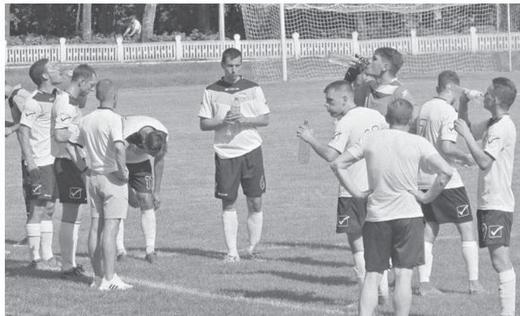
Сонце під час проведення матчу палило нещадно. Тому для футболістів робили перерву, аби вони могли освіжитися

Варто нагадати суддям, що футбол — контактний вид спор-