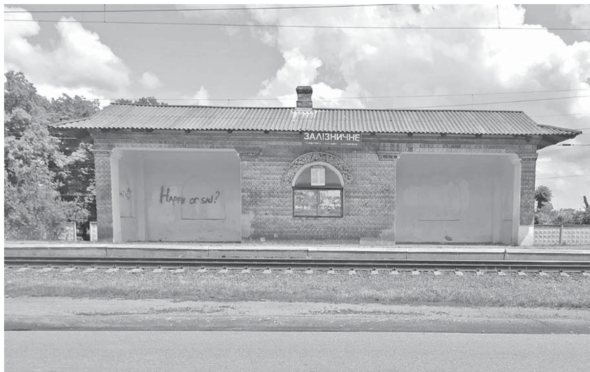
Залізничне поділене на три частини. Зараз вони підпорядковуються трьом різним громадам