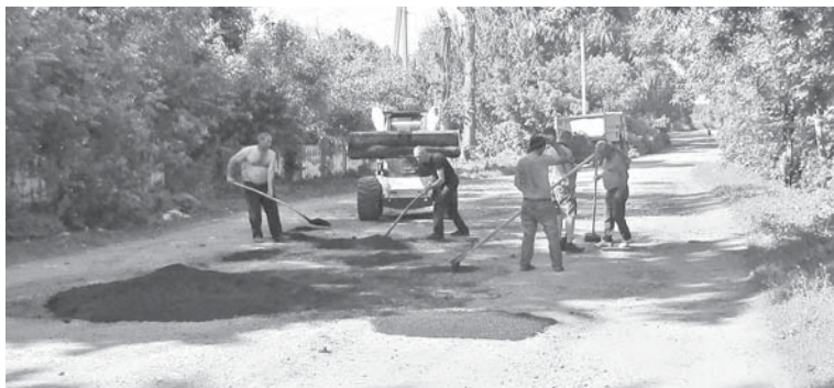
Дорога на півсезону. Роблять так званий ямковий ремонт

На власні очі ■ Ми вийшли на вулиці зі сподіванням знайти позитивні новини. Але на кожному кроці на очі потрапляли якісь проблеми. Сподіваємось, наступного тижня нам пощастить більше