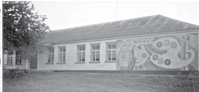
Школа у Журбинцях. Створена на базі двокласного училища, яке до 1904 року було церковно-приходським