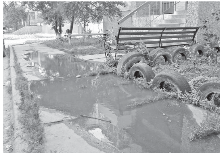
Таке озерце нечистот в дворі Катуківа, 27 розливається часто

Коли за півгодини з каналізації розлилась ціла річка, нечистоти перестали надходити. Місцеві мешканці пояснили, що коли каналізація забита, зливом води більшість сусідів стараються не користуватися.