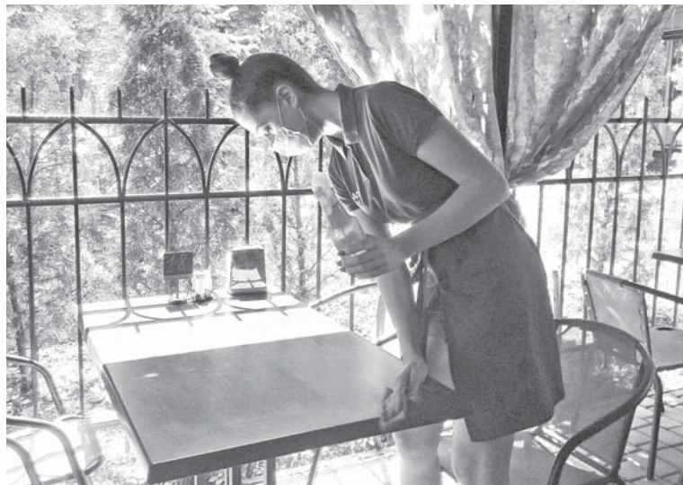
Піцерія «ArmAto». Столики протирають антисептичними засобами

За словами спеціалістів управління Держпродспоживслужби, у суботу вони здійснювали перевірку м'ясних та молочних павільйонів на «великому базарі». Карантинних норм там дотримуються та роз'яснювальну роботу все ж провели.