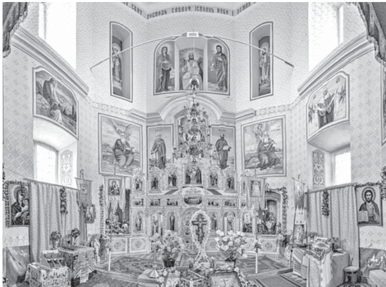
Колись на місці сучасного іконостасу стояв різьблений з дерева. Висотою він був аж до купола

Друге життя для храму почалося у 1979 році. Тоді приміщення церкви внесли до списку пам'яток національного значення. Згодом святиню почали реставрувати. До оновленого храму передали одне з двох старовинних Євангелій. Колись воно належало церкві. На початку 90-их його випадково знайшли у будинку, де колись жив сільський дяк. П'ятнадцять років тому старовинне Євангеліє вкрали.