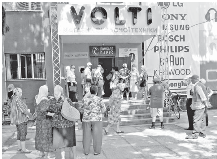
До людей в черзі продавці магазину VOLTI декілька разів викликали поліцію за порушення умов карантину