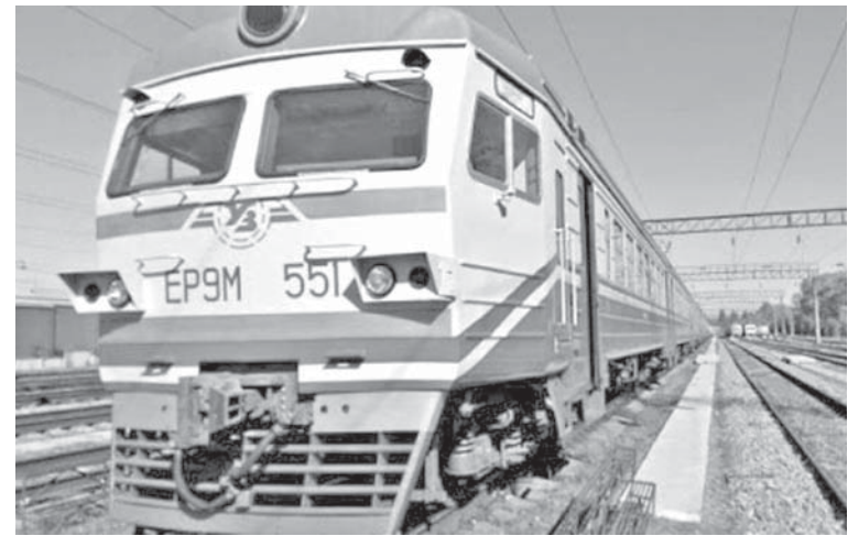
Курсування приміських поїздів через Козятин відновили в напрямках Києва, Фастова та Жмеринки

Починаючи з п'ятниці, 26 червня, відновлюється приміське сполучення залізницею між містами Козятин та Бердичів. Так, з 26 червня продовжується маршрут дизель-поїзда N6462/6461 з Коростеня до Козятина через Бердичів і назад. Дизель-поїзд N6461/6462 буде курсувати у 3, 5 та 7 дні тижня. З Коростеня дизель прибуває до Козятина о 9.20 год., відправляється з Козятина о 15.28 год., Бердичів 16.05/16.07, Житомир 17.22/17.34, прибуття в Коростень о 19.44.