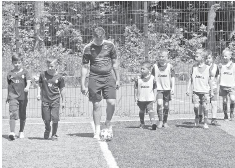
Арбітр матчу виводить команди на поле

Захоплюючим виявився другий поєдинок між «Левами-2» та другою командою Бердичева. У цьому матчі фани клубів, а це переважно батьки спортсменів, побачили забиті м'ячів на всі смаки. Були голи, забиті в кут воріт і майже в дев'ятку. Бачили фани гол з пасу партнера, та