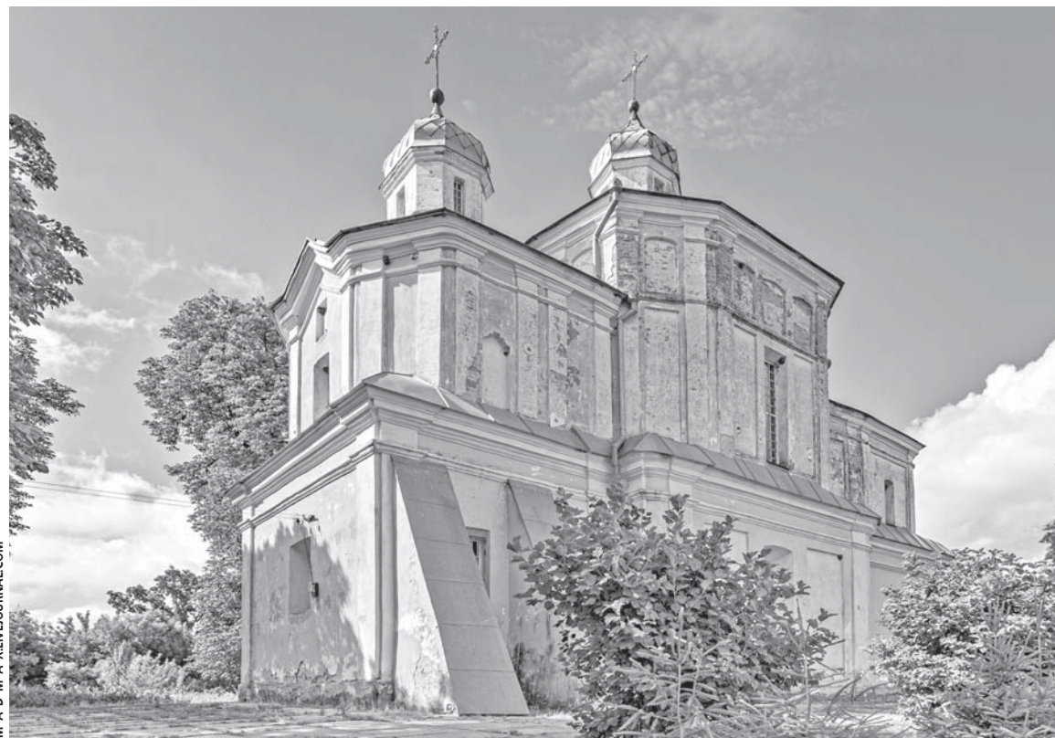
Кам'яна церква у Поличинцях є пам'яткою національного значення. Коли саме звели храм — точно не відомо