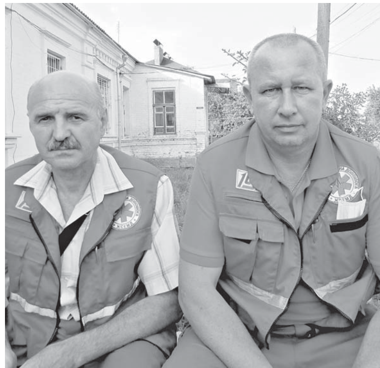
За 20 років роботи бригада екстреної медицини має близько 36 тисяч викликів і сотні врятованих життів