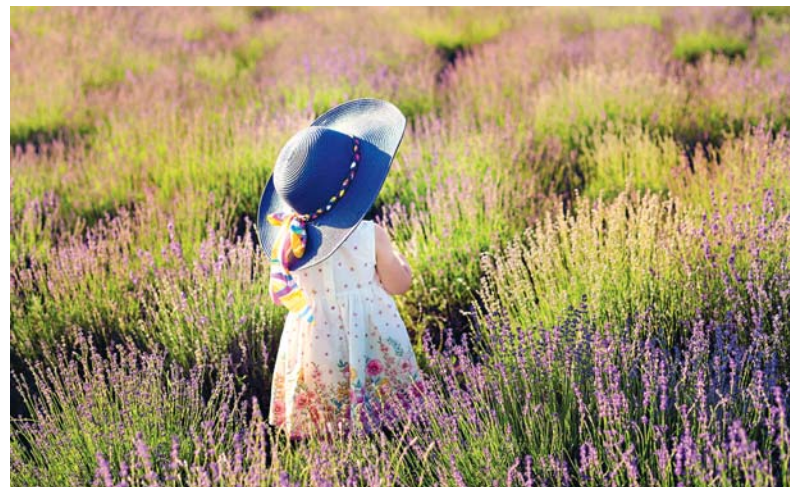
Сотні відвідувачів, серед них — і діти, приїхали на плантацію, аби насолодитись неймовірною красою квітів