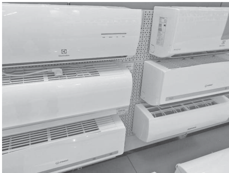
Кондиціонер мають встановлювати спеціалісти, а ще він потребує періодичного обслуговування, якщо ви самі не готові вчитися це робити

Однак якщо ви вирішили придбати кондиціонер, будьте готові заплатити і за його встановлення. Якщо самі ви цього зробити не можете — тернопільські майстри зроблять це приблизно за 1000 гривень. Саме такі ціни на сайтах оголошень. Також можна дізнатися у магазині, чи не пропонують вони встановлення кондиціонера спеціалістами. Деякі крамниці пропонують цю послугу дешевше або навіть безкоштовно, однак це переважно стосується дорогих моделей спліт-систем.