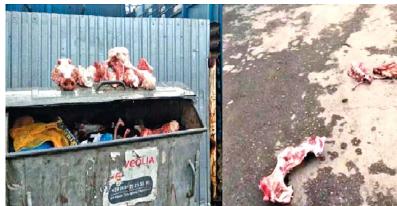
М'ясні відходи часто валяються на землі біля смітників

У м'ясному павільйоні один з продавців додає, що відходів значно поменшало — люди забирають навіть кістки.