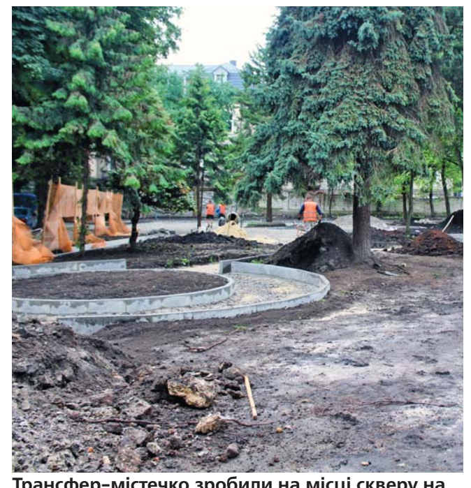
Трансфер-містечко зробили на місці скверу на бульварі Шевченка. Дерев не зрізали