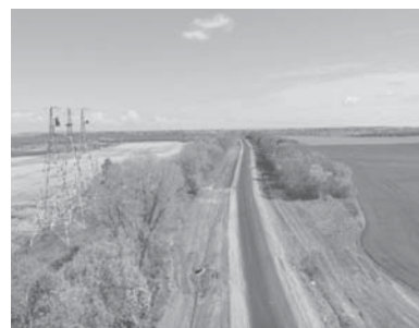
Який вигляд мали дороги, які були в плані на ремонт у 2020 р. — до і після