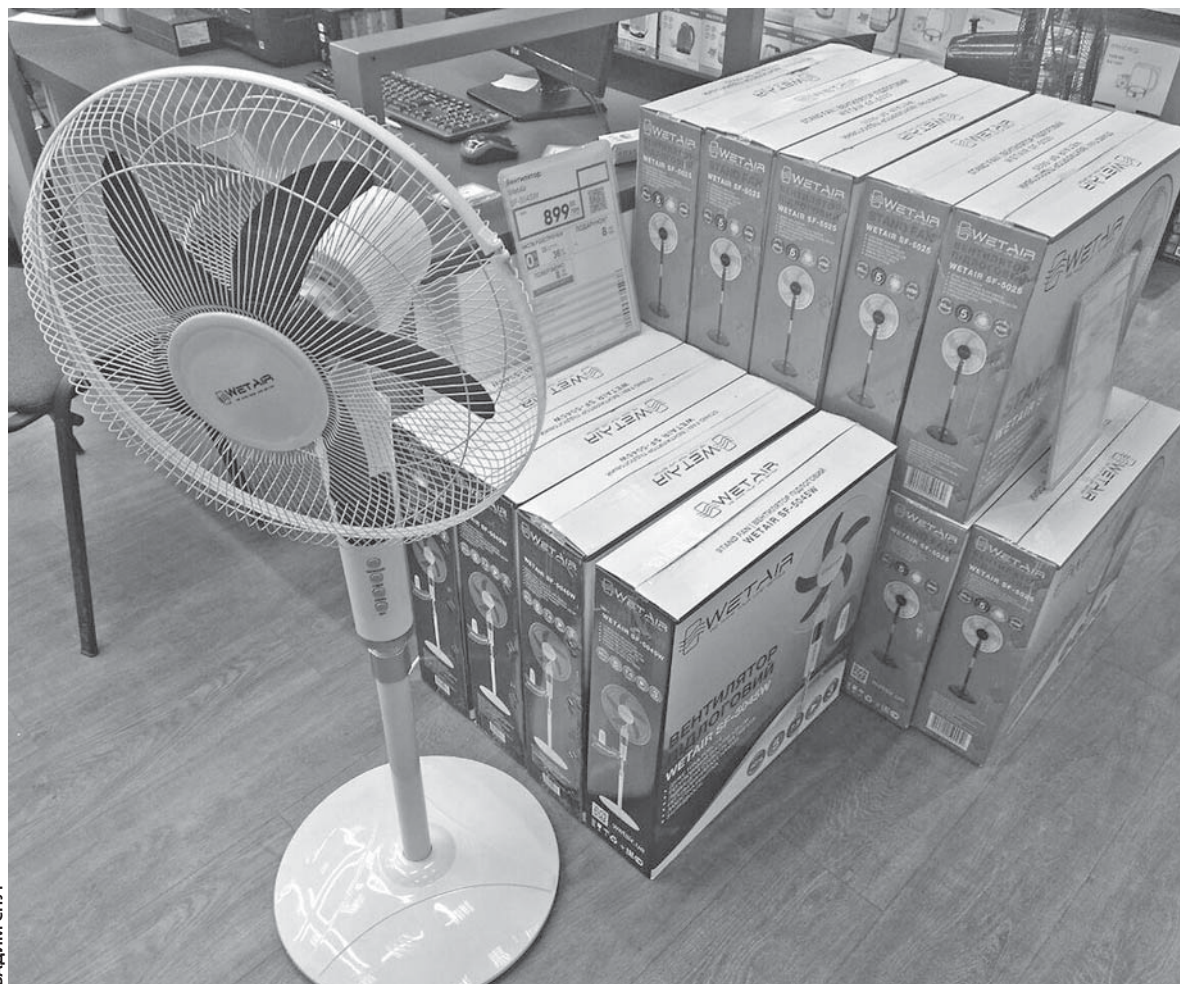
Дорогі моделі вентиляторів мають керування за допомогою спеціального пульта

тиметрів обійдуться в 500–600 гривень. Усе залежить від розміру вікна та виробника. Жалюзі та ролети від українських виробників зазвичай дешевші.