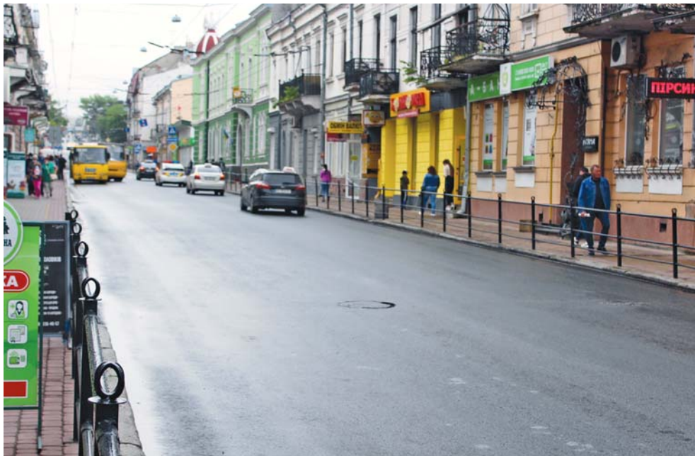
Новий асфальт на Руській клали вночі, щоб не створювати заторів