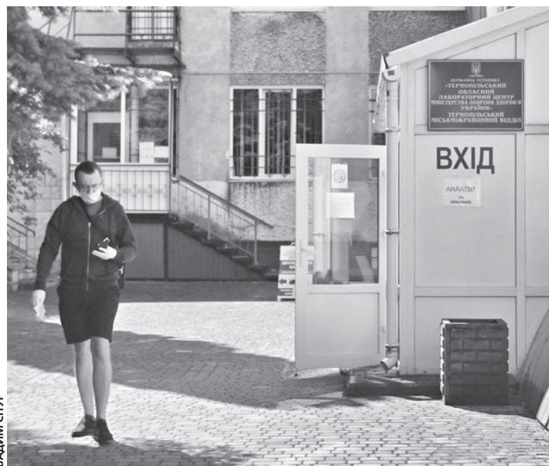
Здавати кров потрібно на голодний шлунок. Напередодні не можна вживати алкоголь