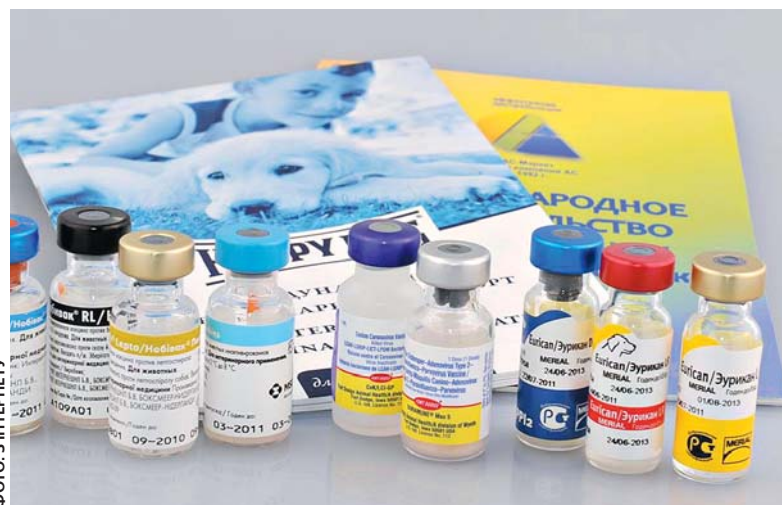
У ветаптеках зазвичай продають полівалентні вакцини одразу від кількох хвороб, у тому числі і сказу

— Якщо, до прикладу, ви маєте хом'яка, який весь час живе у вас вдома в клітці, то вакцинувати його немає потреби, — пояснює лікар. — Вакцинація для кімнатних тварин може знадобитися тоді, коли ви буде перевозити їх у громадському транспорті, наприклад — у літаку чи поїзді. Тоді для перевезення має бути паспорт тварини, де зазначено, що вона вакцинована.