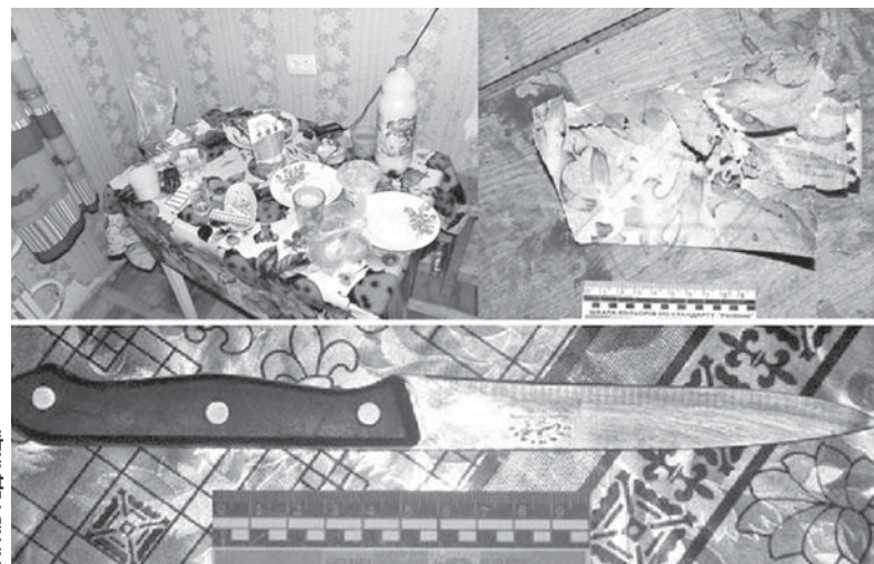
У кімнатах і на стінах — все було у крові...

«Суд критично оцінює показання обвинуваченої в частині неусвідомлення своїх дій через стан алкогольного сп'яніння, — йдеться у вирокі. — Адже вони спростовуються сукупністю всіх інших вище вказаних належних і допустимих доказів. Крім цього, згідно з висновком судово-психіатричного експерта, під час скоєння злочину обвинувачена страждала на розлади психіки і поведінки внаслідок вживання алкоголю, що