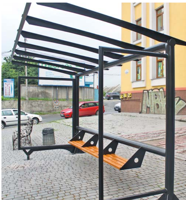
До кінця року мають облаштувати 9 зупинок

У місті також облаштували спуски на переходах. Зокрема, на Руській та вул. Богдана Хмельницького. Однак плавного спуску з тротуару до асфальту вдалось досягти не всюди.