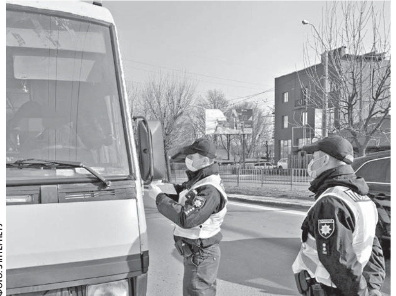
Представники спільних робочих груп попереджають підприємців та перевізників міста про відповідальність за порушення карантину

Працівники Держпродспоживслужби також продовжують перевірки у складі спільних груп. До закладів громадського харчування, де вже виявляли порушен-