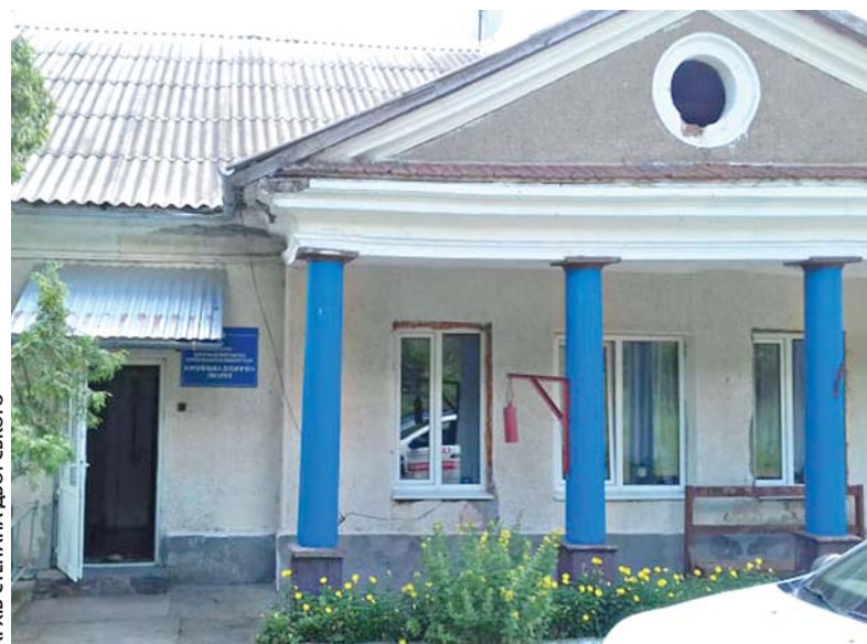
АРХІВ СТЕПАНА ДВОРСЬКОГО

— Вони мають фінансувати нас на 40% і готові платити за світло та комунальні послуги. А хто тоді