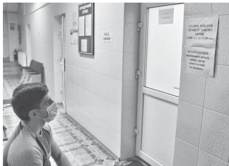
Забір крові проводять у будні з 8.00 до 12.00

— Важливо те, що у людини є так звана імунологічна пам'ять, — пояснює Володимир Паничев. — Завдяки цій властивості ми можемо швидко відновлювати потрібні антитіла при повторній зустрічі з патогеном. Суть не в тому, щоб організм постійно виробляв антитіла, а щоб він знав, як це робити при потребі. Адже ми не можемо витрачати ресурси без потреби.