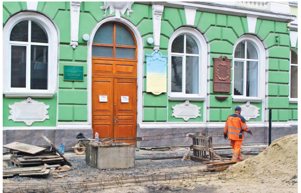
У школах та садочках на карантині почали робити ремонти