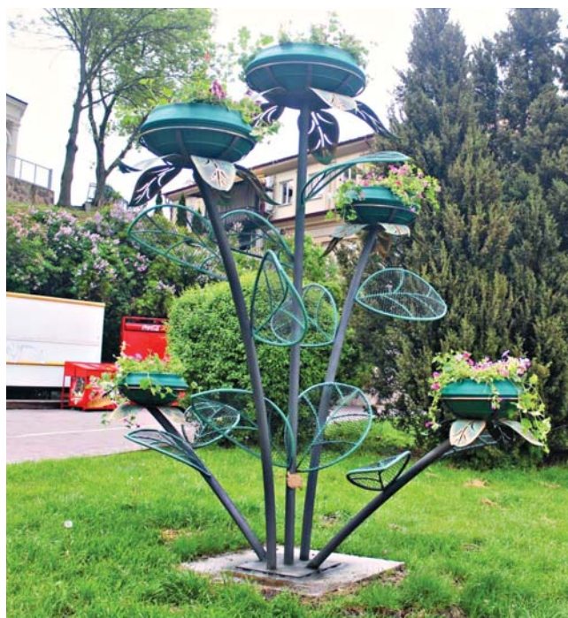
Ковані дерева встановили в парках міста