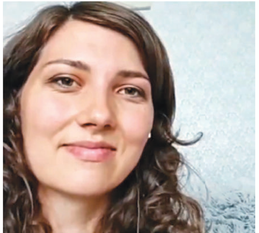
Альона під час прямого ефіру: «Все відбувалося дуже стрімко. Я побачила стіл, на якому стояли сумки, лягаю на нього і кажу чоловікові: «Приймай пологи»