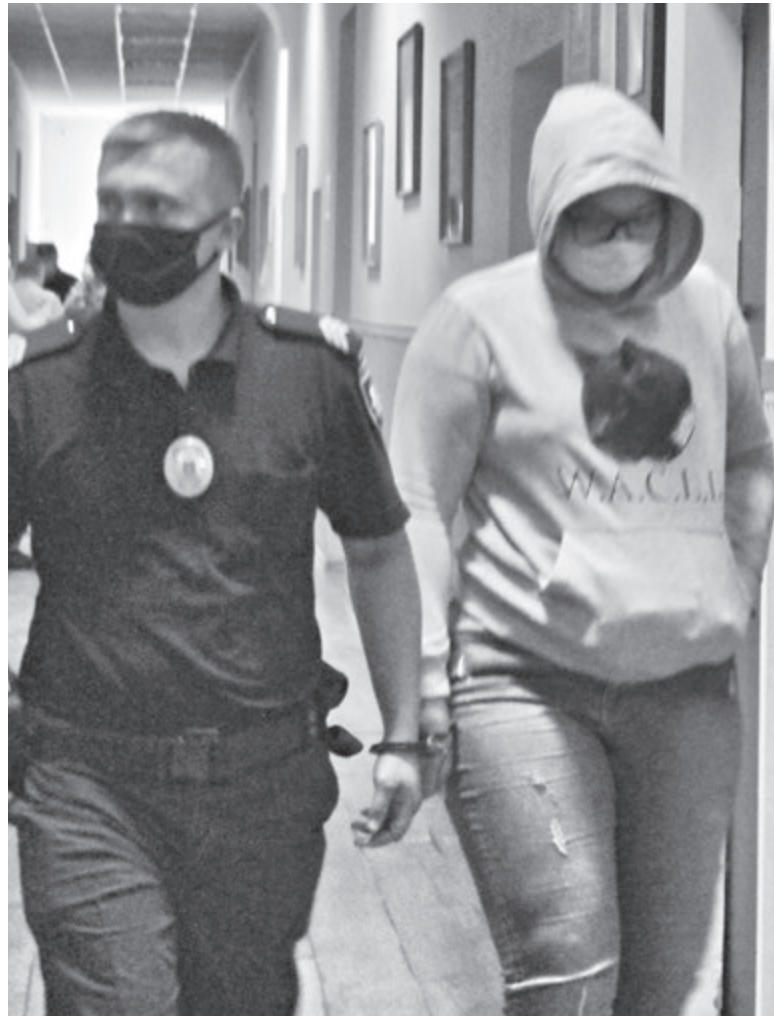
До зали суду підозрювану вінничанку привезли зі слідчого ізолятора, вона, як і її чоловік, були одягнені в однакові куртки з капюшонами

Одного разу їй надійшла пропозиція від іноземців. Вони висловили пропозицію прокламувати одяг. Моделями мали стати її вихованці. Одяг