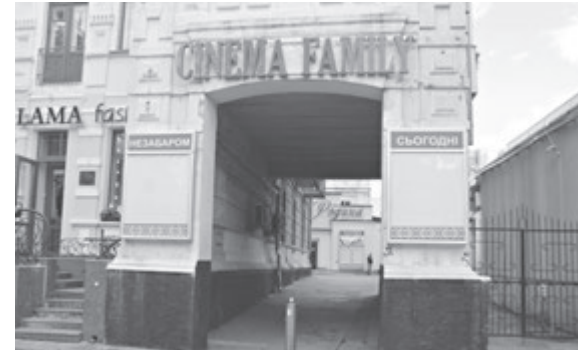
Три з чотирьох вінницьких кінотеатрів працюють з 2 липня. Зачиненим залишається тільки «Родина»

дають. Потрібно мати свої або купувати у кіно за 20 гривень, бо це є індивідуальною річчю.