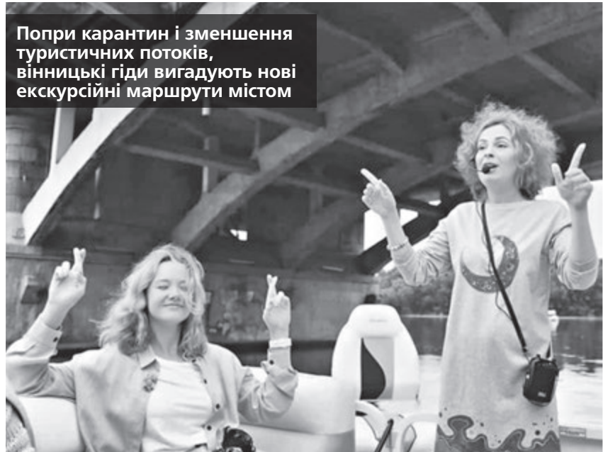
Попри карантин і зменшення туристичних потоків, вінницькі гідди вигадують нові екскурсійні маршрути містом