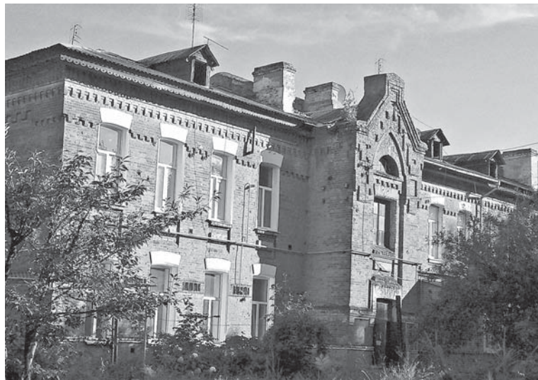
Уманський будинок на Васьковського. Один з найстаріших у місті, який ніколи не був вокзалом

Господарський магазин працював до кінця 90-их, кулінарія пішла в небуття разом з рестораном «Козятин». Подарунковий теж закрився. Натомість наприкінці 90-их років там облаштували магазин «Фортуна», який функціонує і сьогодні.