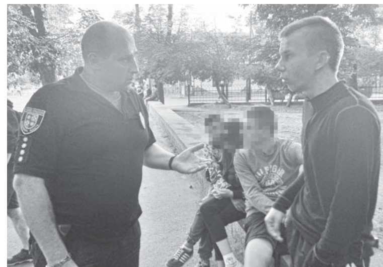
Вранці цей 18-річний хлопець був у відділенні поліції. Його затримали за хуліганство та розпиття алкоголю в парку

— Ми його спіймаємо і вилучимо мопеда. Це питання часу, — каже Євген Трайдакало. — Особу і місце проживання мопедиста вже встановили та в нього будуть «гості» у поліцейській формі з усіма правовими наслідками. Також додаю, що в нас по місту їздять два квадроцикли. Там теж треба мати права. Ми будемо звертати на це увагу, поки на них немає скарг.