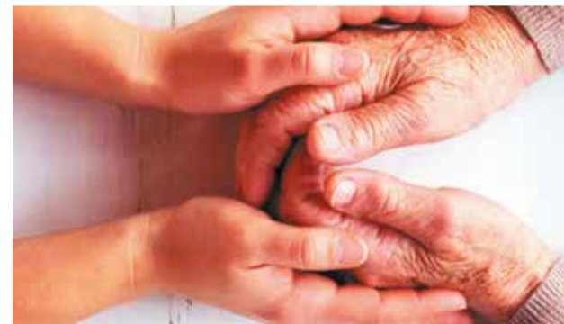
Обов'язок повнолітніх дітей утримувати батьків та його виконання