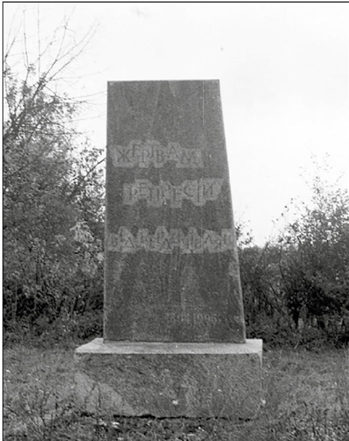
→ Пам'ятний знак жертвам політичних репресій у м. Бердичеві на єврейському кладовищі.

З вересня 1934 року «Ремі» знову перебував за кордоном – на нелегальній роботі в якості резидента. У зв'язку з прорахунками керівництва, легалізація у фашистській країні не відбулась. При зустрічі зі зв'язковим центром на явочній квартирі у Копенгагені, яка вже була провалена, він був заарештований. Але завдяки власній витримці, вмій грі через деякий час йому вдалося домогтися визволення. Повернення до Москви було пов'язано зі