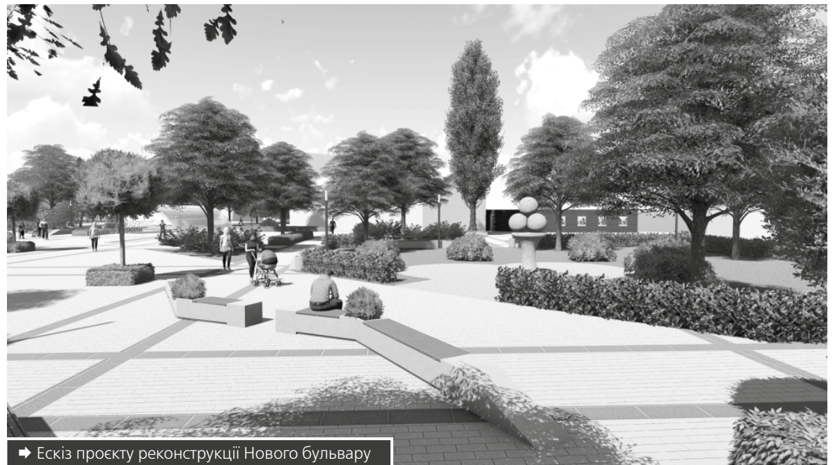
→ Ескіз проекту реконструкції Нового бульвару

– На сьогодні ми ще не розуміємо остаточної вартості Нового бульвару, якою вона буде, бо проект тільки дороблюється до кінця. Він ще має пройти експертизу, і лише після цього ми побачимо із вами кінцеву суму того проекту. Я впевнений, що 18 мільйонів