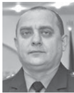
СЕРГІЙ КРЕТА, НАЧАЛЬНИК ВІДДІЛУ КОМУНІКАЦІЇ ГОЛОВНОГО УПРАВЛІННЯ НАЦПОЛІЦІ В ОБЛАСТІ:

— Від початку 2020 року в Тернополі порушили 27 кримінальних проваджень за статтю «шахрайство». Три з них вже розглянули в суді і дві справи перебувають на розгляді. Одна зі схем ша-