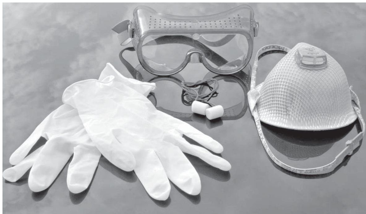
Засоби захисту лікарні купували у різних постачальників. Ціни можуть відрізнятися у кілька разів

Ця процедура була направлена на те, щоб лікувальні заклади могли якомога швидше забезпечити медиків засобами захисту, ліками та обладнанням. З поста-