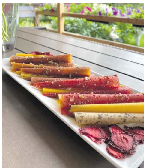
Лише сушіння пастили триває понад 9 годин