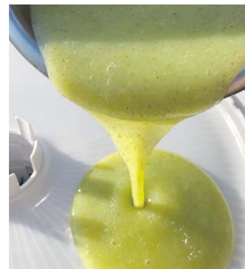
Смаків існує безліч, але уся пастила готується на яблучному чи банановому пюре