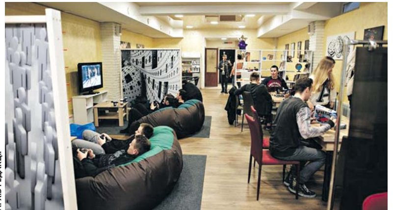
Ще один незвичний проект — створення локації молодіжного дозвілля. Саме там молодь зможе проводити свій вільний час