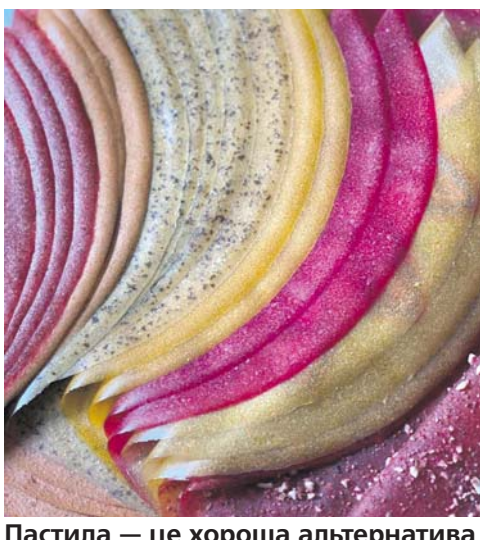
Пастила — це хороша альтернатива перекусу. Її зручно довго зберігати і мати біля себе. Вона не займає багато місця, не швидко псується