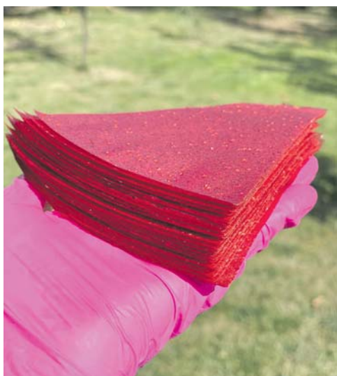
Пастилу жінка розпочала готувати у декретній відпустці. Мама каже, що діти у захваті