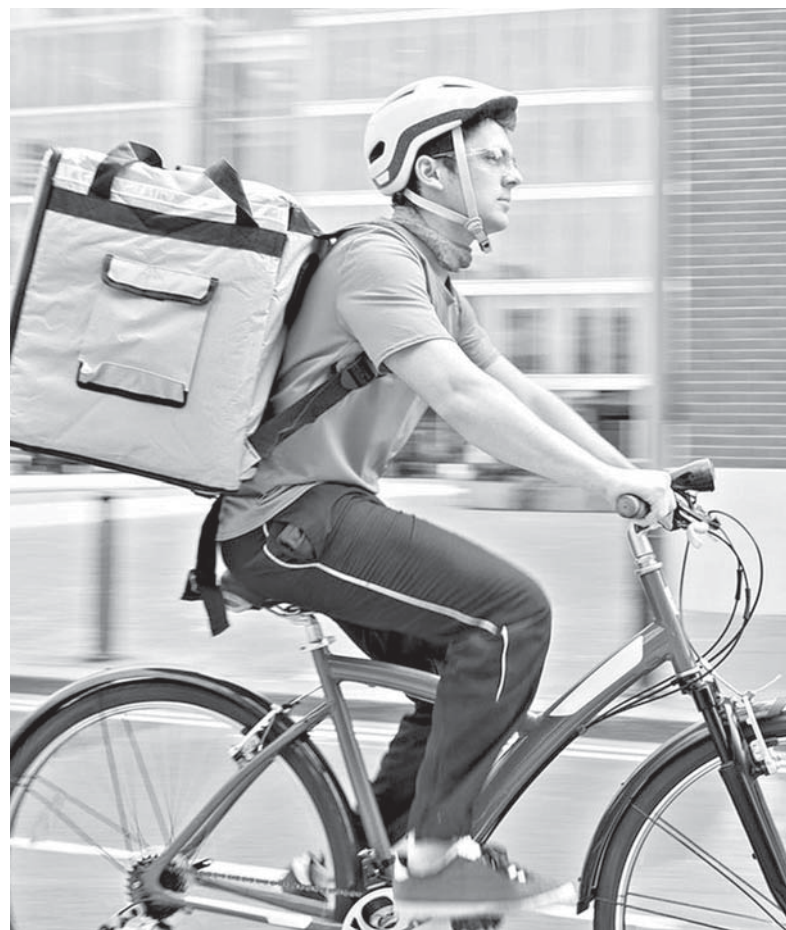
Аби отримати потрібні ліки чи продукти, можна скористатися мобільними додатками і замовити послугу кур'єра

З одягом та взуттям ситуація складніша. У місті ми не знайшли магазинів, які б пропонували доставку одягу. Через додатки та кур'єрів зробити замовлення також не вдається. Єдиний варіант — зробити замовлення в інтернет-магазині і обрати доставку через кур'єра пошти