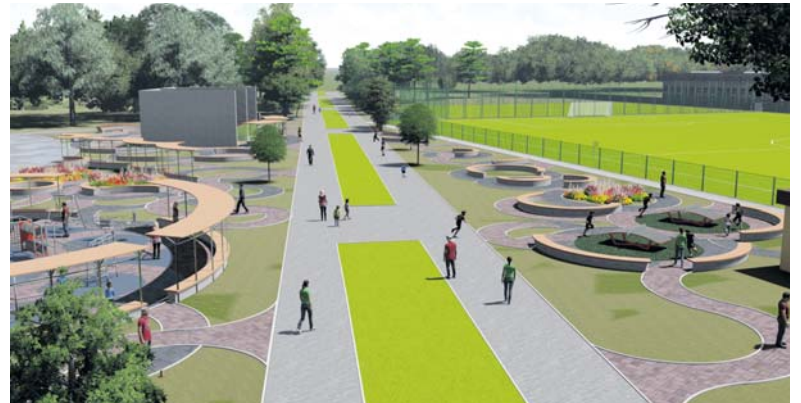
Серед масштабних та незвичних проектів — облаштування відпочинкової зони у парку «Топільче»

Серед реалізованих проектів: комплексне трансфер-містечко, силовий майданчик, встановлення вуличних тренажерів, шкільний дворик імені святої Ядвіги.