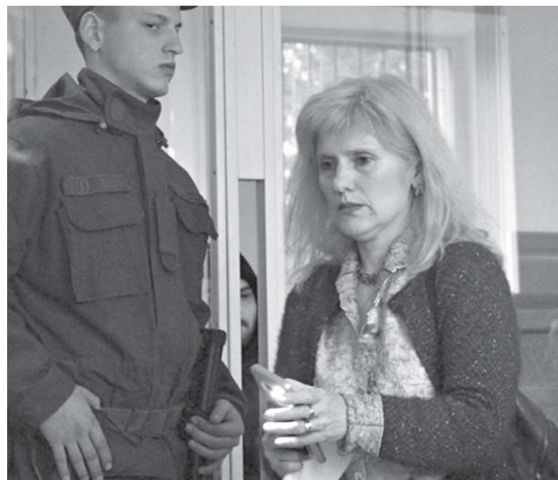
Мама загиблої вимагає справедливого суду для чоловіка.