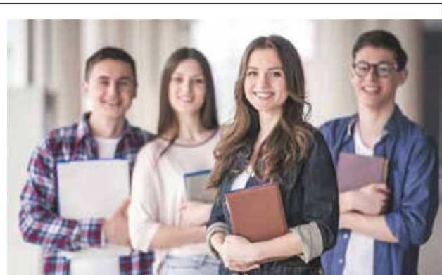
Вступна кампанія 2021: що зміниться для вступників ВНЗ с.4

Близько 70% у витратах на комуналку – вартість опалення. Старт