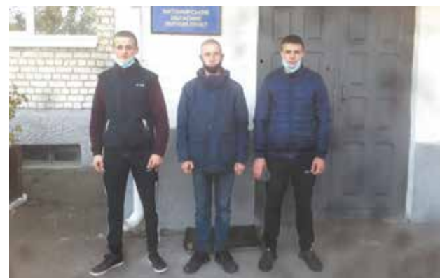
Міфи та реалії про строкову службу в Україні с.3

ЧАСТИНА ТИРАЖУ РОЗПОВСЮДЖУЄТЬСЯ БЕЗКОШТОВНО