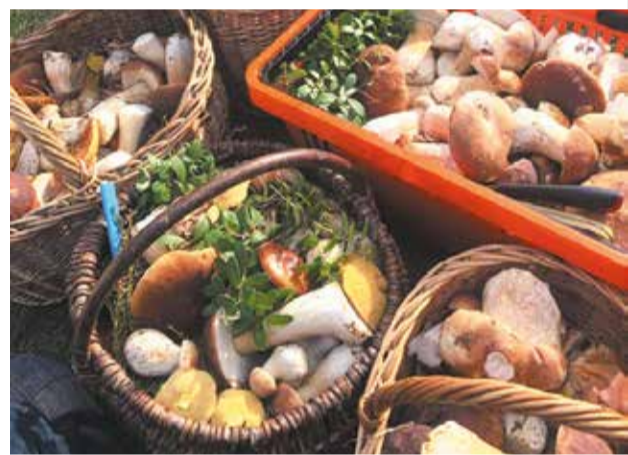
Ох грибочки, ви мої грибочки с.2

опалювального сезону вже відбувся, а у листопаді українці отримають перші платіжки за тепло. Поки тільки за половину місяця, однак уже у листопаді платити за комунальні послуги доведеться значно більше.