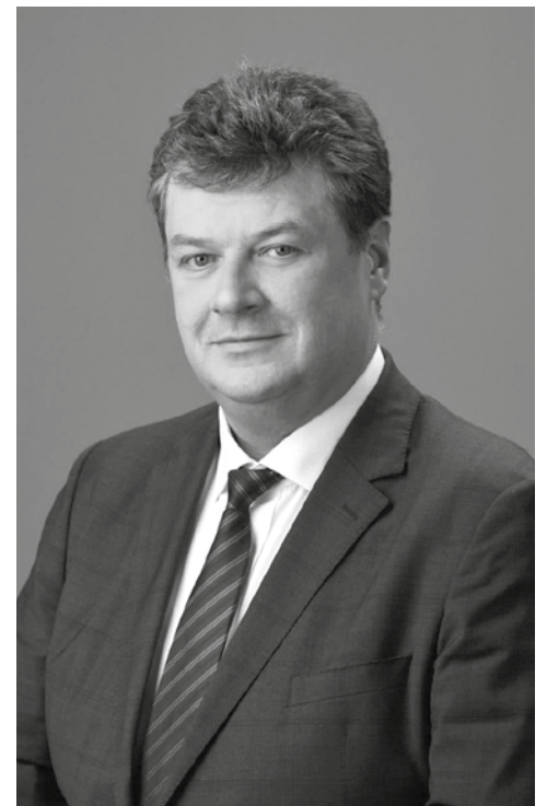
Голова Житомирської облдержадміністрації Віталій Бунечко