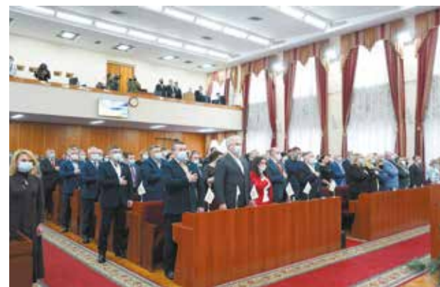
Основні доходи і витрати області у 2021 році пораховані