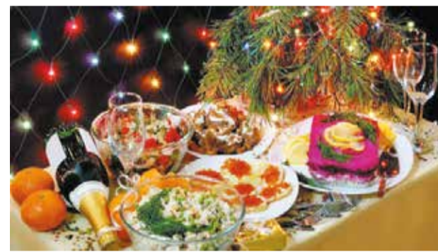
Зустрічаємо рік Бика: що має бути на новорічному столі та у скільки обійдеться святкове меню