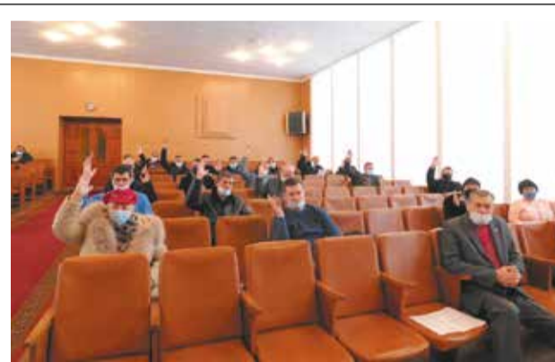
Затверджено бюджет Романівської селищної ради на 2021 рік