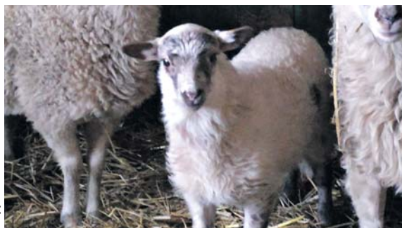
Деякі з тварин народилися в «Топільче»