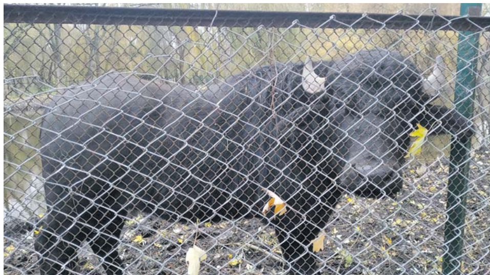
Буйволи, незважаючи на свій розмір, є найбільш дружніми з усіх мешканців зоокутка. Вони охоче підходять до огорожі, коли є люди