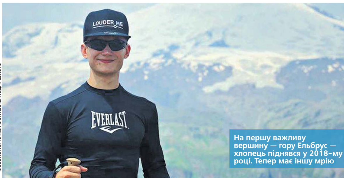
На першу важливу вершину — гору Ельбрус — хлопець піднявся у 2018-му році. Тепер має іншу мрію

— Взагалі, я хочу підкорити сім вершин світу до 30 років. Ось вже почав. Перед тим, як їхати на Ельбрус, я пробіг півмарафон у Львові, щоб підготуватись. Виходить так, що я люблю робити все, що я не люблю робити. Коли доводиться виходити за межі можливого. Це відчуття, коли ти вже досягаєш цілі — неймовірне. Наприклад, я боюсь висоти — і я вже тричі стрибав з парашутом. Ще три рази я стрибав з моста з роуп-джампінгом. Тобто я так переборював себе. Не люблю бігати. У мене колись були проблеми з колінами. Я танцював, отримав травму. Тому це мені дається важко.