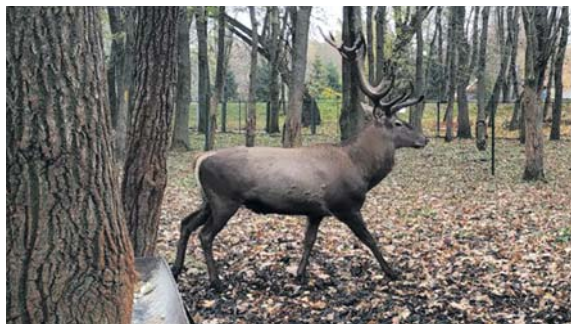
Олень, до речі, у парку поки один. Найближчим часом до нього в пару планують придбати самицю

— У них є свій раціон, своя норма харчів, яку вони споживають. Повірте, тваринам вистачає їжі і те, що люди іноді люблять їх підгодовувати, тільки шкодить. А ще небезпечніше, коли серед трави, а може й навмисно, їм дають целофанові кульки. Чотири роки тому в зоокутку померла вагітна плямиста лань. Ветеринар після розтину повідомив, що причиною смерті став целофановий кульок, який вона проковтнула.