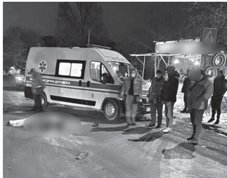
У страшних ДТП на вул. С. Будного загинуло багато людей. Тернополяни бояться за життя своїх близьких

Хто має опікуватись організацією дорожнього руху та куди звертатись, аби знаки і світлофори встановили або непотрібні демонтували, ми поцікавились