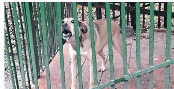
Вхід до зоокутка сторонніх охороняє пес Тайга. Тому до гостей він не надто привітний, а от до працівників — навпаки