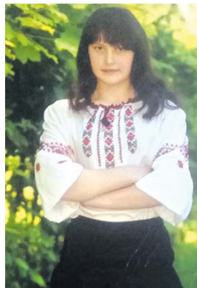
Студентка вже перенесла операцію та готується до ще однієї, а потім на неї чекає довгий курс реабілітації

Підтримайте юнака коштами: 4149499115367490, ПриватБанк.