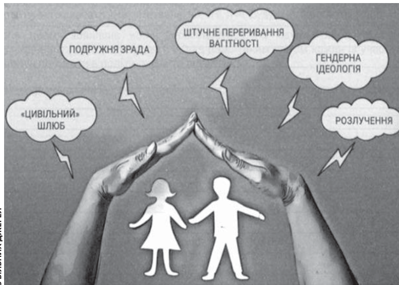
Ілюстрація з підручника «Основи сім'ї», 11 клас. Тема «Загрози для інституції сім'ї. Офіційний і «цивільний» шлюби»