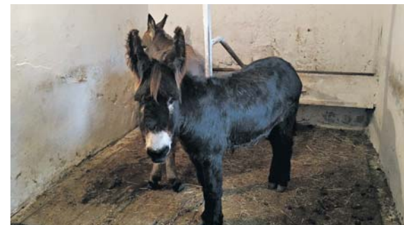
Свійських тварин вже тримають під накриттям