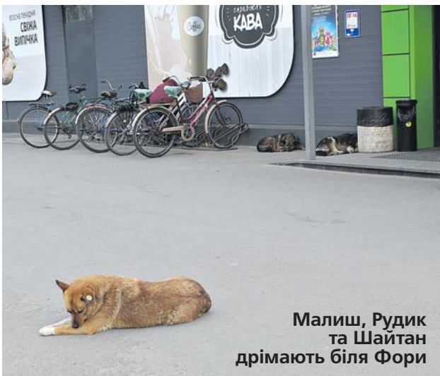
Малиш, Рудик та Шайтан дрімають біля Фори

Тільки так не повинно бути. Люди не мають ходити з острахом, що їх можуть вкусити.