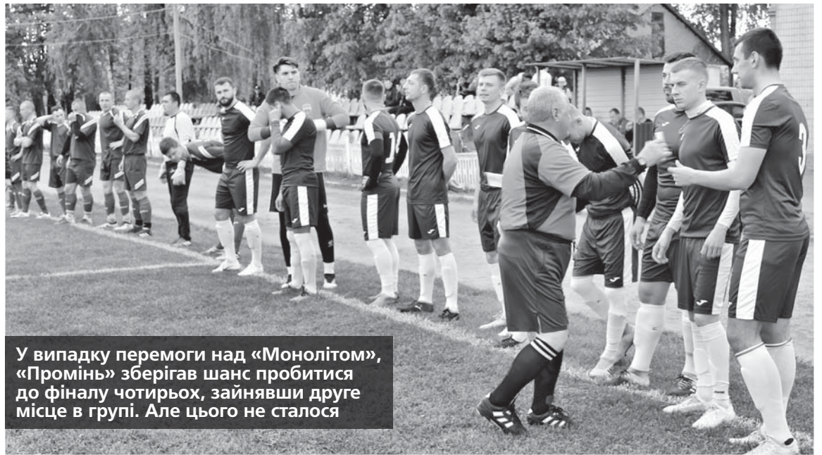
У випадку перемоги над «Монолітом», «Промінь» зберігав шанс пробитися до фіналу чотирьох, зайнявши друге місце в групі. Але цього не сталося

Гру з центру почали лідери чемпіонату. За декілька передач вони втратили м'яча. Атака гостей також завершилася втратою м'яча. За рівноваги володіння м'ячем обома командами пройшла третина першого тайму. Потім стала вимальовуватися незначна перевага господарів поля. Так, за рахунок вільних зон монолітовці пройшли лівим флангом і прострелили на партнера в ра-