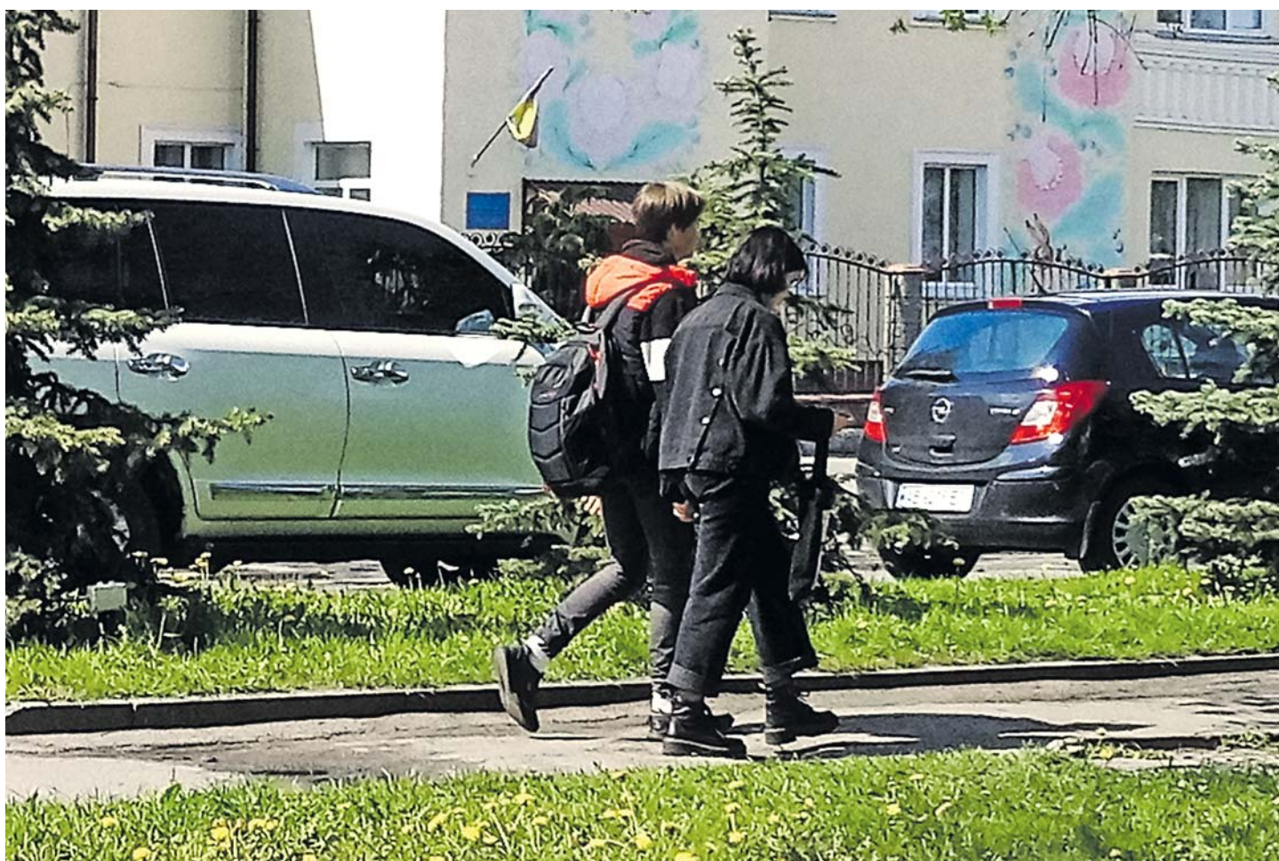
Одне з місць відпочинку – центральна площа. Тут часто можна побачити молодь. Влітку хлопці та дівчата збираються, щоб поспівати пісень під акустичну гітару

► Ми розділили наші варіанти відпочинку на три категорії (спорт, хобі та дозвілля) і розібралися, чи є вони у кожному мікрорайоні