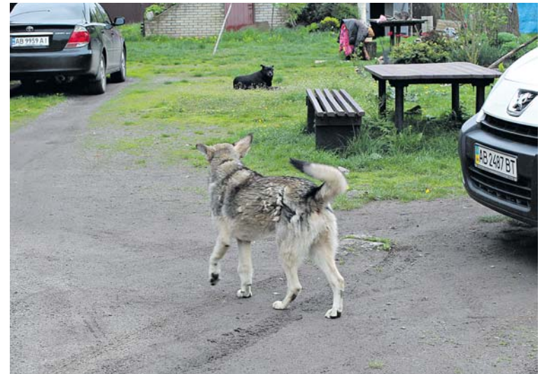
Дружок, обнюхавши чужинця, пішов до інших собак