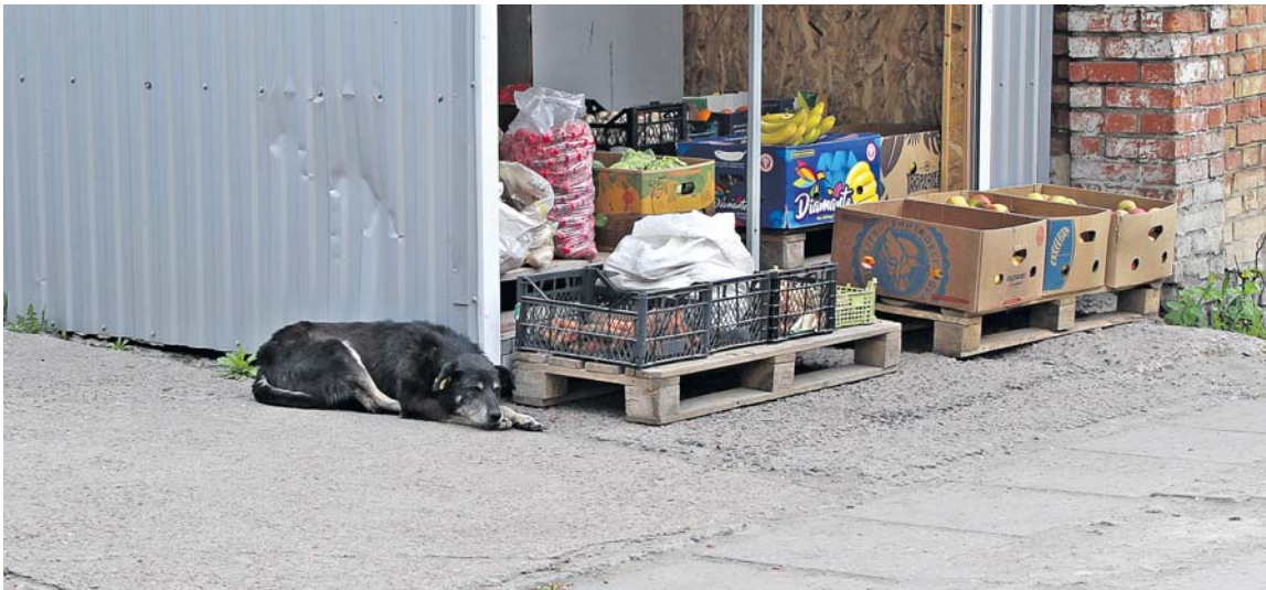
На ринку на ПРБ. Собака поводиться миролюбиво і не звертає уваги на перехожих