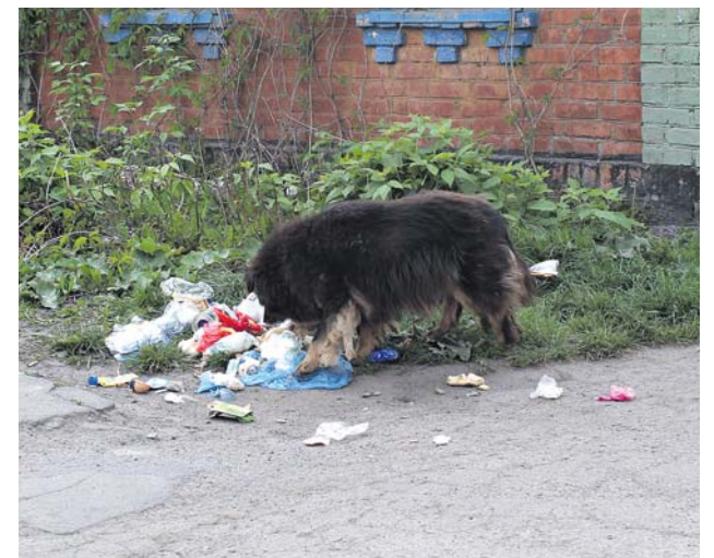
Хто шукає, той знаходить