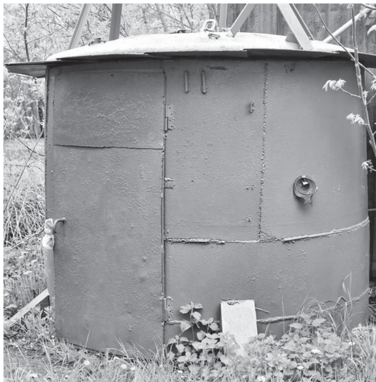
Фекалій на городах більше не буде. Насосну станцію пофарбували, нечистоти викачали і поставили нову помпу