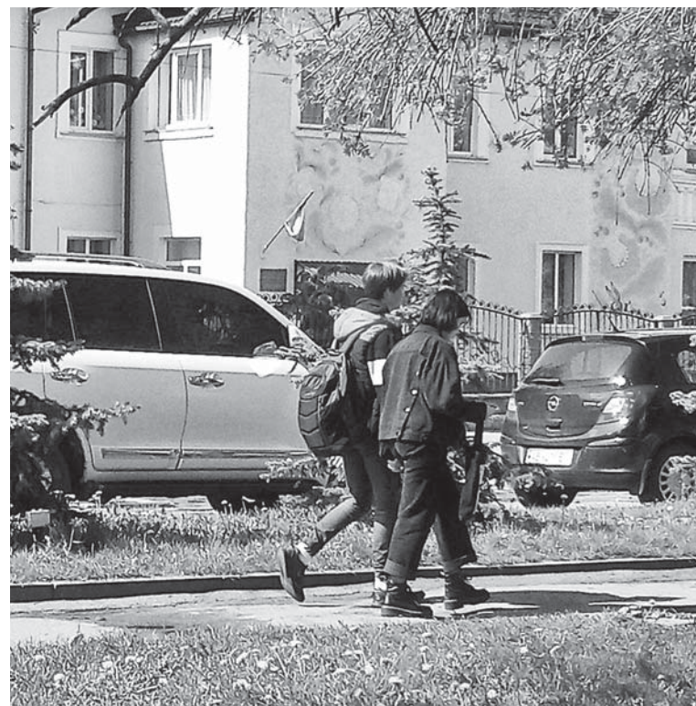
Одне з місць відпочинку – центральна площа. Тут часто можна побачити молодь

На тій стороні і у південно-західній частині міста закладів, які провадять гурткову діяльність, немає.