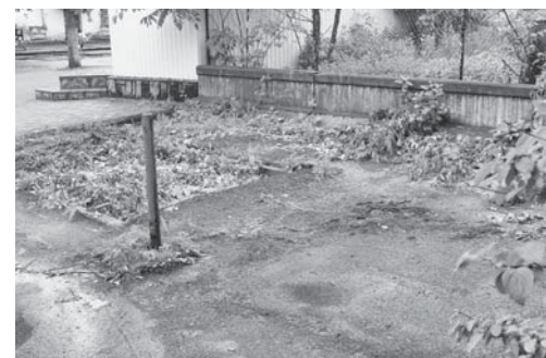
Дерева і бур'яни зрізали, але не прибрали

У нас є багато людей, які хочуть бачити наше місто квітучим. Сер-