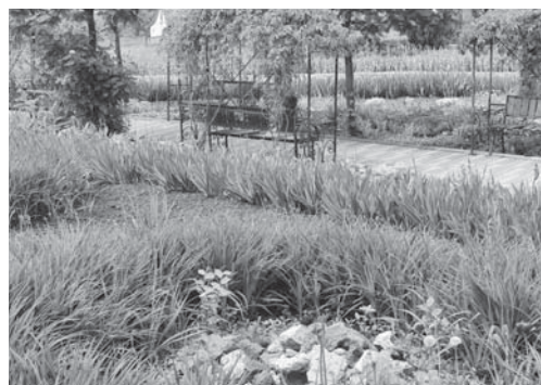
Це квітник у селі Козятині

Ми побували на місці колишнього кіоску і на квітнику, що