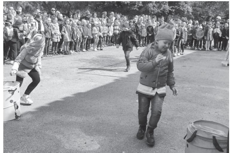
Центральна площа міста. Дітей розважали конкурсами

«Спортивна зупинка», «Пісенна зупинка» та «Інтелектуальна зупинка». У кожному конкурсі командам судді давали паперові знаки у вигляді пелюстки квітів. В конкурсах відгадування мелодій («Пісенна зупинка») та інтелектуалів лідирували старші з наймолодшими. У спортивному конкурсі, де капітан команди в ролі машиніста-залізничника мав по черзі перевезти на головну колію всі вагони, п'ятикласники допустили помилку. Машиніст на перегоні розвинув таку швидкість, що роз'єдналася автосцепка між локомотивом та вагоном. Тож квітка з найбільшою кількістю пелюсток виявилась у команди 3-го класу.