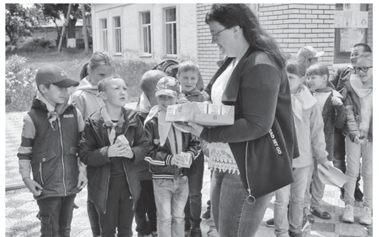
Школа №9. Подарунки для переможців