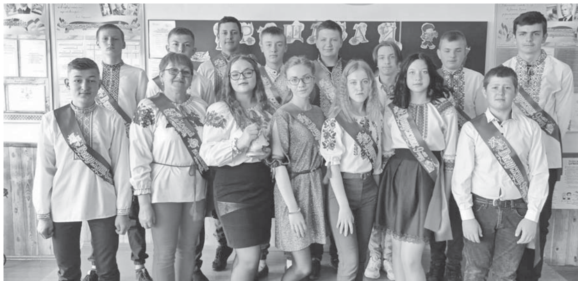
Випускники Кордишівської СЗШ. Цьогоріч школа набирає 11 клас востаннє, бо вже з 1 вересня вона буде дев'ятирічкою.

Вищеперераховані навчальні заклади стануть філіями вже з нового навчального року. Це означає, що ті їх учні, які мають з 1 вересня 2021-го піти до 10 чи 11 класу, будуть навчатися в опорних школах. Тобто, десяти- й одинадцятикласники з Залізничного будуть приїздити на навчання до ліцею, а старшокласники з Флоріанівки та Кордишівки — до школи-гім-