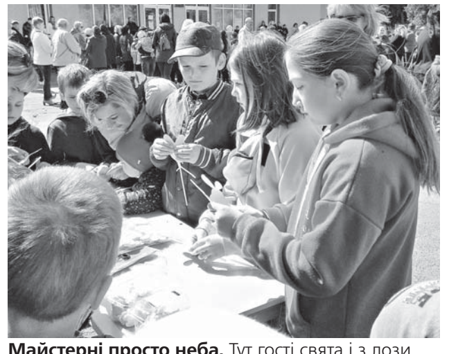
Майстерні просто неба. Тут гості свята і з лози плели, і кульки надували, і зайчиків робили