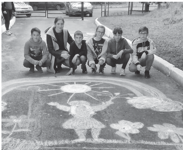
Пиковецький ЗНВК. Діти малювали на асфальті

— Головний обов'язок суспільства та держави — зігрівати теплом і любов'ю дитячі серця кожного ранку, кожного дня та об'єднувати зусилля заради їхнього майбутнього. Діти — наше майбутнє, а значить — майбутнє України. І саме від нас, дорослих, залежить, якою буде доля дитини в дорослому житті, — сказали організатори.