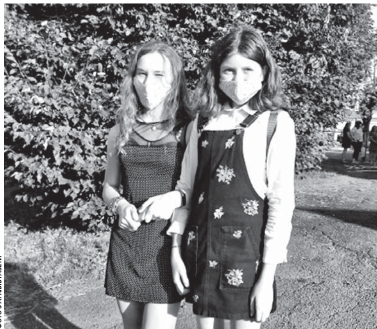
ФОТО З АРХІВІВ ГАЗЕТИ

Все ж до кінця першого семестру середня і старша ланки школи повернулися до тради-