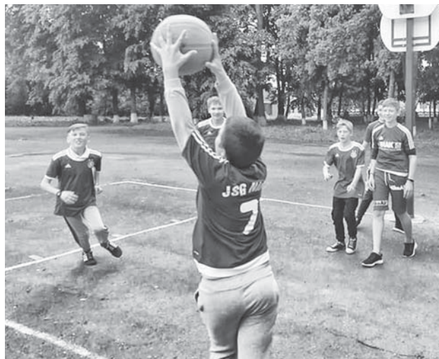
Махаринці. Турнір зі стрітболу