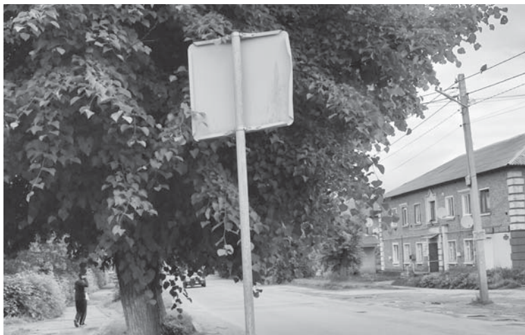
Дорожній знак «пішохідний перехід» водії за листям дерева не бачать

— Ми з цього приводу підємо на прийом до міського голови Тетяни Єрмолаєвої. А ви напишіть статтю, щоб нова влада знала, що є у нас така проблема з пішохідним переходом, — кажуть люди. — Ми з цим питання зверталися до минулої влади. Навіть обіцяли, що внесуть зміни до бюджету і виділять кошти на лежачого поліцейського. Тільки все це залишилось на рівні обіцянок. Ми хочемо, щоб наші діти мали можливість безпечно перейти через дорогу до школи та дитячого садочка. Для цього потрібно встановити лежачого поліцейського, а по можливості поставити світлофор. Ми розуміємо, що завтра таких змін не станеться, тому хочемо, щоб дорожній знак «пішохідний перехід» був видимим для водіїв. Щоб оновили дорожню розмітку і на умовному тротуарі не було стоянки машин, тому що біля цього переходу можна потрапити під колеса автівки, не виходячи на пішохідний перехід. Жвавий рух транспорту часто відбувається навіть за спиною пішоходів. Звертаємося і до водіїв. Перш ніж сісти за кермо, згадайте, що на 8-ій Гвардійській переходять дорогу діти.