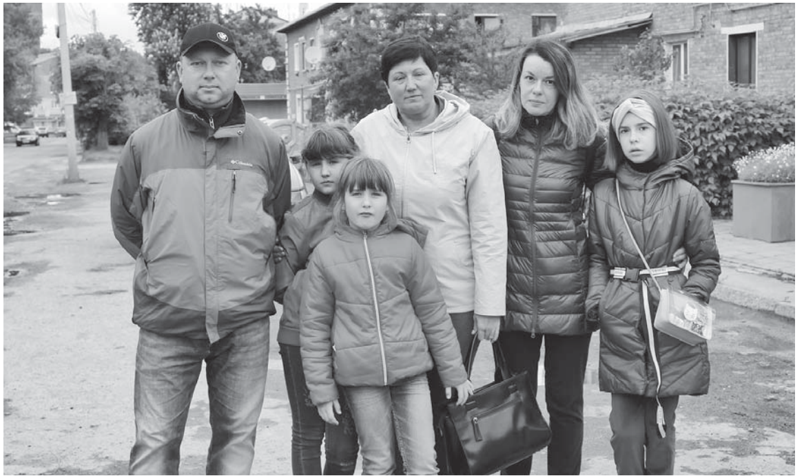
Батько школяра та свідки події. Вони кажуть, що цей перехід на 8-ій Гвардійській дуже небезпечний. І проблему треба негайно вирішувати