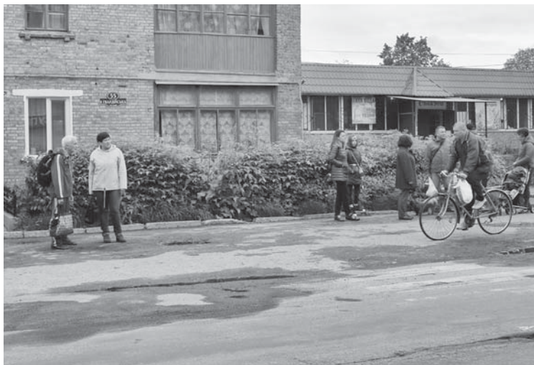
Де «зебра»? Дорожньої розмітки практично не видно