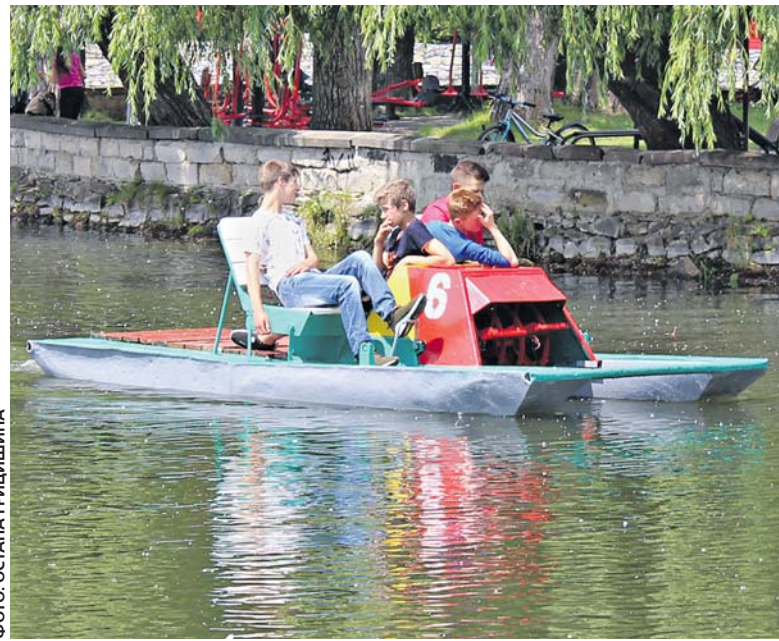
У пункті прокату біля острівця «Чайка» нам провели короткий інструктаж, але рятувальних жилетів не дали

— У нас чергують завжди два рятувальники, але випадків перевертання ще не було, оскільки катамаран — це найбезпечніший водний транспорт. Ці, що в нас,