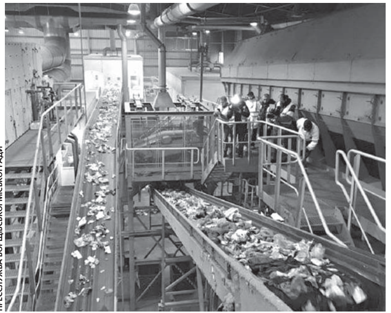
ПРЕСЛУЖБА БОРШІВСЬКОЇ МІСЬКОЇ РАДИ

На офіційній сторінці Гусятинської громади є публікація під наз-