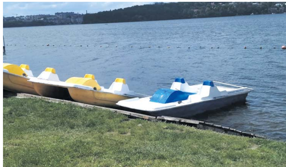
У Тернополі є три пункти прокату катамаранів

Отож, як ми переконалися, на катамаранах в Тернополі покататися можна за різну ціну, але не всюди вам видадуть рятувальний жилет, якщо ви того не попросите. Катамарани в доброму стані. Головна претензія в тому, що кваліфіковані рятувальники є лише в одній точці прокату. Тож обираючи собі таку розвагу, ви самі відповідаєте за своє життя!