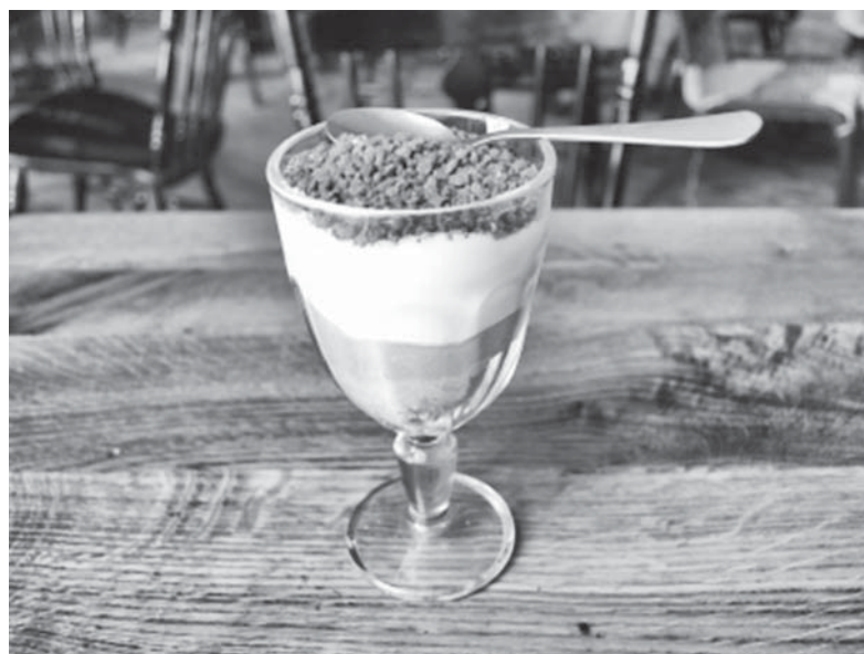
«Цицька» був найпопулярнішим десертом в «Козі»

У пошуках ідеї для назви закладу підбирали декілька варіантів. Але зупинилися саме на «Козі».