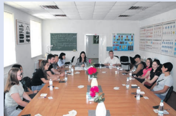
І діагноз, і прогноз у молодіжній політиці стає відомим через спілкування