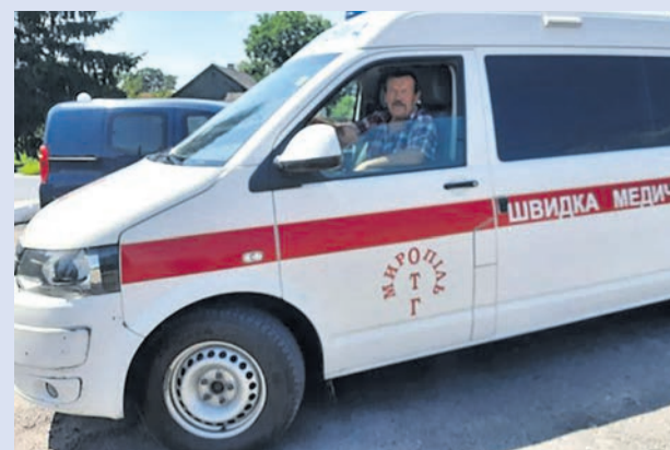
Швидка допомога для швидкої

Планувалося, що з 1 липня 2021 щомісячну доплату у розмірі 400 гривень почнуть отримувати пенсіонери віком від 75 до 80 років (аналогічно, якщо їхня пенсія не досягає розміру середньої заробітної плати в Україні, яка враховується для нарахування пенсії). У червні пенсіонерам видали підвищені пенсії та доплату за квітень і травень.