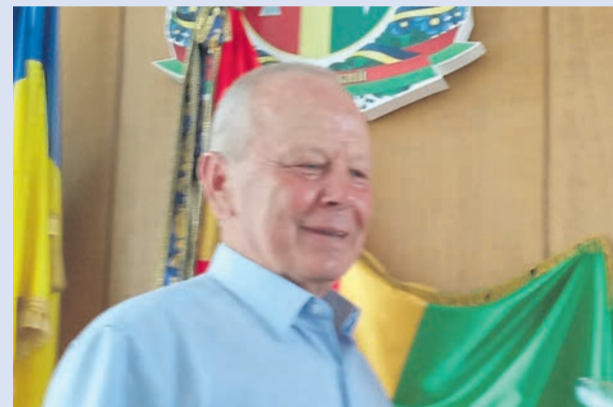
Ювіляр почесний, але сповнений сил, наснаги і завзяття!