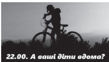
22.00. А ваші діти вдома?

У зв'язку з настанням літніх канікул служба у справах дітей селищної ради нагадує, що з метою попередження злочинності як з боку дітей, так і проти них, стимулювання відповідальності батьків за виховання та розвиток дітей у Романівській селищній раді затверджено графік профілактичних рейдів «Діти вулиці», «Дозвілля молоді у вечірній час» на літній період 2021 року.