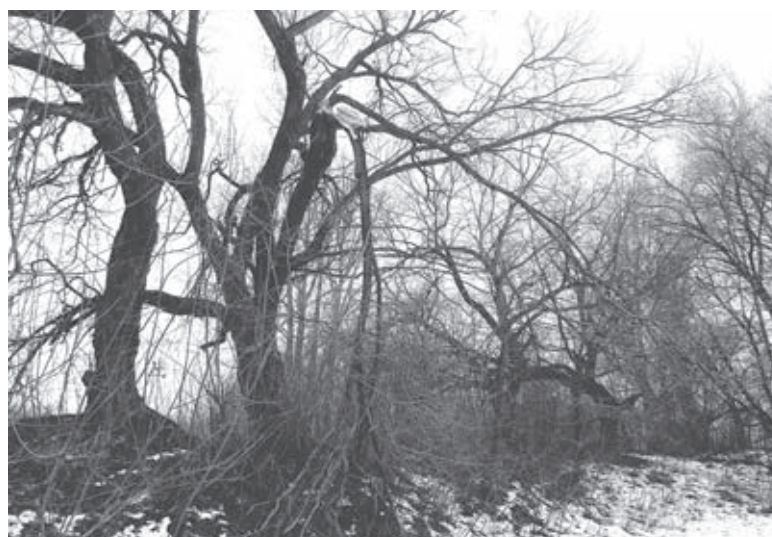
Поле одразу за стадіоном. Гілка одного з дерев тримається на чесному слові