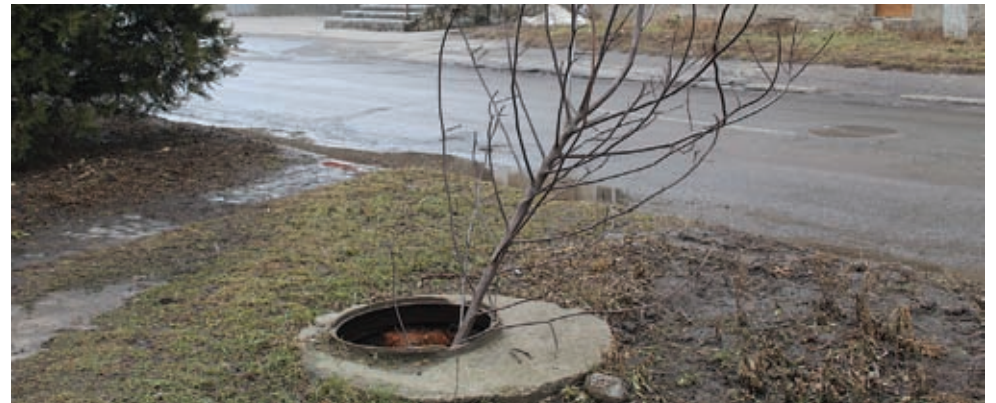
Знову відкритий люк. Цього разу біля палацу дитячо-юнацької творчості