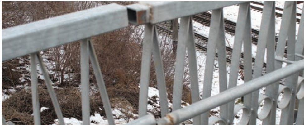
«Перша ластівка» на мосту. Відійшло зварювання поручня

До кожної кришки люка відеокамеру не поставиш. Але кришок вже вкрадено стільки, що вже треба з цим щось робити. Або кришки люків наперед замовляти, або правоохоронці мають посилити контроль за пунктами прийому металобрухту.