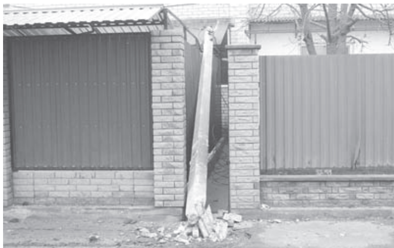
Від удару автомобіля стовп впав між парканами

Нам не вдалося поспілкуватися ні з водієм, ні з господарем домоволодіння, якому нанесені від ДТП матеріальні збитки.