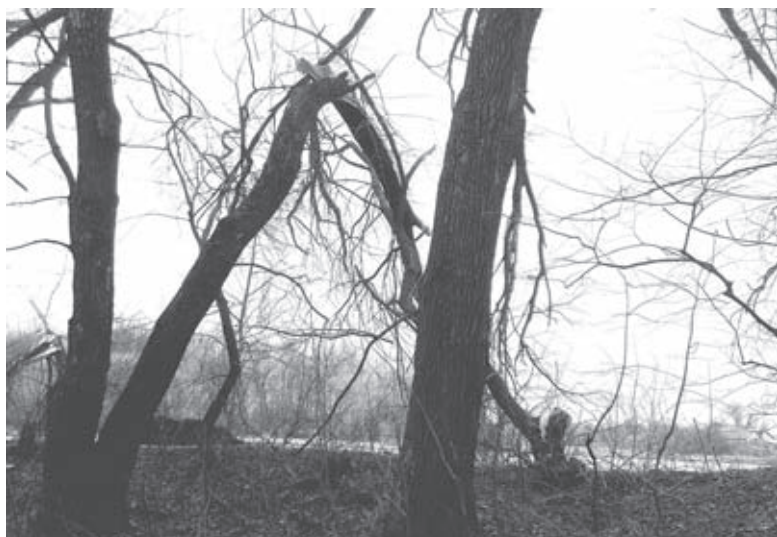
Ще одне аварійне дерево нависло над стежкою. Проходити під такою аркою лячно

Хай би там як не було, але з деревами там проблеми не вперше. Років зо два тому тріснув стовбур верби, що росте біля берега одразу за костелом. Величезний шматок дерева впав у Водокачку. Відтоді він і лежить там, його так і не забрали. Лише бобри час від часу сточують об нього свої зуби. На самому острові одразу за огорожею з боку волейбольного майданчика часто-густо чути, як скриплять дерева. А стовбур одного з них якось обвалився на волейбольний майданчик. Напрошується питання — може час запросити на стадіон лісопатолога?