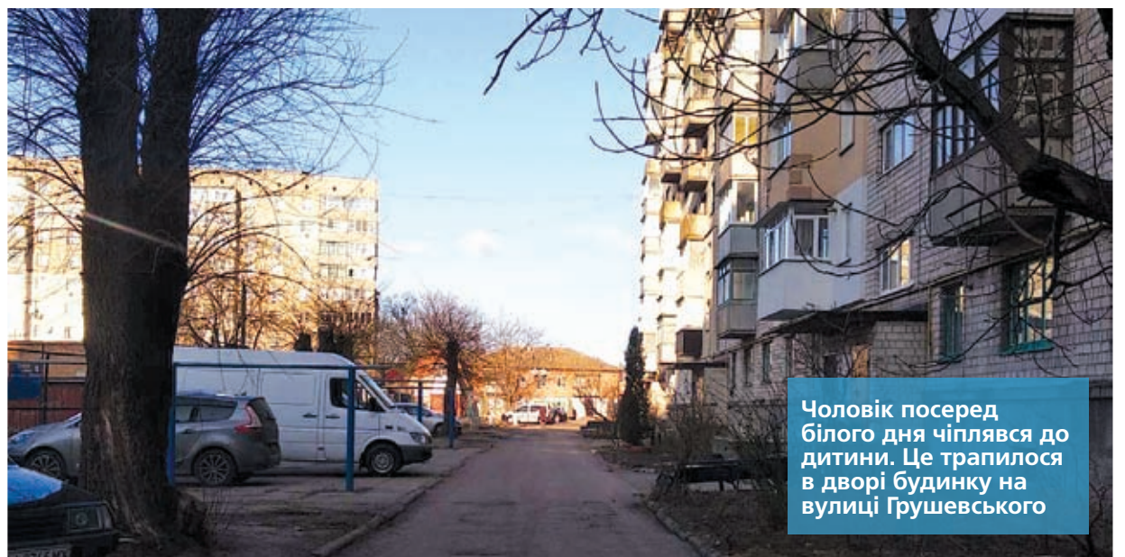
Чоловік посеред білого дня чіплявся до дитини. Це трапилося в дворі будинку на вулиці Грушевського