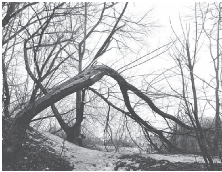
Стовбур тріснув так, наче його рубали сокирою. Невідомо, як довго він ще простоїть перед тим, як впасти

І тут виявилось, що таке аварійне дерево на Водокачці не одне. Бо з правого боку від поля ми побачили ще одне. Що-