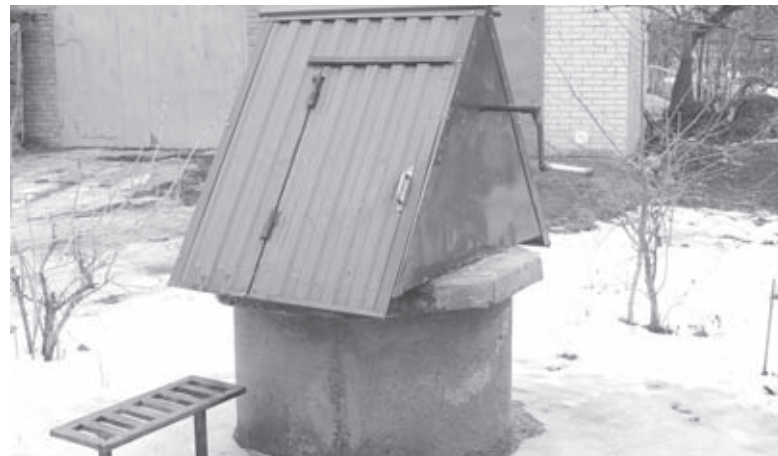
Криниця, з якої витягли кота. Ніхто його туди не кидав, він сам вмудрився у відро вскочити

мало хто знав, що в криницю кіт падав. Поки дезінфекцію не провели, треба табличку приклеїти, щоб поки воду люди з криниці