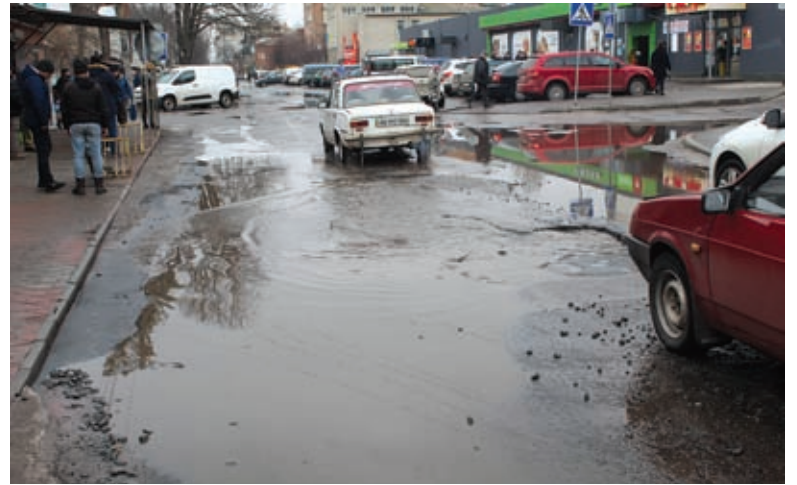
Калюжа на Грушевського. Для велосипедистів вона небезпечна своєю глибиною

На мосту через залізничні колії розірвався зварений стик поручня переходу. Бити на сполох, що рушиться міст, в цій ситуації, мабуть, недоречно. А щоб звернули увагу на міст спеціалісти — буде самий раз.