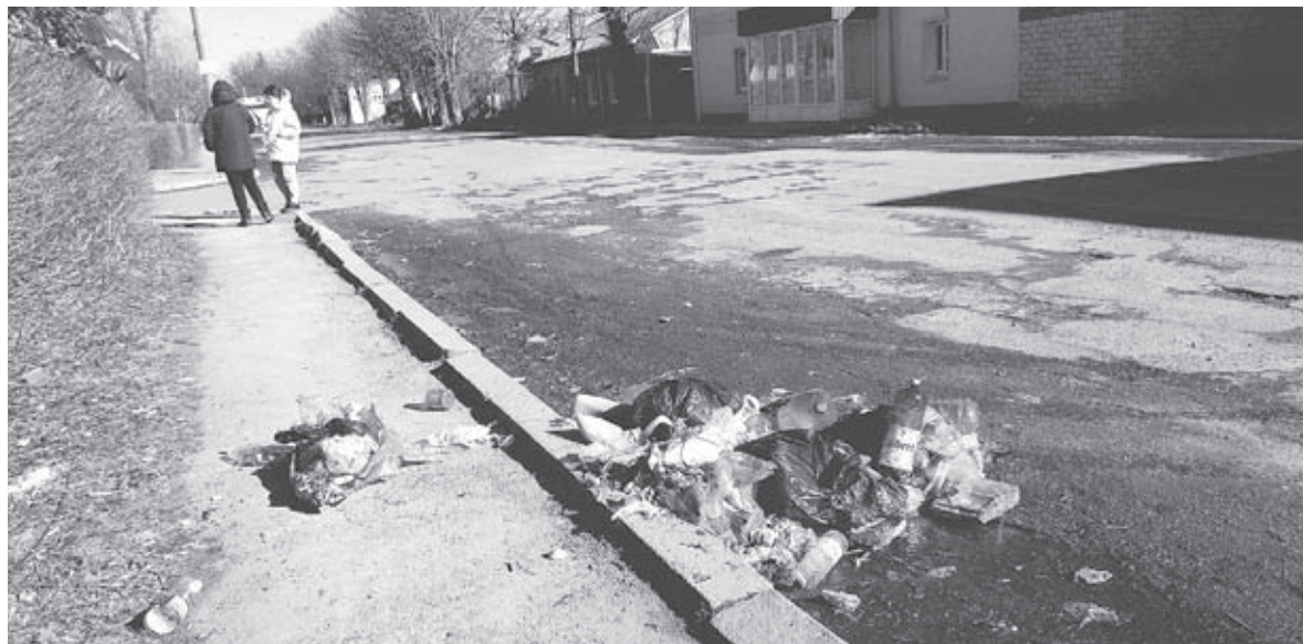
Вулиця Винниченка у вівторок, 15 лютого. Знову гора сміття

Козятинчани таку новину сприйняли двоєко. У коментарях на нашому сайті дехто з читачів писав, що давно пора було так зробити, нарешті це питання буде вирішено. Втім лєвова част-