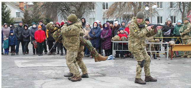
Пораненого виносять з поля бою під прикриттям побратима