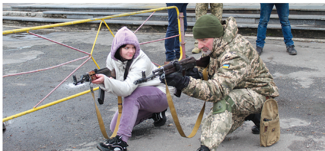
Інструктор рукопашного бою під позивним «Дід» проводить навчання з козятинчанами