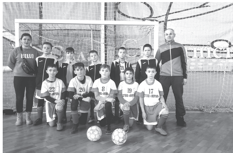
Молоді футбольні таланти Махнівки на турнірі в Житомирі