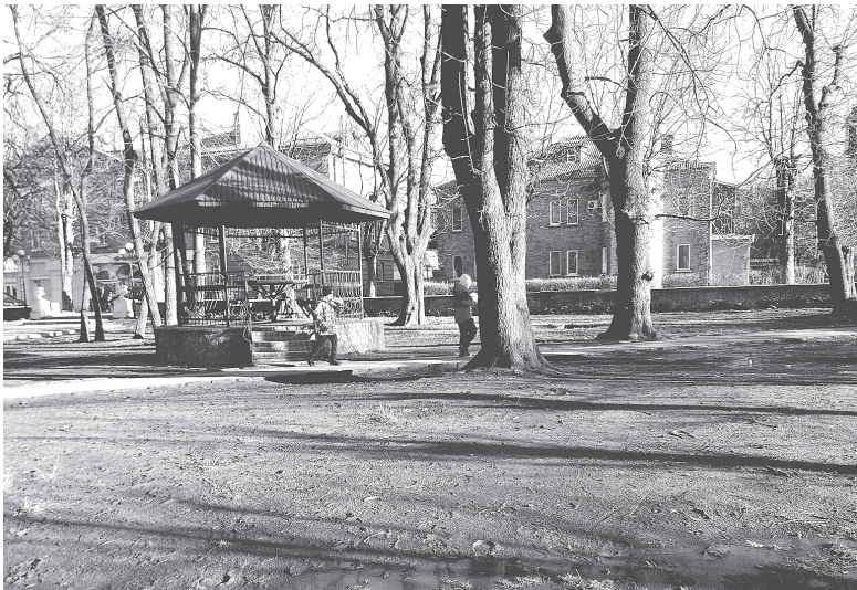
Козятин, Пушкінський парк. Альтанка, де люблять відпочивати козятинчани

ку є дві амбулаторії сімейної медицини, але зареєстровані вони за однією і тією ж адресою. Загалом там працює 21 сімейний лікар. У Козятині теж дві амбулаторії, але розташовані вони у різних приміщеннях. Загалом у нас працює 23 сімейних лікарів. Втім окрім комунальних центрів надання первинної медико-санітарної допомоги у Хмельнику працюють також і три приватних сімейних лікарів.