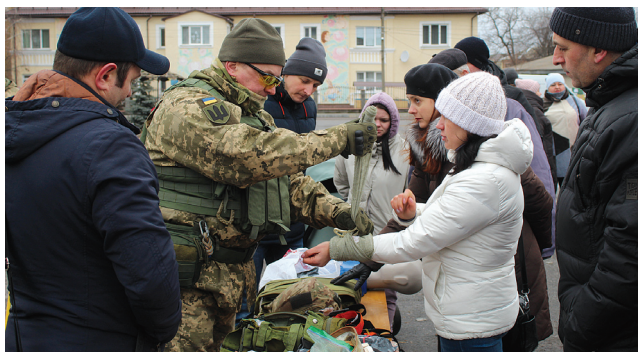
Інструктор медик навчає козятинчан, як правильно накласти жгут