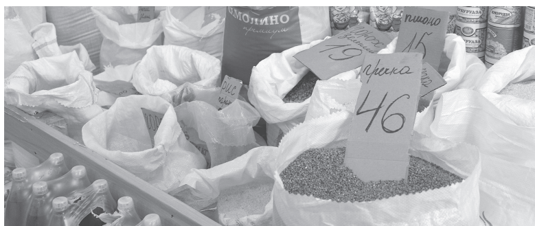
Гречка знов побила рекорд

Підскочили ціни на продукти борщового набору. Місяць тому морква коштувала 13–15 гривень, тепер — 20 гривень за кілограм. Червоний буряк можна було купити за 10 гривень, а тепер цей продукт продають по 15–17 за кілограм. Ще на гривню додала в ціні цибуля. Тепер її можна купити по 13–15 грн. Зелена цибуля стабільно доро-