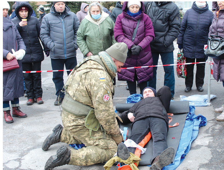
Військові наочно показували, як підготувати пораненого до транспортування

З тих, хто до зброї не дотягнувся і з рукопашної не було вільних інструкторів, розділилися при-