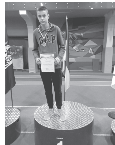
Олексій Лясковець чемпіон України в стрибках у висоту