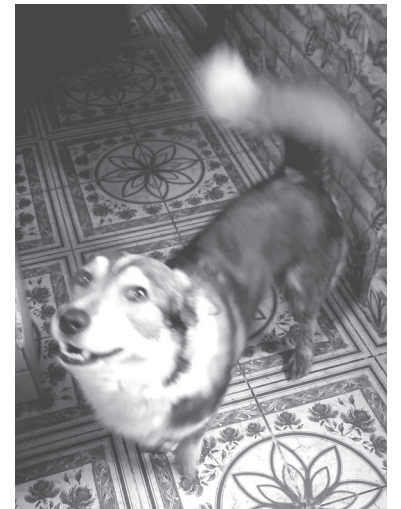
А це Бублик. Його козятинчанка теж знайшла на стадіоні

Дівчинці і двом хлопчикам близько двох років, Спайк трохи старший. Усі мають необхідні щеплення, не стерилізовані.