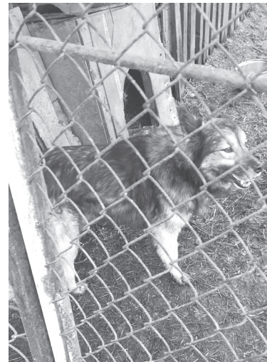
Цього красеня звать Спайк. Його підкинули на стадіон малим цуценям

Тому чотирилапіх треба терміново влаштувати у нові родини. Кожен з цих милих песиків має свою історію. Двоє — братик і сестричка. Їх маму козятинчанка знайшла у лісі неподалік від міста. Безсердечний горе-господар викинув вагітну собаку на вулицю. Мама-собака вже давно померла, а цуценята, яких вона привела, так і залишилися жити у козятинчанки. Ще одного хлопчика, Спайка, жінка знайшла на стадіоні ще зовсім малим цуценям, його вигодувала киця. Іншого собаку, Бублика, козятинчанка теж знайшла. Попередній горе-господар вирішив його позбутися, підкинувши на стадіон.