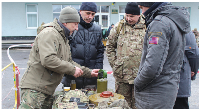
Інструктор-вибухотехнік проводить урок безпеки з вибухівками

курсанти і інструктори зібралися біля польової кухні, де військові Козятинської ВЧ пригостили всіх охочих чаєм з лимоном. Інструктор з позивним «Дід» розповідав цивільним про 12 больових точок людини, коли суперник може втратити свідомість. Тож подумалося: скільки знають і вміють інструктори. За три години навчань не все встигли показати. Але за бажанням це можуть зробити козятинські знавці рукопашного бою. Саме біля чаю виявилось, що серед цивільного населення нашого міста є люди, які добре володіють багатьма прийомами рукопашного бою.