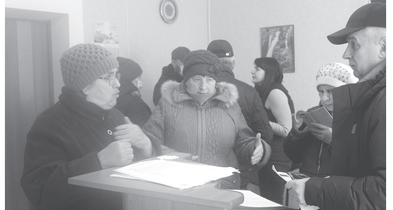
В «Сігнет центрі» пайовиків почули. Але з рішенням треба почекати до весни

На що селяни сказали: «Вирішуйте, а то ми знову прийдемо