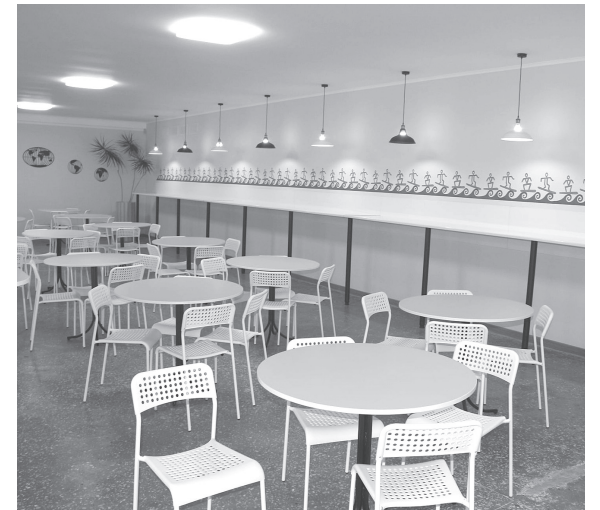
У школах Козятини почали оновлювати харчоблоки. Сучасну їдальню відкрили у ліцеї

Центральної площі у Хмельнику як такої немає. Дві площі, які є у місті, більше подібні до скверу, облаштованого у Козятині біля пам'ятника Грушевському. Один із них розташований у самісінькому центрі Хмельника. Там облаштовані клумби і стоять пам'ятники воїнам-інтернаціоналістам та монумент воїнам, що загинули у Другій світовій війні. Трохи далі на північ, неподалік