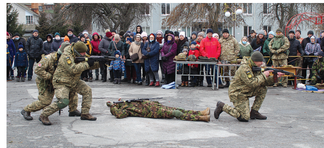
Тероборонівці навчали цивільних козятинчан всього потрохи, що вміють самі