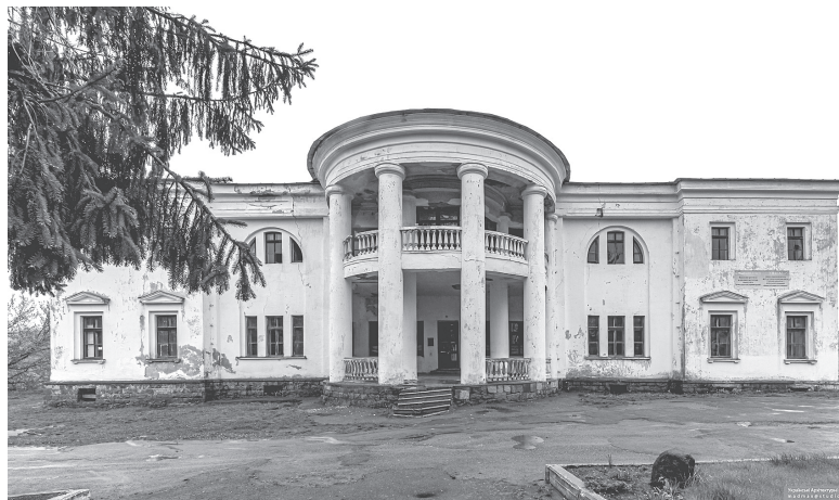
Архітектурна перлина Хмельника — палац Ксідо. Стоїть пустою і руйнується на очах

Хмельник — місто-курорт державного значення. Його часом порівнюють із Баден-Баденом, найбільшим бальнеологічним курортом Західної Європи, оскільки санаторії у Хмельнику також спеціалізуються на лікуванні мінеральними водами. Тож не дивно, що у місті навіть є вулиця Курортна, на якій розташована