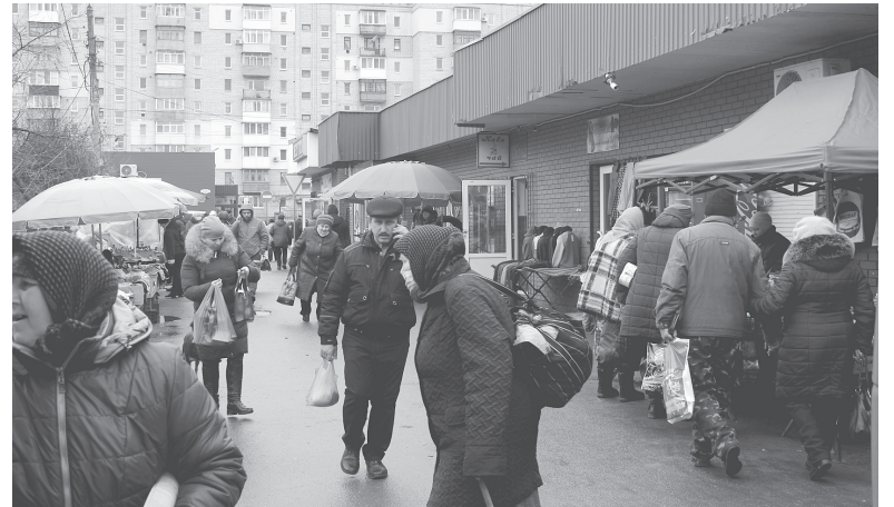
Куди не глянь – високі ціни

Ціни на виноград також змінилися. Наш вітчизняний, який дожив до цієї пори — 45–50 гривень, імпортний від 120 до 173 гривень за кілограм. Продавець попередила: «Сьогодні на виноград така ціна, а завтра