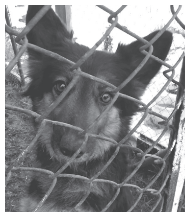
Братик і сестричка. Їх маму козятинчанка знайшла у лісі — вагітну собаку викинув попередній господар

Чотири гарних і вихованих песики шукають нову родину. Донедавна вони жили у молодій козятинчанки. Жінка дуже любила тварин і присвячувала їм увесь свій вільний час. Вони стали для