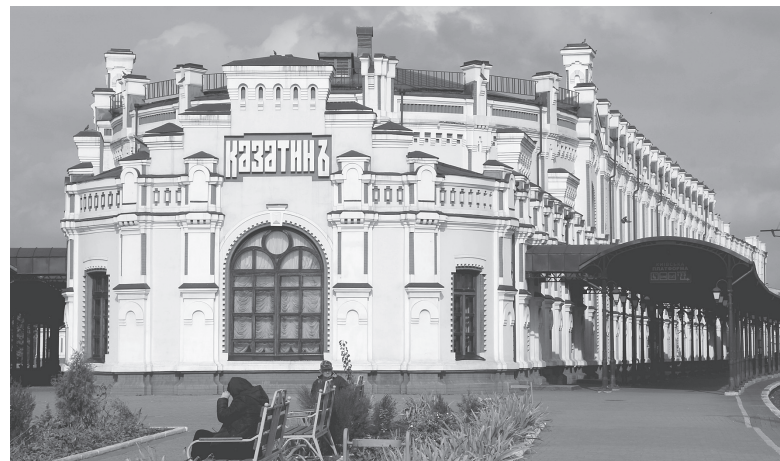
Архітектурна перлина Козятини — вокзал. Старший за палац Ксідо на 13 років

За даними Національної служби здоров'я України, у Хмельни-