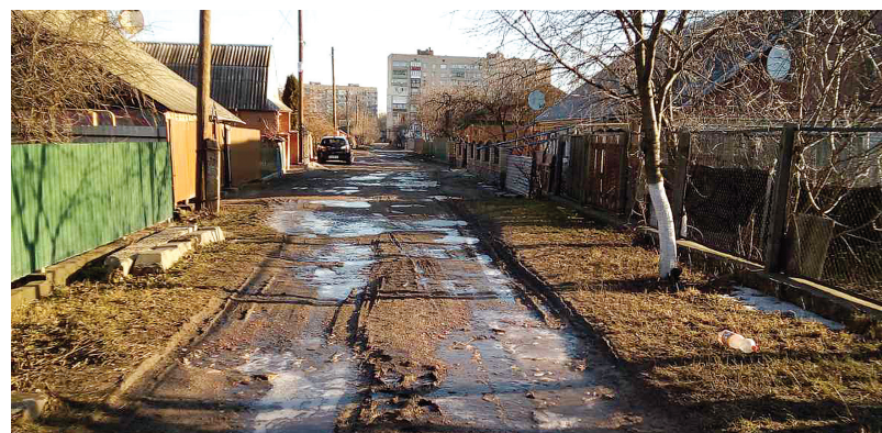
«Я робила знімок вранці, коли калюжі підмерзли. А взагалі вони розливаються на всю ширину дороги», — каже козятинчанка

І це фактично в центрі міста. Вулиця йде від Куліковського до магазину «Екзотік». Це якихось 300 метрів і їх не можуть довести до пуття. Крім того, і освітлення тут немає. Душа болить. Я вчора мусила обходити по Грушевського, бо по нашій вулиці пройти практично неможливо. Грязюка така, що по кісточки встрягаєш.