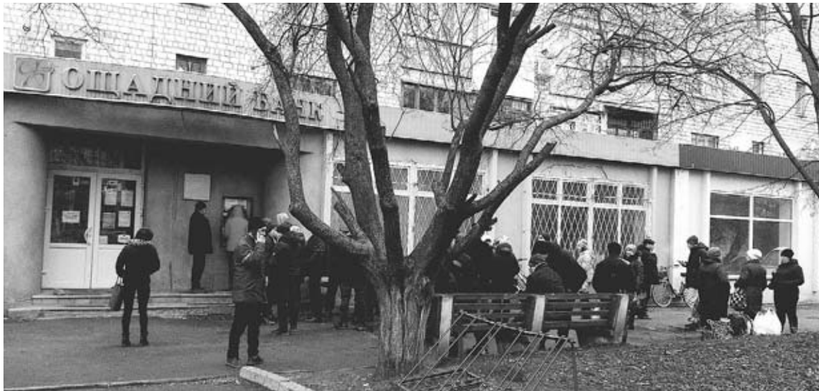
Цю світлинку ми зробили 24 лютого, у перший день повномасштабної війни. Біля банкомата зібралася велика черга, люди годинами чекали, щоб зняти готівку

У громадах сформувалися загони територіальної оборони, яка спільно з поліцейськими стала підтримувати порядок. Козятин не став винятком. За цей час наша тероборона вже кілька разів ловила у місті продавців наркотиків. Поліцейські спільно з тероборонівцями накрили не одну