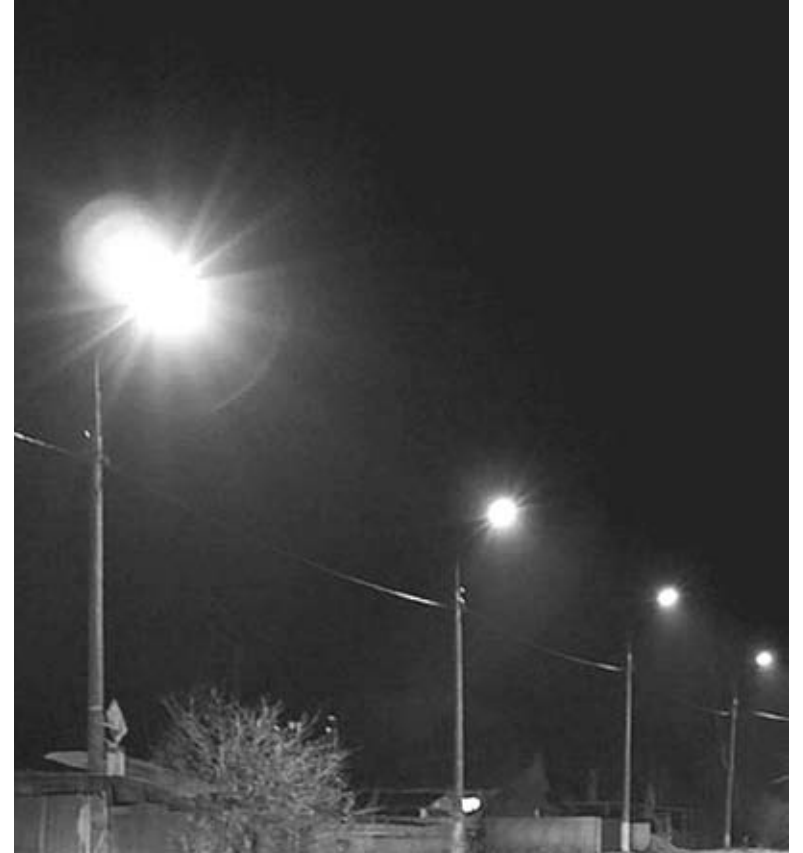
Півтора місяці вулиці громади не освітлювали. Тепер ліхтарі увімкнули і на це є причина. Фото ілюстративне

Буквально вчора тему вуличного освітлення стали піднімати знову. «На Депутатській вулиці включили освітлення на стовпі, що вже світломаскування