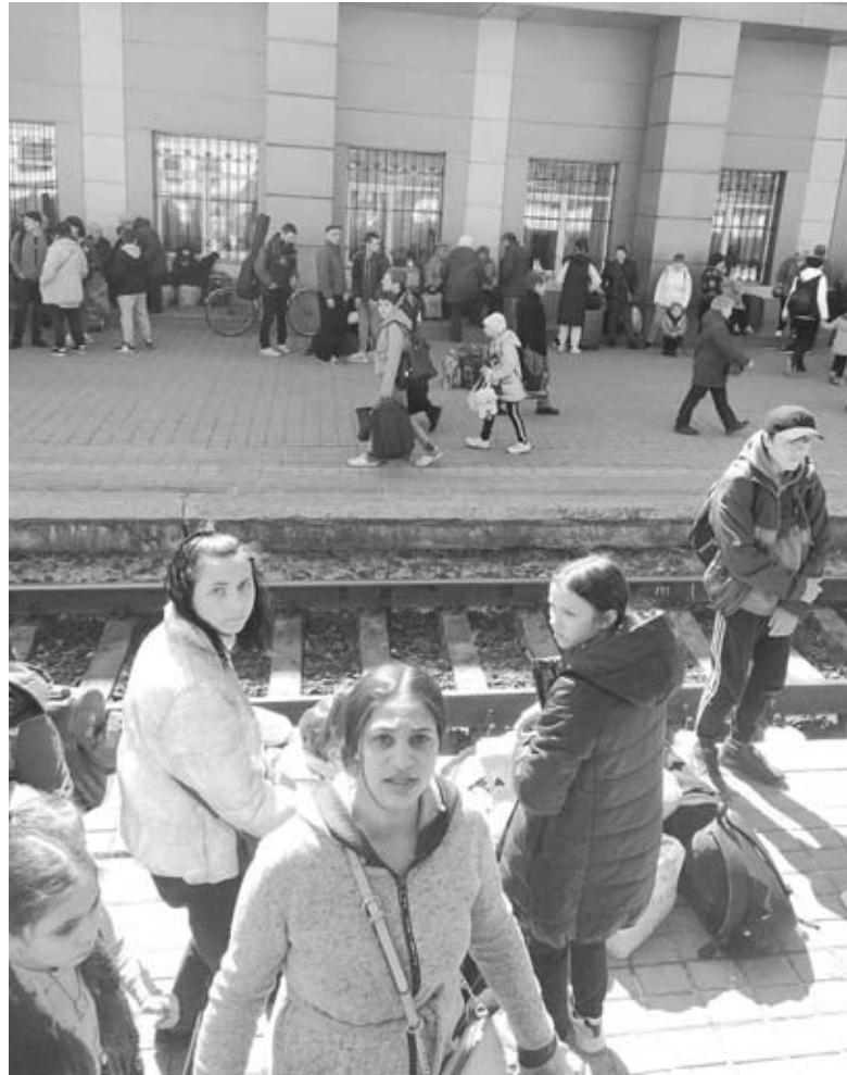
Під час евакуації з Покровська, що на Донеччині, люди були в паніці. В той день рашисти кинули ракету на Краматорськ, де загинуло більше півсотні мирних жителів

— Коли ми вже виїхали з Покровська і прямували до Чернівців, ворог здійснив ракетний обстріл по залізничному вокзалі у Краматорську, що теж на До-