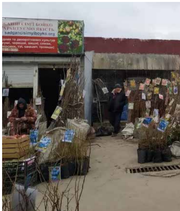
По саджанці найкраще йти на ринок. Їх справді дуже багато: від груш і яблунь до хурми та винограду