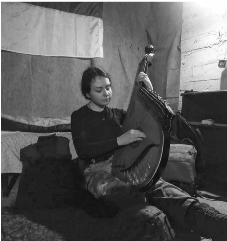
«Пташка» рвалась на передову, аби допомагати хлопцям

Слава захисникам України! Молимося за вас, за нашу перемогу!