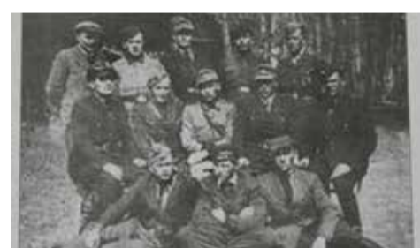
Різнобарв'я повстанського одягу

А ось це фото дійсно легендарне! На ньому зображене командування воєнної округи