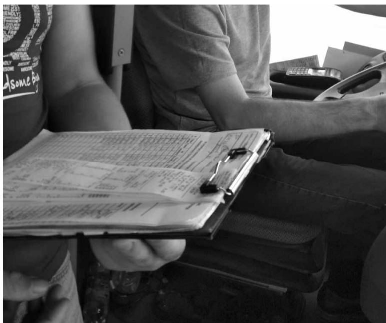
ПРЕСЛУЖБА ТЕРНОПІЛЬСЬКОЇ МІСЬКОЇ РАДИ

Із 2 по 4 травня контролери перевірили 114 одиниць приватного і комунального громадського транспорту та 436 пасажирів. Пасажирам без квитка виписали штраф