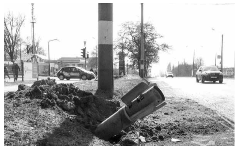
Впав снаряд і не розірвався. Згодом приїхали сапери