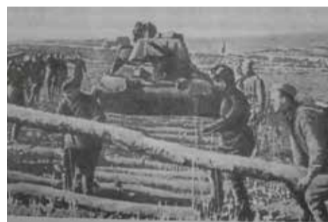
Солдати одягнені у літній військовий однострій

На першій світліні зображений командир 302-ї стрілецької дивізії Микола Кучеренко, який прославився у Проскуровско-Чернівецькій наступальній операції (штурм міста-фортеці Тернополя). На військовослужбовцеві одягнена офіцерська гімнастерка зразка 1943 року і військовий кашкет із зіркою. Це зразок одного з варіантів літньої форми солдатів Червоної армії. Вона здебільшого складалась з гімнастерки, штанів галіфе й чобіт. На головах хлопці часто носили пілотки.