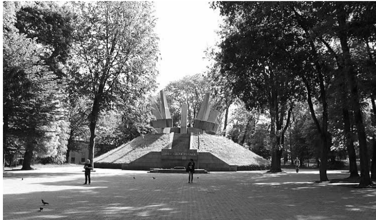
ПРЕСЛУЖБА ТЕРНОПІЛЬСЬКОЇ МІСЬКОЇ РАДИ

Рішення про конкурс щодо реконструкції парку міськвиконком прийняв у рамках дерусифікації та декомунізації в Україні у зв'язку з військовою агресією росії