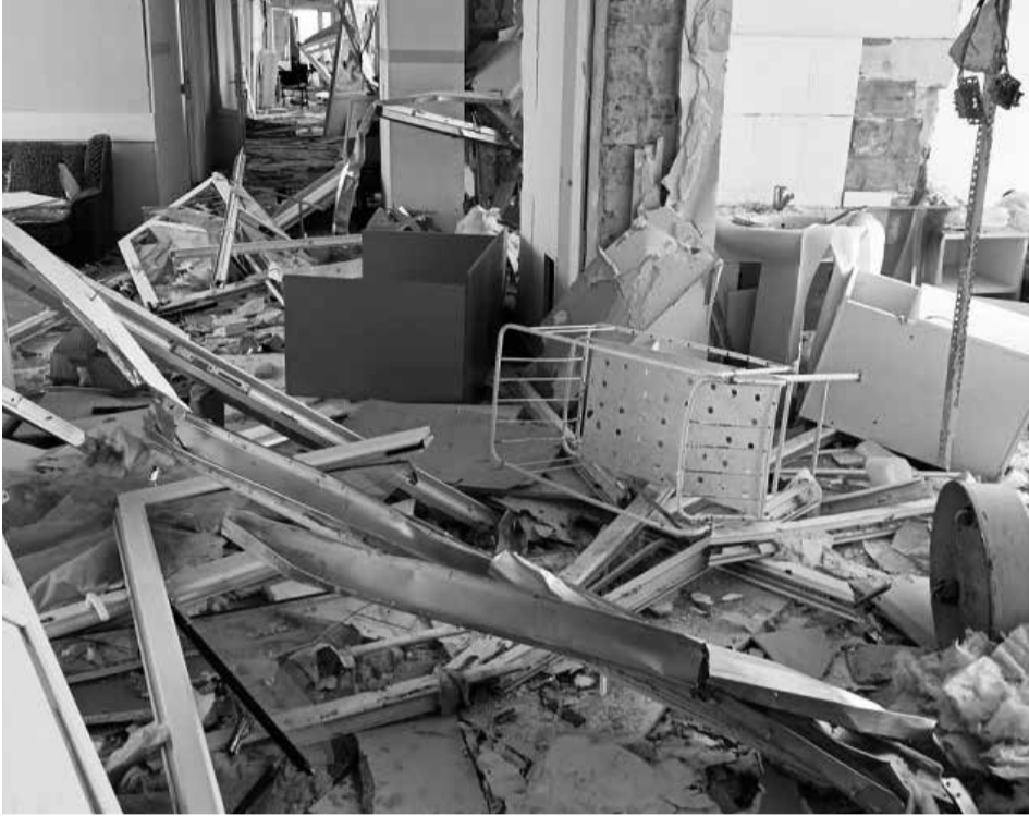
Фото розбомбленого пологового в Маріуполі бачила вся країна