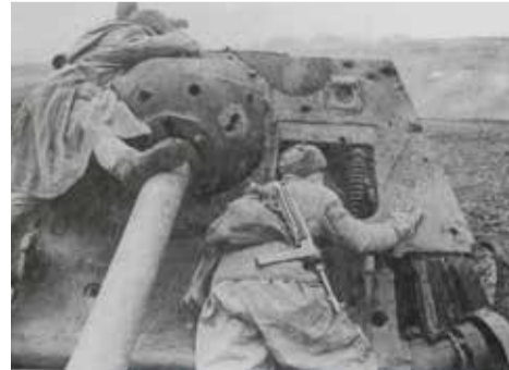
Зимовий радянський однострій

— На цьому зображенні також бійці Червоної армії в однострійній зразка 1943 року. Як я це визначаю? Переважно до 1943 року комірці були відкладними, а вже опісля — стійкими. В боях за Тернопіль дуже рідко можна було зустріти форму раннього зразка, адже переважно до цього періоду вона вже зносилась. Частина солдатів на фото носить пілотки, у декого — танковий шолом на голові. З озброєння вони мають автомат ППШ. Можливо, це готується шлях для бронетехніки, зокрема на фото помітне переміщення танка Т-34, — ділиться Володимир Пукач.