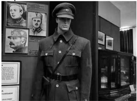
Однострій дивізії, яка формувалась неподалік Скали-Подільської

— У ті часи в Українській Галицькій Армії часто можна було помітити елементи військової форми Австро-Угорщини, адже чимало українців там служили. Шинелі на солдатах теж австрійського крою. Озброєння хлопців не дуже помітне, бачимо тільки пістолети у них на поясі, — каже історик.