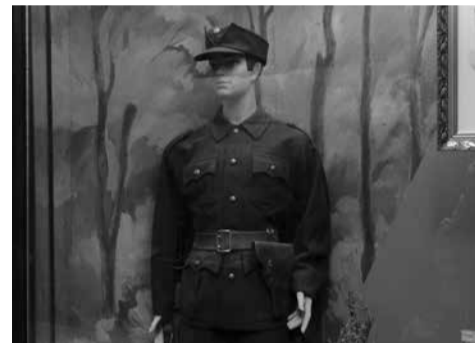
Однострій повстанця періоду 1943 р.

В Тернопільському обласному краєзнавчому музеї зберігається відтворена форма вояка повстанської армії періоду 1943 року, коли УПА тільки формувалась на території Волині та Полісся.