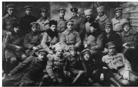
Жидівський пробойний курінь УГА