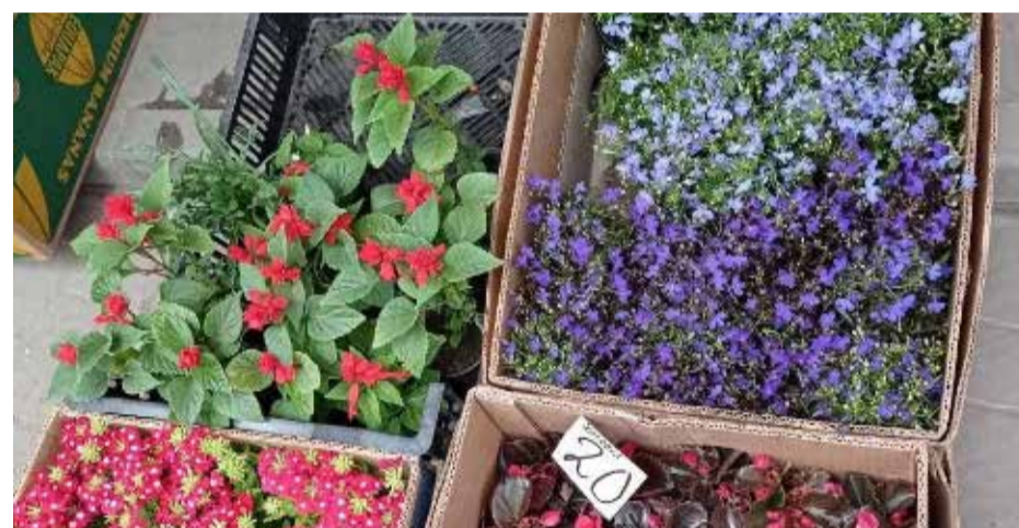
Продають бегонії, ромашки, медунки тощо. Ціни в середньому 20–25 гривень. Найдорожча еріка – 130 гривень за рослину