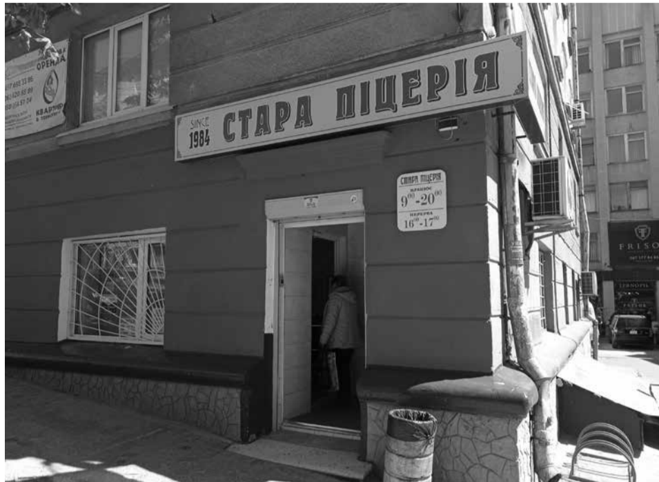
У «Старій» та «Добрий піці» подібний асортимент – піца, бульйон, спагетті, соки. Щоправда, у другому варіанті ціни вищі