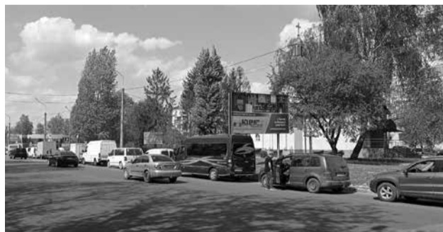
Від заправки до Комбайнового заводу була черга з водіїв, довжиною понад кілометр