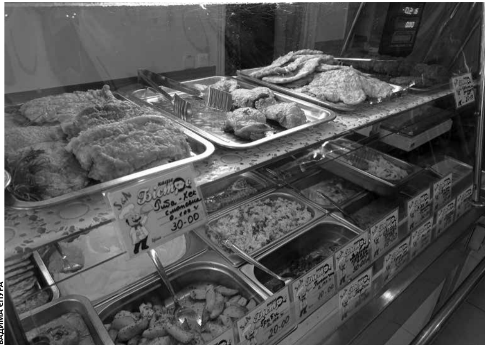
У «Бістро» та «Пиріжковій» можна замовити повноцінний обід. Є великий асортимент різних страв

Огляд ■ У місті є чимало невеликих закладів, кафе та МАФів, де можна ситно поїсти, навіть якщо в кишені всього 50 гривень. Дивіться асортимент та ціни у невеликих кафе та МАФах з вуличною їжею