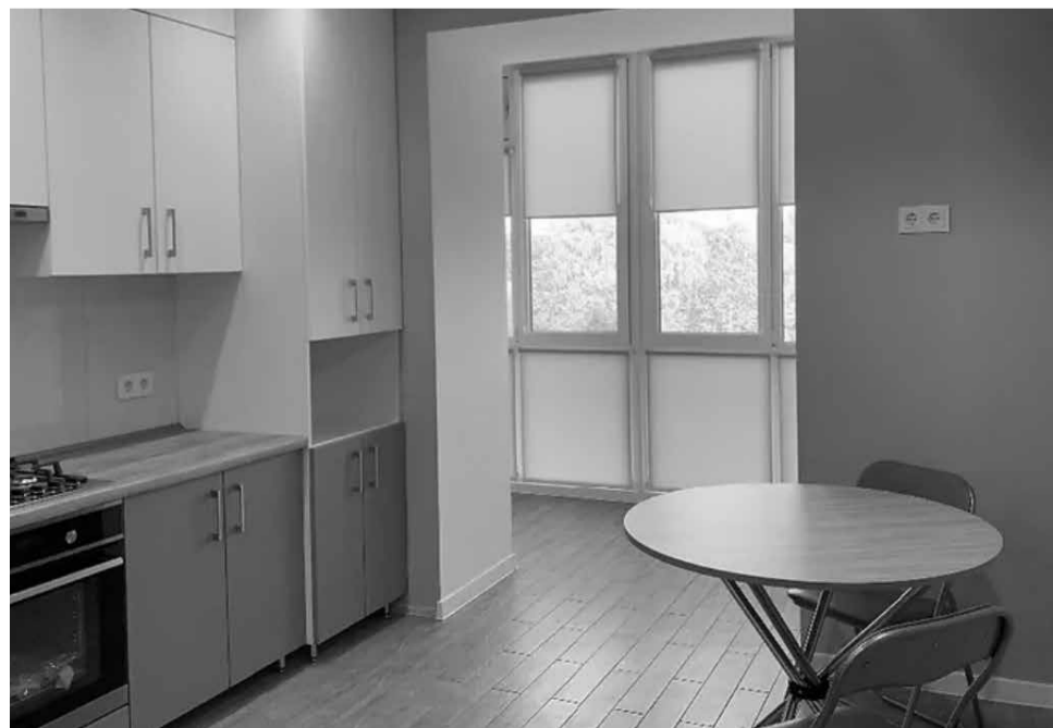
Двокімнатна квартира на Королева обійдеться у 12 тисяч гривень на місяць. Помешкання з ремонтом