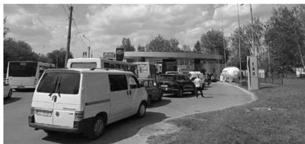
Люди чекали по 6 годин, щоб заправити авто на 20 літрів дизелем чи бензином

ВАДИМ ЄПУР, 068-066-80-96, VADIMEV15@GMAIL.COM