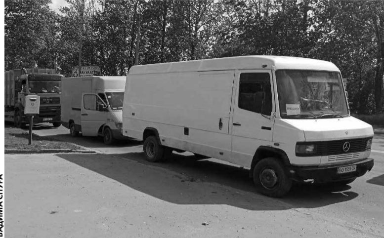
У загальних чергах за паливом ми побачили пересічних водіїв, підприємців, волонтерів та комунальників