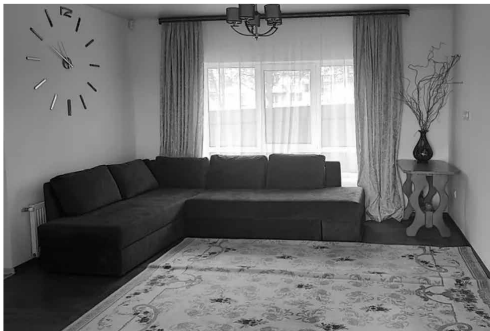
Є квартири в новобудовах, де ще ніхто не проживав. Орендодавці вказують, що це перша здача. Вартість помешкання — 10 800 грн

Орендодавців просять схаманитися та не наживатися на горі людей. Перевірки здійснюють відповідно до звернень та скарг мешканців.