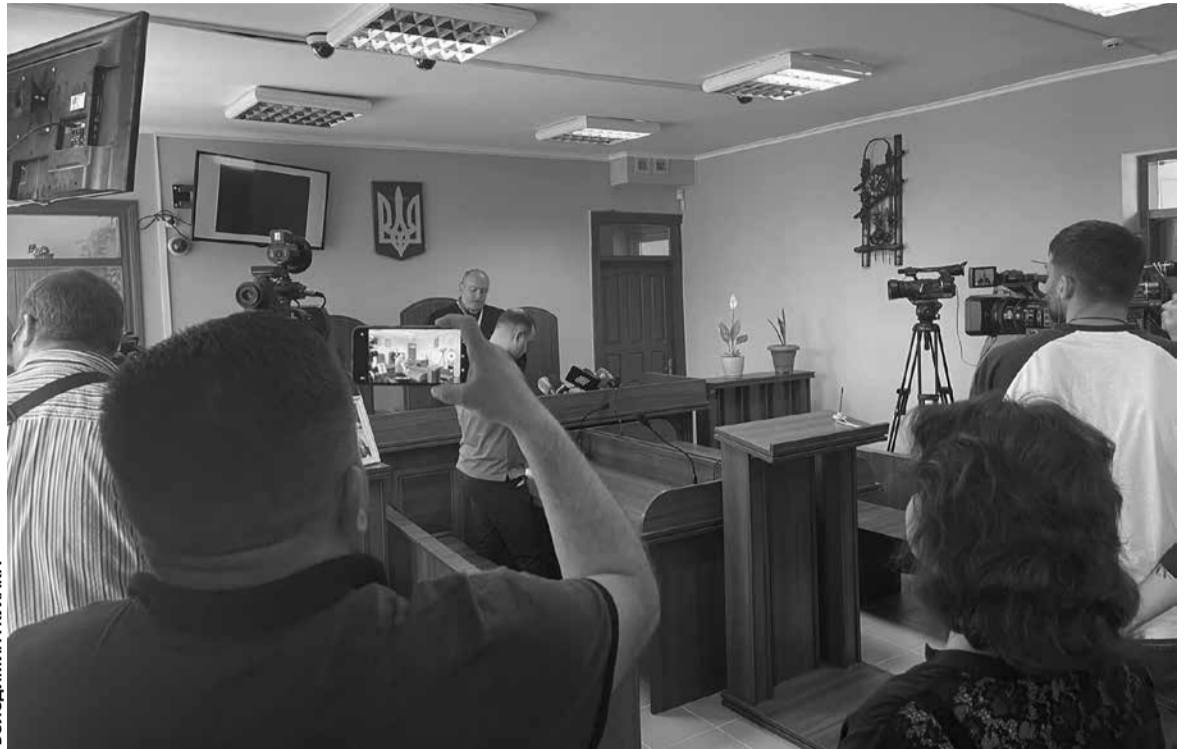
Обвинувачені так і не визнали своєї провини та не вибачились перед батьками

Хірург планує оскаржити вирок, бо вважає, що причина смерті дитини до кінця могла бути не встановлена. Він вважає, що у хлопчика міг бути не заворот кишечника, який можна було прооперувати та ліквідувати, а тромбоз.