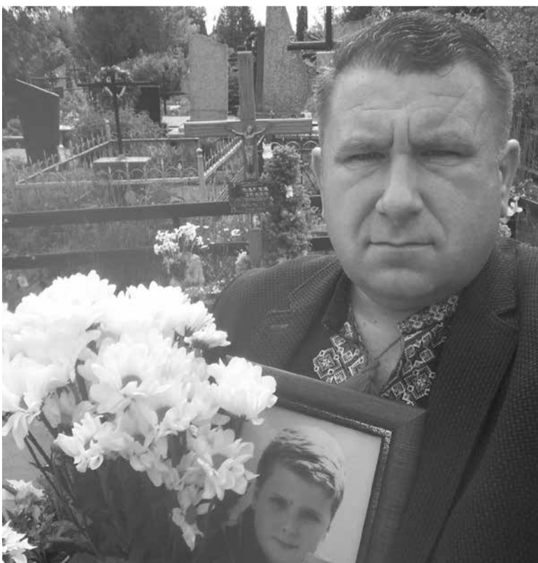
Батьки хлопчика нарешті добилися того, що лікарів визнали винними