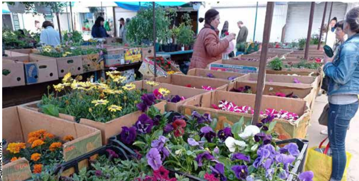
На ринку продають вже вирощені квіти у горщиках

— Краще купити універсальний грунт, щоб квітка прижилася добре. На дно горщика нічого сипати не потрібно. Можна докупити