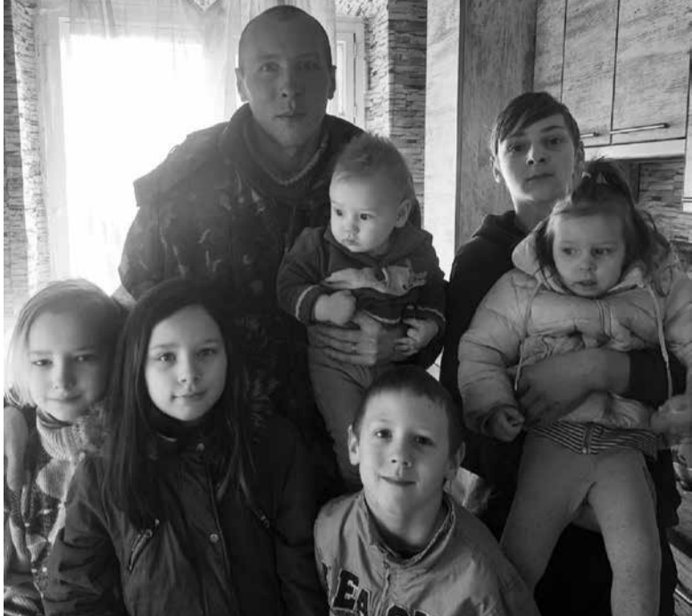
Найстаршому сину родини Доценків — 14 років, наймолодшому нема й року