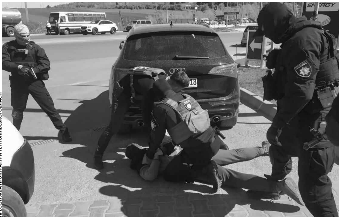
Правоохоронці затримують братів

Підозрюваного забрали в ізолятор просто із зали суду. Кло-