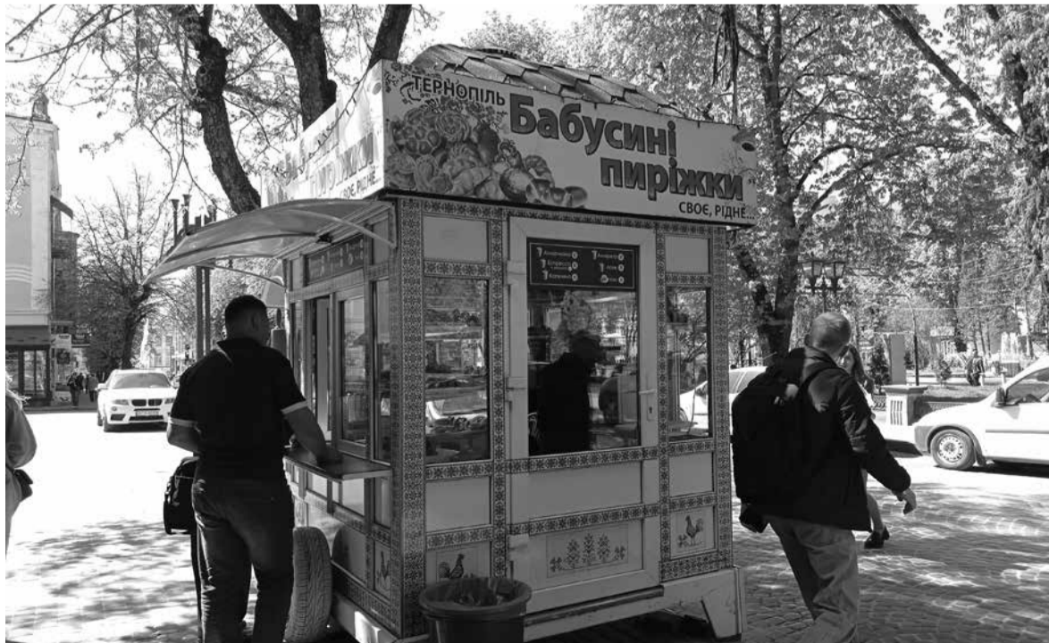
У місті є чимало МАФів з вуличною їжею – бургерами, хот-догами, паніні чи пиріжками

Є хачапурі з сиром, бринзою, м'ясом, шинкою, куркою.