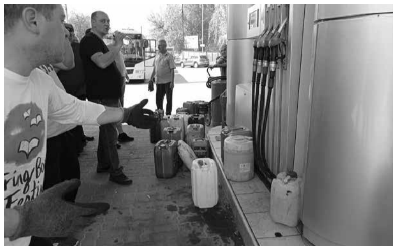
Для перевізників окрема черга. Вони заправляються в каністри, щоб привезти пальне до станцій

відбувається централізовано, тобто правоохоронці Тернопільщини не займаються закупівлями. Наразі пального вистачає, щоб здійснювати виїзди на виклики, на місця злочинів тощо. Однак у зв'язку з дефіцитом ми максимального заощаджуємо пальне. Збільшено кількість піших патрулів. Сподіваємося, що вже найближчим часом проблема дефіциту буде вирішена.