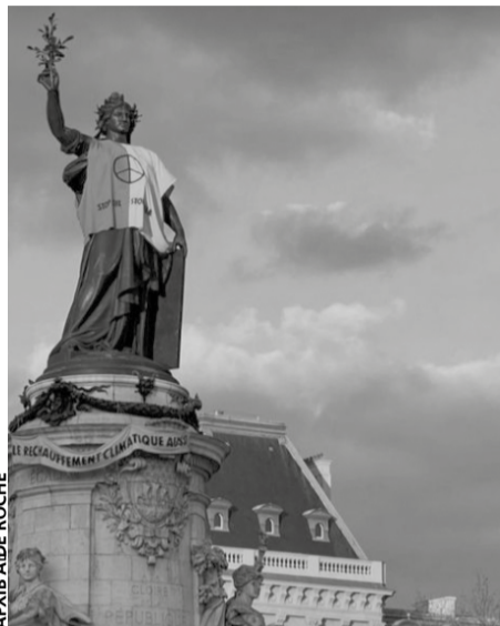
Франція підтримує Україну

— Як виникла ініціатива створити Міжнародну асоціацію вільних людей?