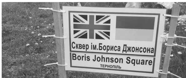
СОЦМЕРЕЖІ АНДРІЙ ГРИЦІШИН

На масиві «Східний» облаштували сквер імені Бориса Джонсона