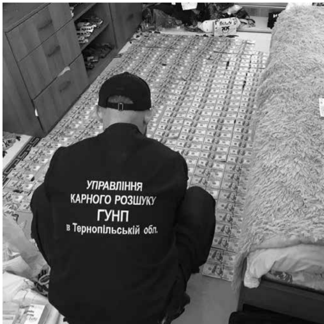
Під час обшуків вилучили 34 тисячі доларів США, майже 7 тисяч євро, понад 2 тисячі фунтів стерлінгів та більше 200 тисяч гривень