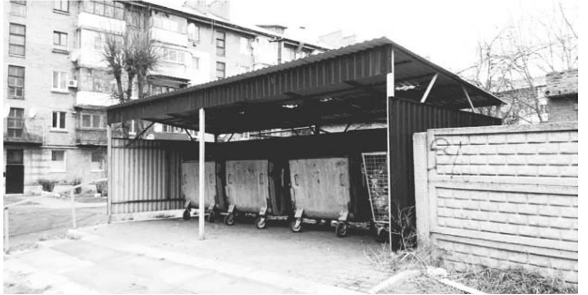
Поки що ми сплачуємо за вивіз сміття 16,30 гривні за одну людину. Скоро тариф може змінитися

Комунальне підприємство «Чисте місто» має намір ввести в дію нові тарифи за вивезення сміття. Про це повідомили на офіційному телеграм-каналі Козятинської міської ради. Із одного мешканця хочуть брати 25 гривень 60 копійок. Це стосується лише тих, хто проживає у Козятині. Про намір змінити плату за вивіз ТПВ для мешканців сіл громади поки не повідомляли.