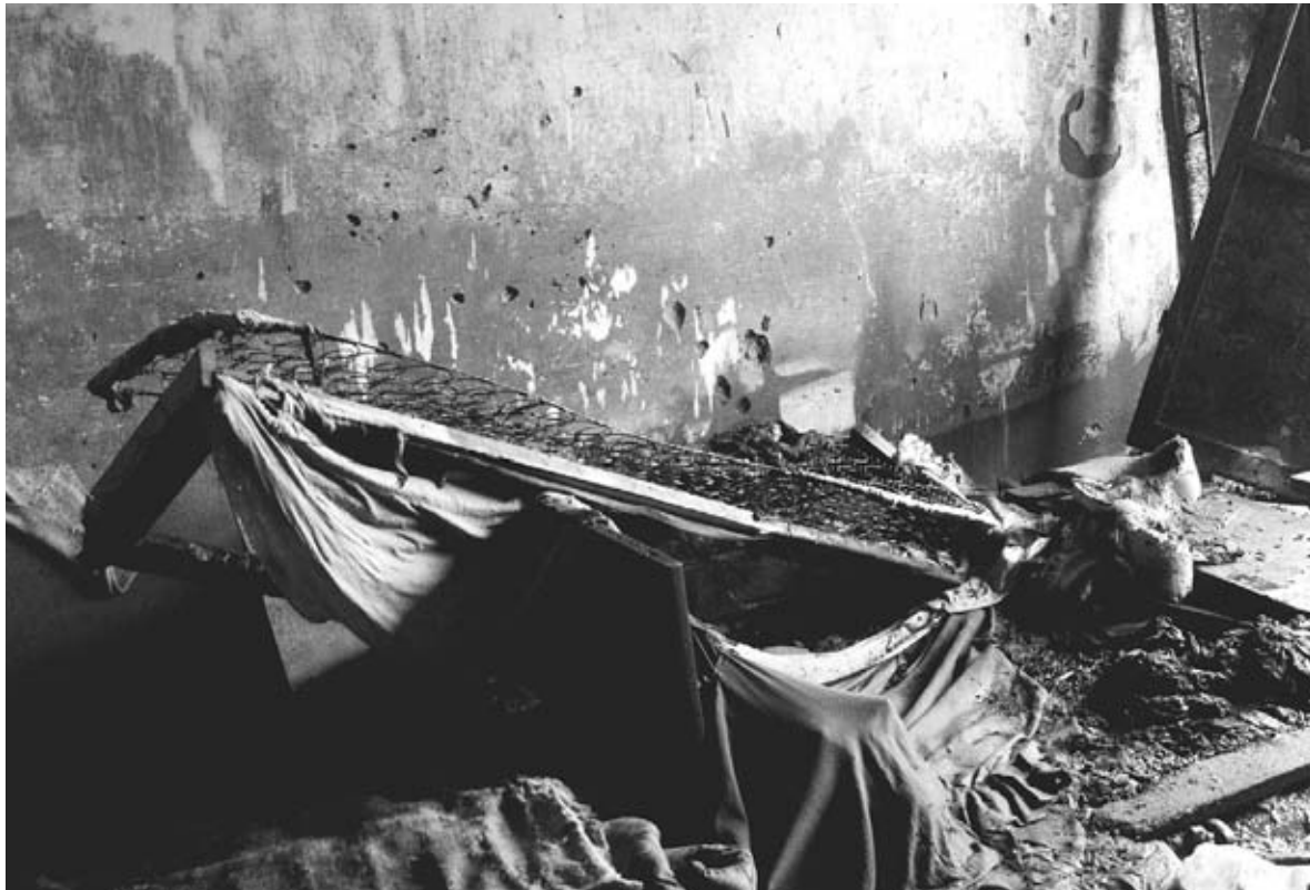
В однокімнатній квартирі добряче погосподарювало вогнище. Наш журналіст на місці події побачив обгорілий матрац, каркас телевізора без начиння, те, що колись можливо було занавісками, виглядало суцільним сплавом, стіни та стеля повністю були в кіптяві

— Ми піднімалися до квартири постраждалого в ситуації великої концентрації диму, — каже головний рятівник караулу. — На кожному сходовому майданчику, щоб зменшити концентрацію диму, спробували відкрити вікна. Тільки вони були наглухо забиті цвяхами. Нічого не залишалося, як вибивати з віконних рам скло. Адже від сильного задимлення могли постраждати інші мешканці під'їзду. Коли піднялися на 4 поверх і зайшли в квартиру, то навпомацки нащупали постраждалого і винесли його на вулицю. До приїзду екстреної медицини пробували реанімувати чоловіка. Коли швид-