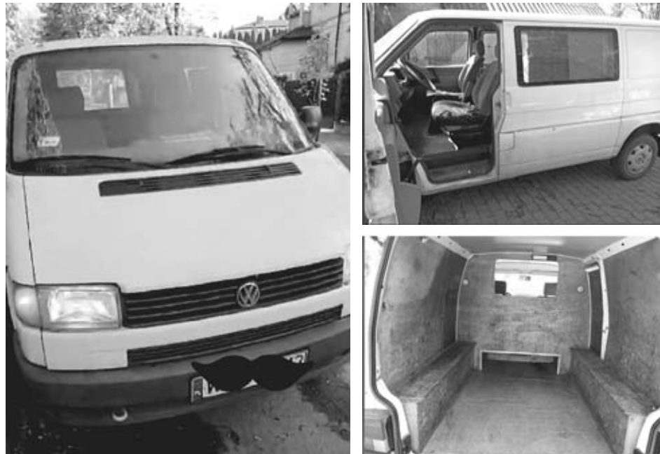
Козятинці підібрали та придбали в Польщі гарний варіант, мікроавтобус Volkswagen четвертого покоління. Потрібно розрахуватись за авто, пригін та оформлення

Реквізити: ПриватБанк 5168 7451 0016 6906 Монобанк 5375 4141 2137 5074 Сиваківський