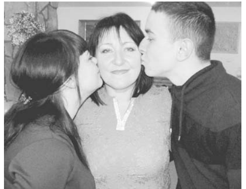
Сім'я для Діми була на першому місці. Він завжди піклувався про маму і сестер

бусі вирішили не розповідати, бо не знали, як вона це переживе. Вона дуже любила Діму, винячила його з маленького, віддала йому практично все своє життя. І Діма любив бабусю, на-