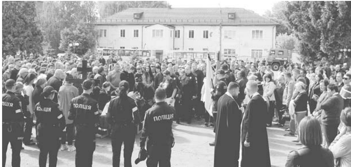
На площі лунає «Пливе кача». Попрощатися з Героєм прийшла величезна кількість людей