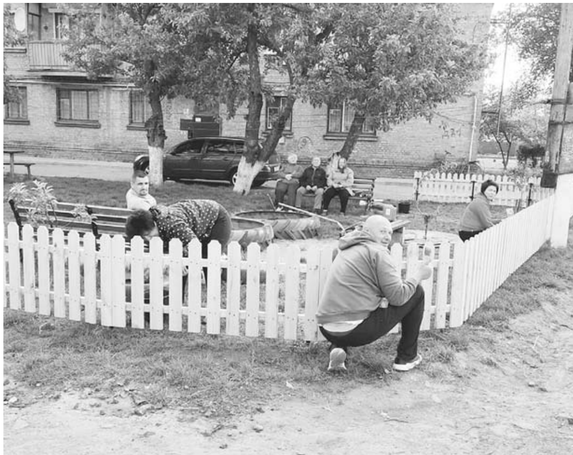
Тепер діти в пісочниці можуть гратися безпечно. Та й для людей старшого віку є де присісти

— ОСББ виділило кошти на дерево. Матеріал ми завезли до знайомого і він з нього зробив штахети. Ми купили стовпчики,