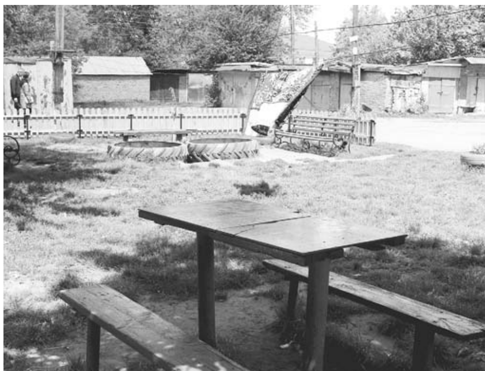
Місцеві мешканці навели лад на майданчику. Мають ще багато планів