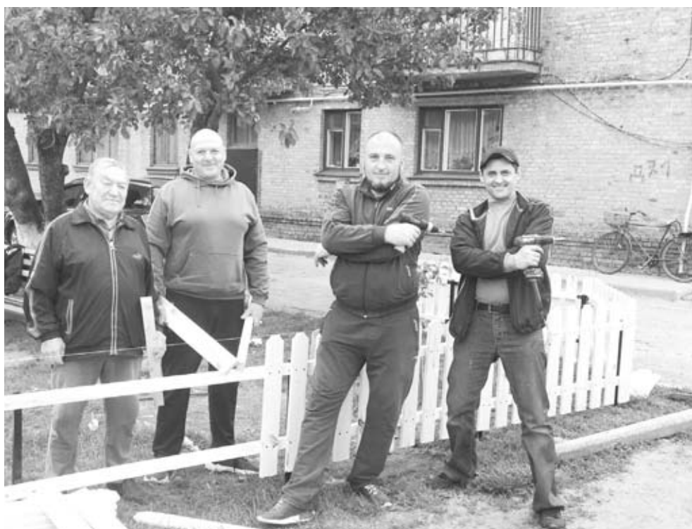
У перерві між роботами. Голова ОСББ 8-ої Гвардійської 71/73 з сусідами ставлять паркан, щоб на дорогу не вибігали діти