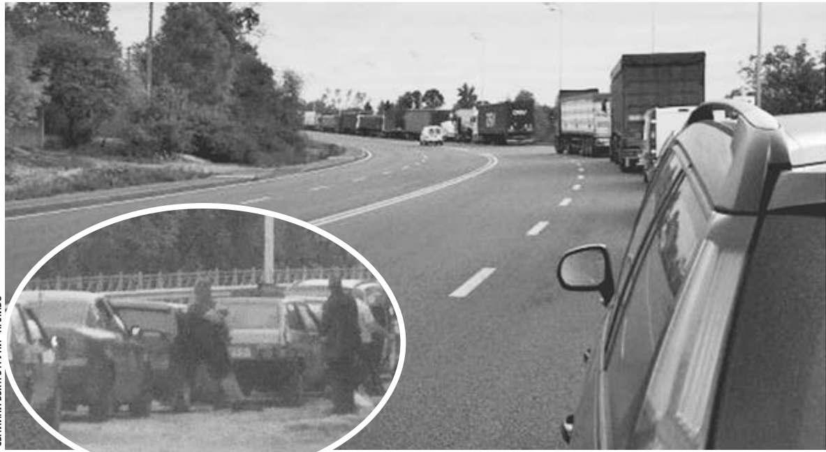
На фото черги на заправках у Козятині та Махнівці

— Потрібно було заправити автівку, бо у вихідні планували