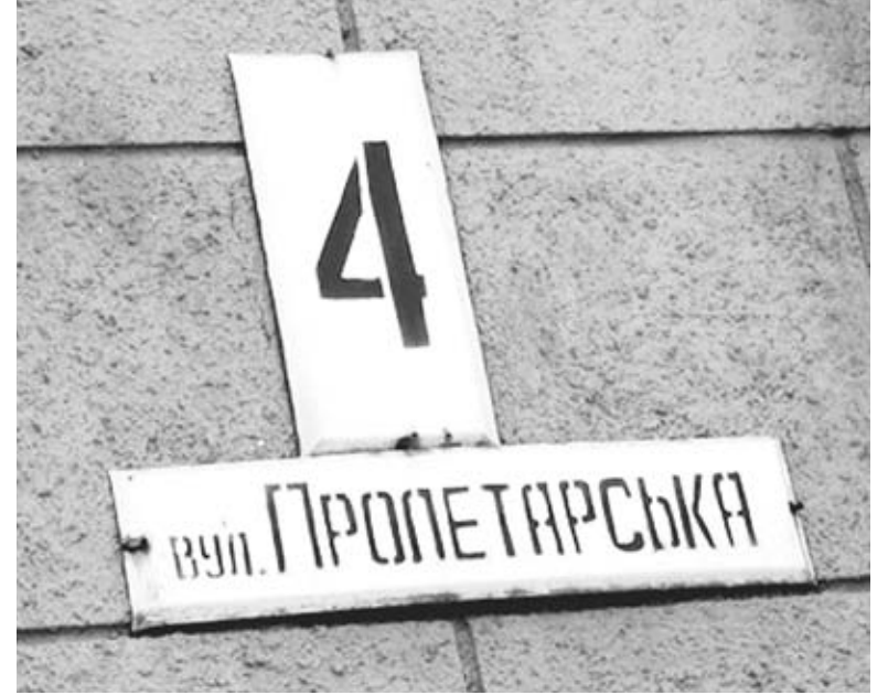
Пролетарська — досить типова назва для радянської доби. Пролетарі були складовою комуністичної ідеології. Фото ілюстративне

Окрім Пролетарської, у Козятині заховався ще й провулок Тарашанський. Його назва також