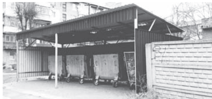
ХОЧУТЬ ПІДНЯТИ ПЛАТУ ЗА ВИВІЗ СМІТТЯ