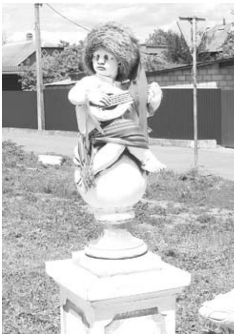
На голову янгола одягли козаку шапку. А на руках у нього зав'язали жовто-блакитні стрічки