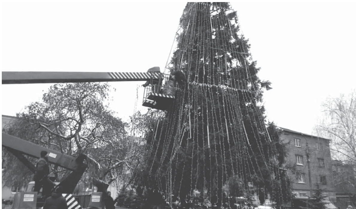
Минулого року ялинку почали готувати 15 грудня. Тоді її прикрашали не лише іграшками, а й святковою ілюмінацією.

Додамо, що у Вінниці, так само, як і в Києві, встановлювали штучну ялинку і витрачали на це чималі гроші. Натомість у Козятині щороку прикрашають живу ялинку і коштує це нашому бюджету в рази дешевше. До прикладу, торік зелену красуню ошатно вбрали ще 15 грудня, втім відкриття ялинки відбулося вже після Дня святого Миколая — 22 грудня. Окрім ялинки, на площі були фото-зони та вертеп, а для юних козятинчан провели розважальну програму. Зрозуміло, що в умовах повномасштабної війни подібних заходів влаштувати не будуть, та чи прикрасять головну ялинку міста іграшками? Із цим питанням ми звернулися до Світлани Рибінської, начальника відділу культури.