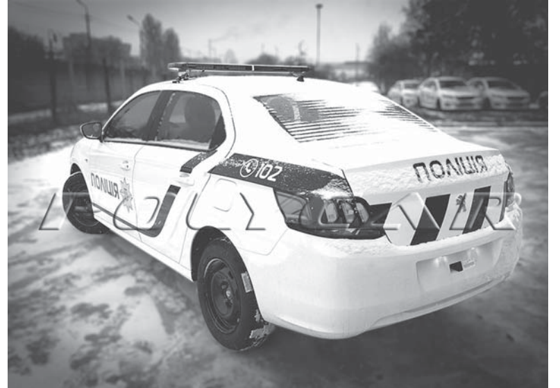
Поліцейські автопатрулі дублюватимуть сигнал «Повітряна тривога» та «Відбій повітряної тривоги»

ліцейські автомобілі. У кожного співробітника є аудіозапис, де оголошується і «Повітряна тривога», і «Відбій», яку вони можуть увімкнути, якщо буде така необхідність. Також слід додати — по громаді гучномовці є у Махаринцях, у міській раді і стаціонарний гучномовець у ДСНС. Якщо і відбуваються планові чи аварійні відключення електроенергії, то по черзі. Гучномовці є і вони можуть частково працювати. Наголошуємо — дублювання поліцією сигналу тривоги буде в разі екстреної необхідності.