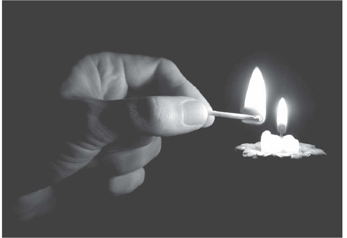
Щодня у нас вимикають світло по декілька разів на добу. І графіки постійно змінюються

«Контрольовані обмеження споживання, які вводить диспетчерський центр Укренерго, а реалізовує конкретне обленерго у вигляді списку споживачів, яких відключають на певний час, потрібні якраз, щоб блекату не було. У нас є проблема з достатністю генеруючих потуж-