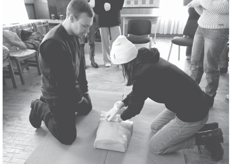
Щоб робити компресію грудної клітки, треба не лише правильно тиснути, а й правильно сісти. Коліна треба розставити, а гомілки мають утворювати трикутник