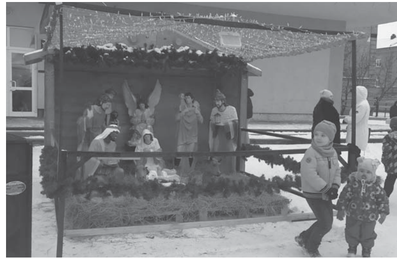
Такий вертеп зробили на площі торік. Цьогоріч ми знову його побачимо.

— Зрозуміло, що діткам треба позитиву, тому невеликі локальні заходи в гуртках і маленьких колективах будуть. Але збирати дітей у великій кількості ніхто не буде, — підсумувала Світлана Рибінська.