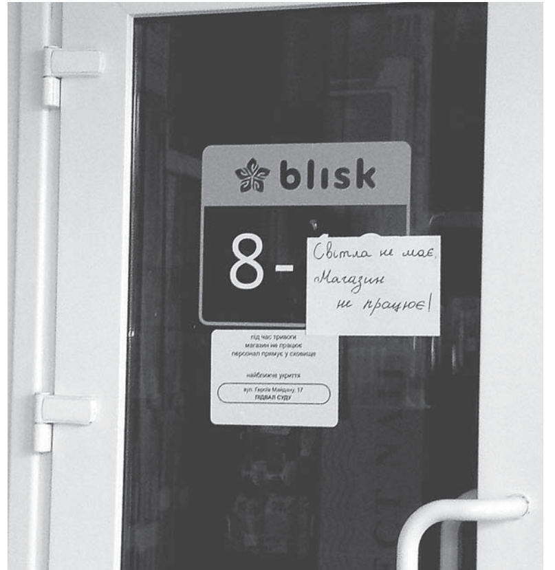
Деякі магазини одразу вішають на двері табличку, що не працюють без світла. Втім є чимало таких, які обслуговують покупців навіть без генераторів

Наша наступна зупинка — м'ясний магазин навпроти суду. У залі темно, але двері відчинені.