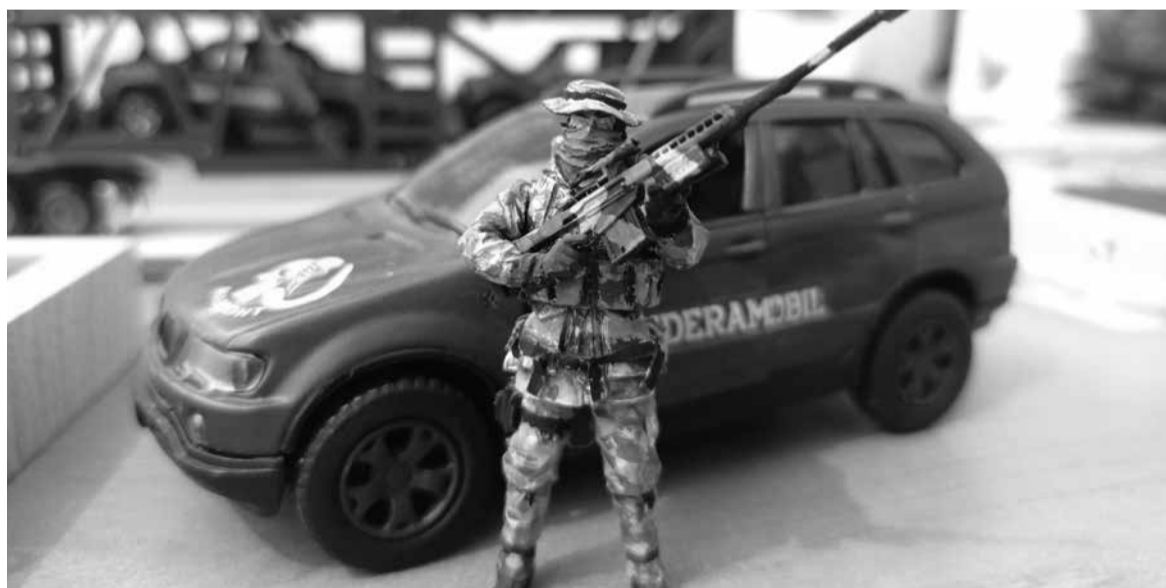
Усі машинки та діорами – ручної роботи

– Ці пристрої можуть допомогти запобігти травмам, пов'язаним із холодом, і підвищити моральний дух наших відважних солдатів, – каже Євген Лоза. Просимо допомогти нам фінансово, аби ми мали можливість виготовити їх для наших воїнів