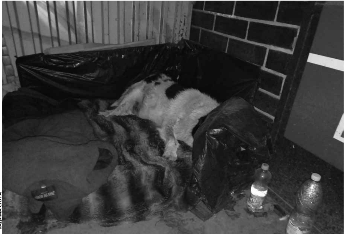
Біля «лежанки» стоять миски з водою, яку наливають небайдужі

Увечері, коли стало холодно, ми повернулися на зупинку. Пес вже спав на своєму місці. Ми знову побачили свіжу воду, яку хтось долив у миску. На «гостей»