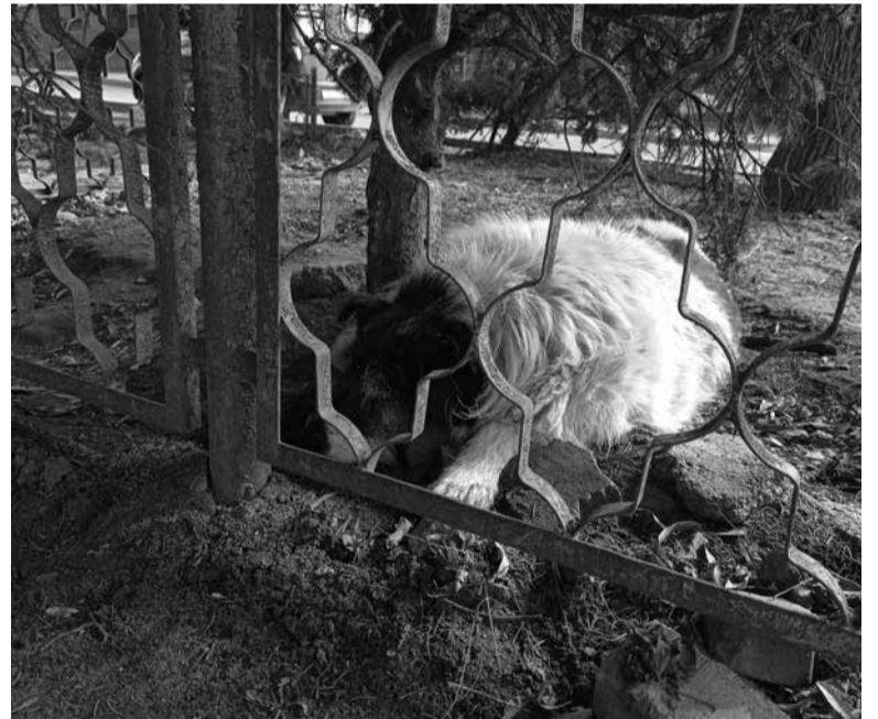
Місцеві кажуть – пес спокійний і про нього дбають

Біля багатьох будинків у місті можна бачити такі «пункти обігріву» для безпритульних собак. Чимало їх у районі «Централь-