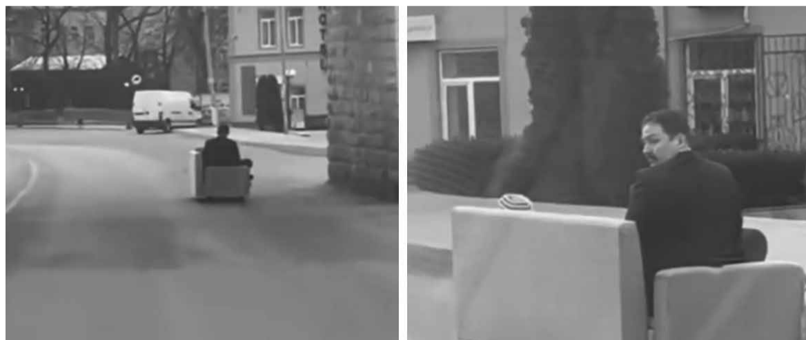
У Заліщиках чоловік їздив на дивані з дитиною проїжджою частиною. Тримався правого краю дороги

Стаття збрала 86 коментарів. Публікуємо найцікавіші коментарі, зберігаючи орфографію дописувачів.