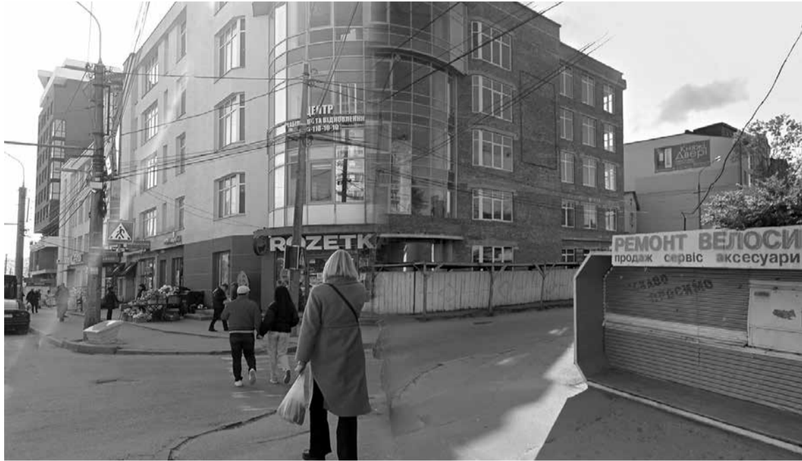
Вулиця Митрополита Шептицького названа на честь предстоятеля Української греко-католицької церкви. Тут є чимало різних магазинів, аптек та торгових центрів. Всього за кілька років побудували чимало нових будівель

Стаття збрала 21 коментар. Публікуємо найцікавіші коментарі, зберігаючи орфографію дописувачів.