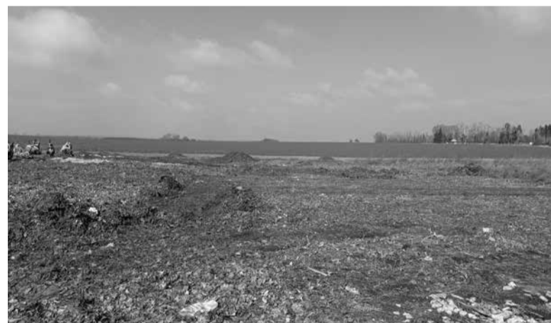
Місце, де мають перепоховати останки військових, розташоване на краю цвинтаря, заросле бур'янами

— Перенесення існуючих братських могил можливе, але це досить складна процедура, — каже він. — Необхідно зібрати чимало дозволів, документів. Міськвиконком може затвердити таке рішення та доручити проведення цих заходів управлінню, у даному випадку — ЖКГ. Ексгумацію та перепоховання дозволяє Закон України. Однак тут є і інша сторо-