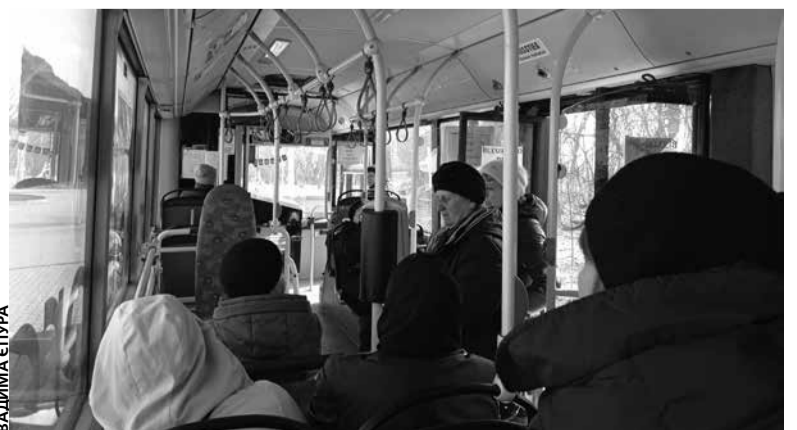
До кладовища курсує низькопідлоговий автобус МАН

Також можна здійснити пересадку. Якщо ви приїхали з іншого мікрорайону — впродовж пів години від моменту видачі квитка ви можете пересісти до будь-якого іншого автобуса чи тролейбуса, показавши водієві квиток з часом.