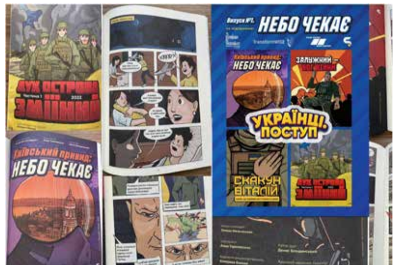
Серія коміксів має 54 сторінки