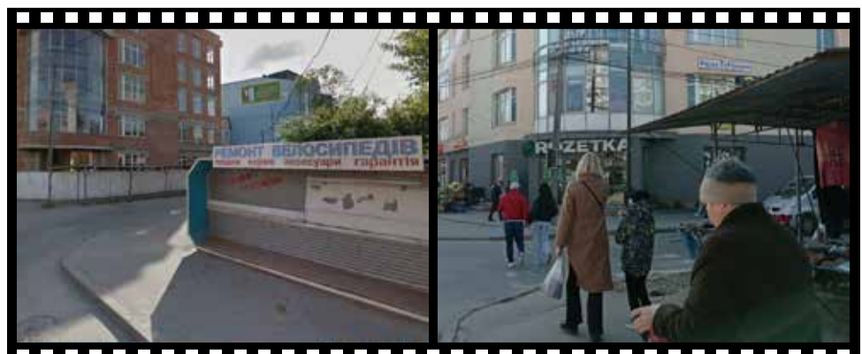
БУЛО: У одному з будинків було відділення банку