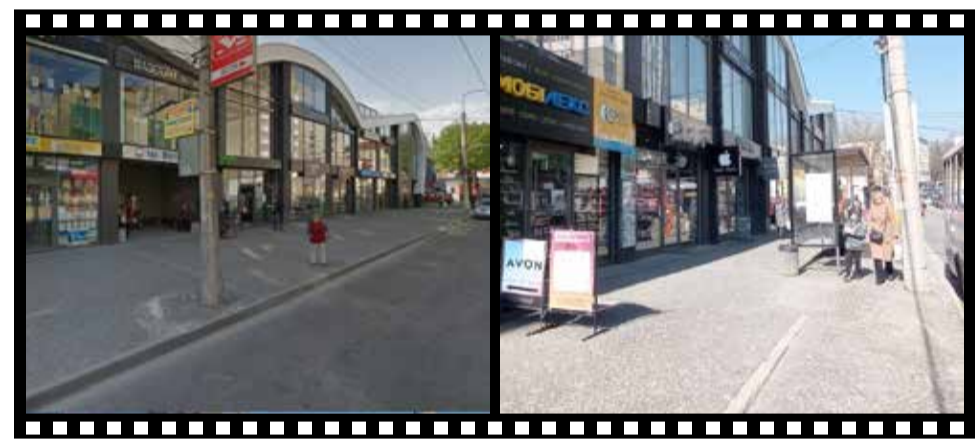
БУЛО: Раніше зупинка була всередині торгового приміщення