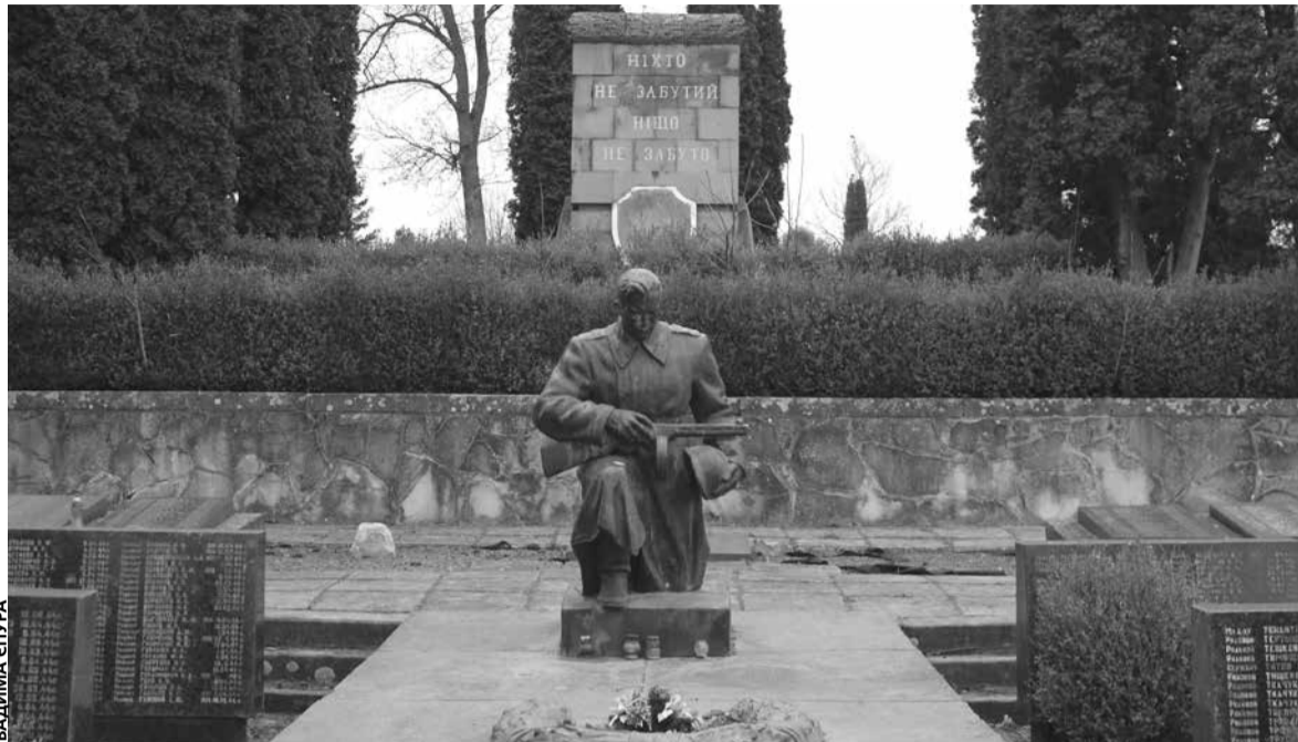
Меморіал та братська могила на Микулинецькому розташована на центральній алеї

— Цього сектора ще немає, його поки тільки формально «нарізали». Зараз є тільки сектор № 31 на краю кладовища, там вже почали ховати людей, а поруч має бути № 32. Там ще немає позначок, тому їх важко знайти, — розповів працівник кладовища.