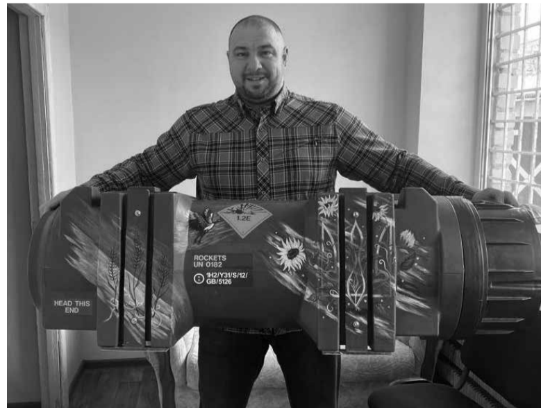
Розмальовані тубуси продають за десятки тисяч гривень