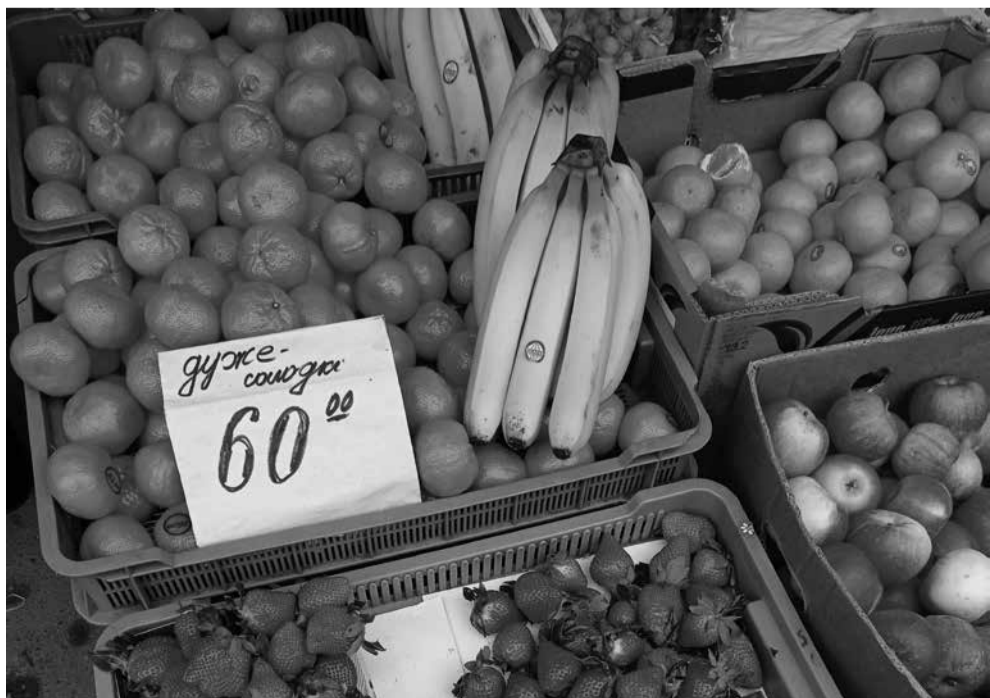
На ринку вже можна купити полуницю