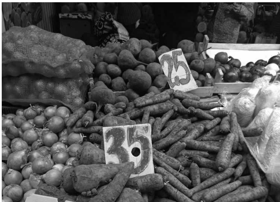
Дорожчає не лише цибуля, а й морква