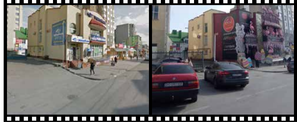
БУЛО: На перехресті Шептицького-Торговиці були магазини