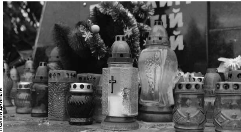
Тернополяни приносять квіти та свічки до могил