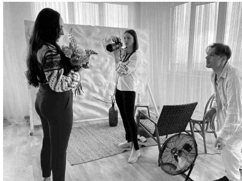
Щоб фото були вдалими, підготували яскраві атрибути та залучали додаткову техніку