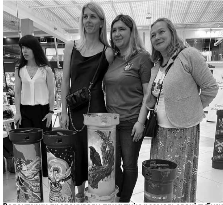
Волонтерки пропонували присутнім розмальовані тубуси

— Ми запросили діток розмальовувати саме гільзи не випадково. Хочемо показати, як речі, які несуть біль та страх, можуть бути гарними і приносити користь. Бо ці розмальовані гільзи ми віддаємо на аукціони за кордон і таким чином збираємо