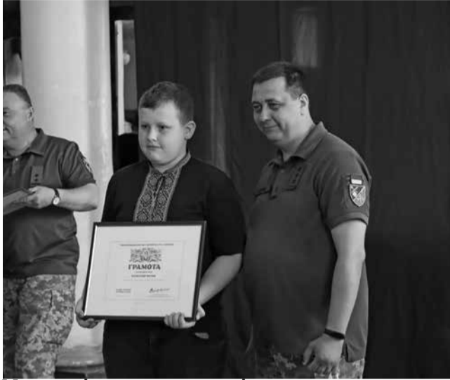
Маленькі волонтери по-різному допомагали українській армії у час війни