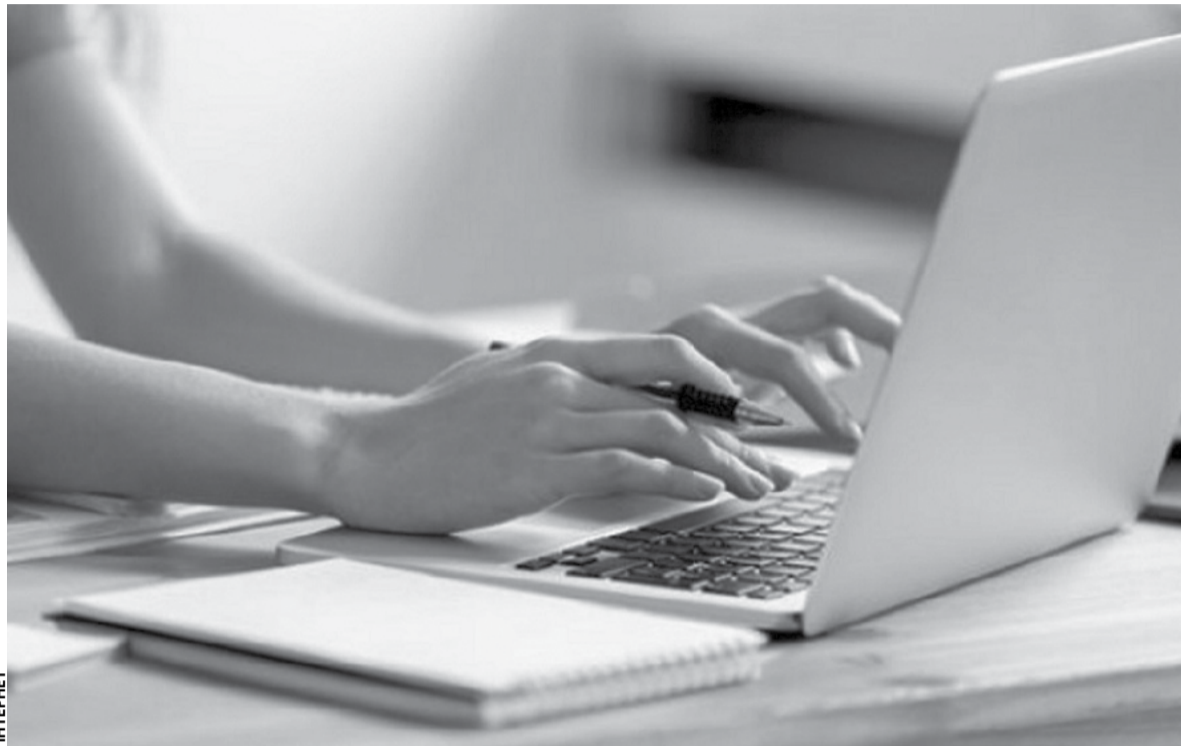
На Тернопільщині майже 9 тисяч учасників цього року зареєструвалися на мультипредметний тест

— З міркувань безпеки ми не публікуємо інформації про те, де на території України відбуваються тестування, ні на сайтах Українського та регіональних центрів оцінювання якості освіти, ні на наших офіційних сторінках у соцмережах, — повідомили у центрі оцінювання якості освіти. — Наполегливо ре-