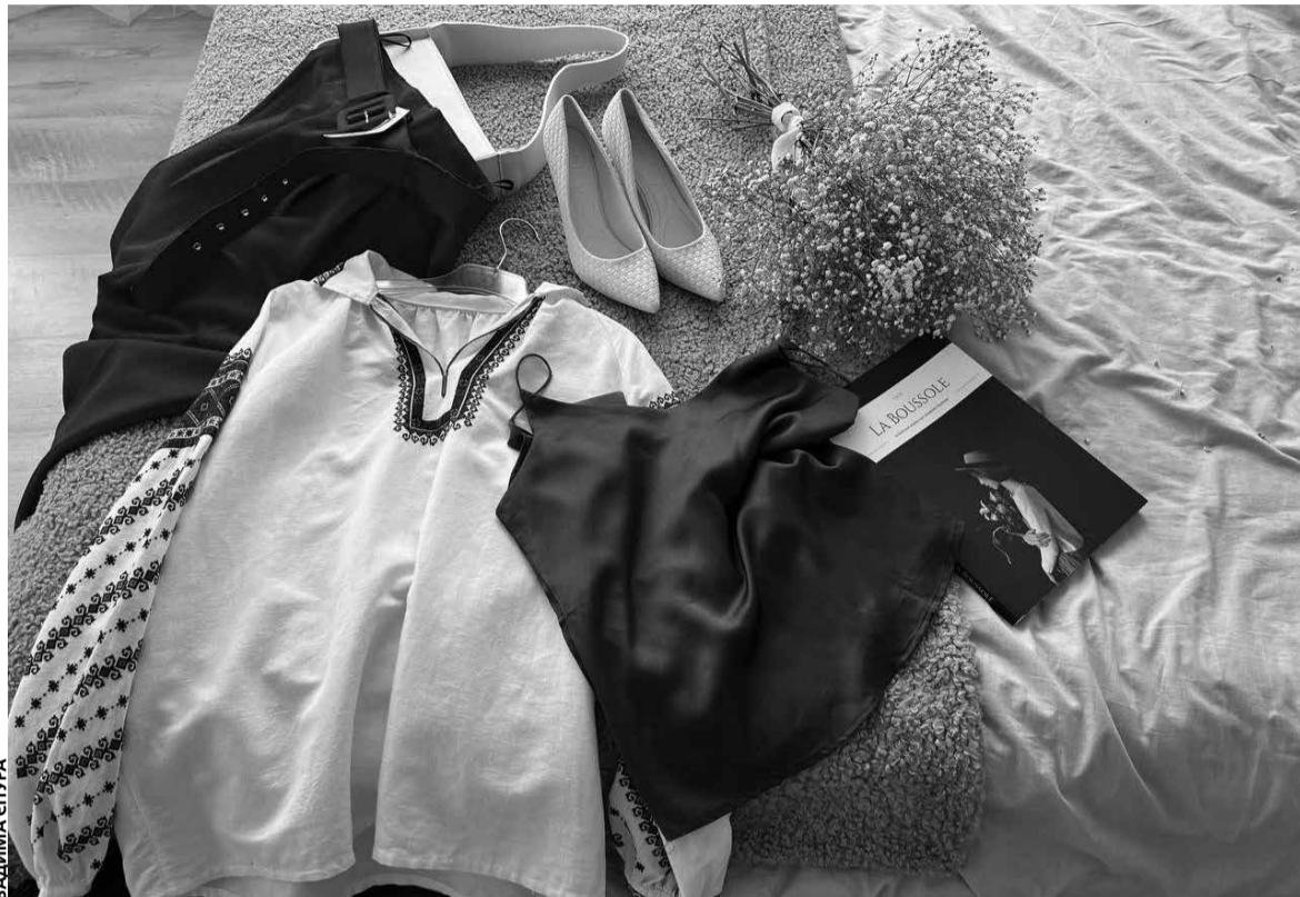
Кожен учасник мав принести вишиванку, а далі стилісти підбирали образ

траур. Ось саме ця сорочка пов'язана з цими подіями. Гляньте, вона створена з конопляного полотна і вовняними нитками