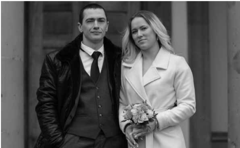
Через два місяці після весілля захисник загинув, а Людмила стала вдовою

— Ми були неймовірно щасливими. Між нами так і залишиться справжнє кохання. Пам'ятаю, як він просив, щоб я народила йому дитину. Але я відтермінувала, завжди казала, що під час війни мені страшно народжувати. Ми хотіли, щоб у нас було тихе родинне життя, щоб була власна справа. Для нього родинний затишок і тепло завжди були на першому місці. Завжди оберігав свою мамусю, мене і мою донечку. Я вдячна йому за все, за щастя і всі миті разом, — зізнається дівчина.