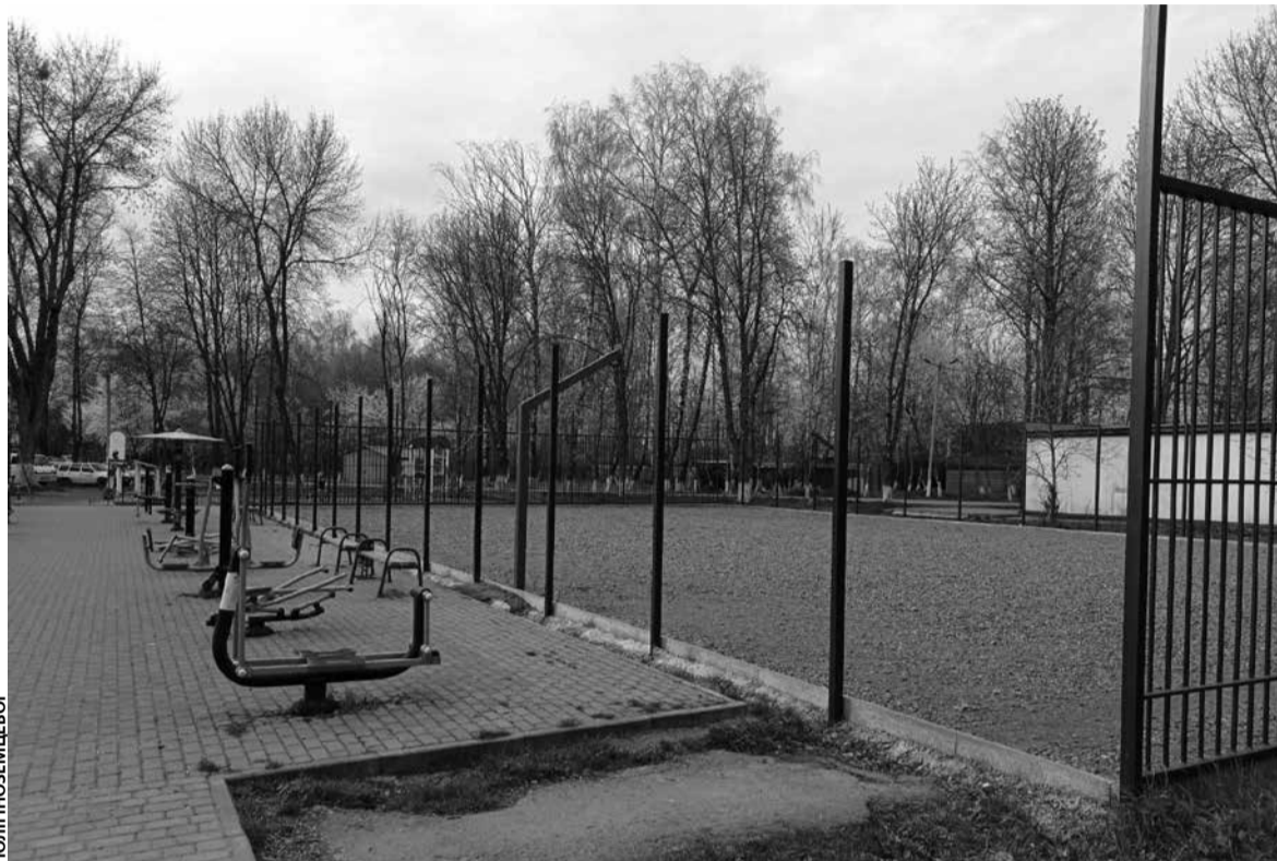
У квітні на локації почали будувати основу для огорожі

Як свідчать дані сайту державних закупівель, допис «Капітальний ремонт спортивного майданчика за адресою вулиця Новий Світ, 95 в м. Тернополі» оголосили і відразу завершили 14 квітня 2023 року. Процедура проходила без використання електронної системи. Замовником виступило Управління житлово-комунального господарства, благоустрою