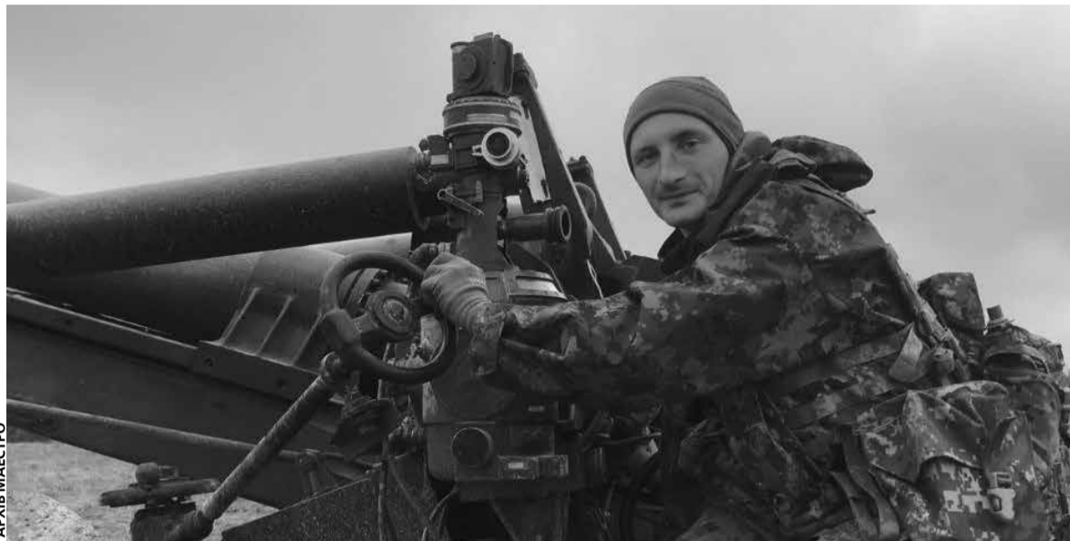
В'ячеслав став артилеристом у 24. Спершу — номером обслуги, а згодом йому запропонували підвищити кваліфікацію: вивчитися на навідника

— Гармата при роботі розкручується від вібрації, — каже В'ячес-