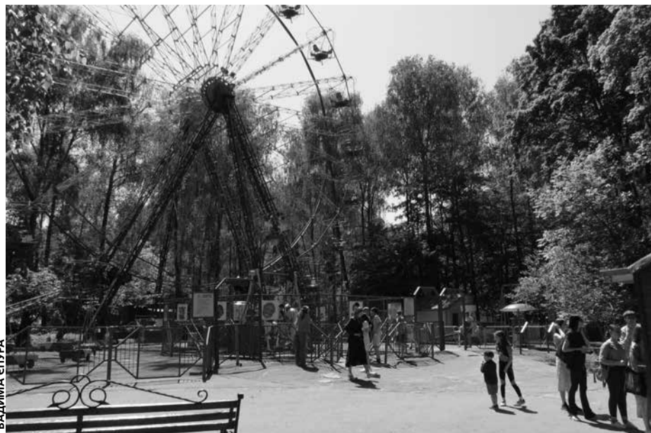
Всі атракціони пройшли перевірки

Вартість циклу катання (5 хв) на колесі огляду - 40 грн. Діти до трьох років обслуговуються безкоштовно.