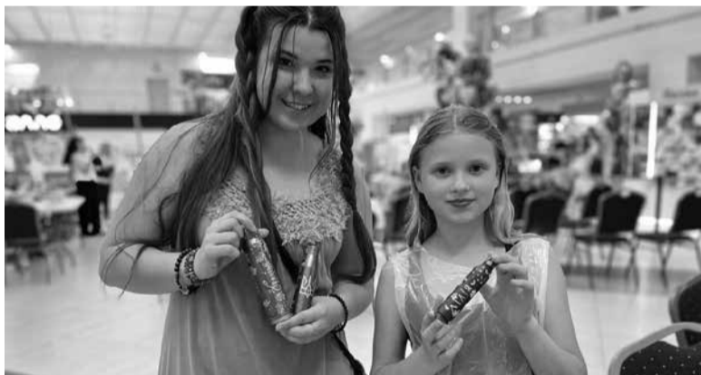
Для дітей влаштували безоплатні майстер-класи з розписування гільз

не зупинятися і закликають майстрів Тернополя та Тернопільщини долучатися до благодійного заходу. Не варто бути байдужими у той час, коли хлопці гинуть за нашу свободу.