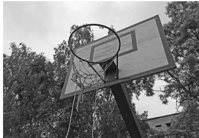
У баскетбольних кільцях сітка також порвана

майданчик є доріжки, викладені бруківкою. Стоїть дві лавочки — пофарбовані у жовтий колір, із синім низом. Фарба на них злущилася, потьмяніла, а дерево сильно потріскалось. На металі і на дошках написи. Помітно, що лавочки давно не оновлювали. Біля них встановлені смітники, розписані коректором. Крім них на сміття поставили ще два пластикові відра. На огорожі висловлювання — не завжди цензурні.