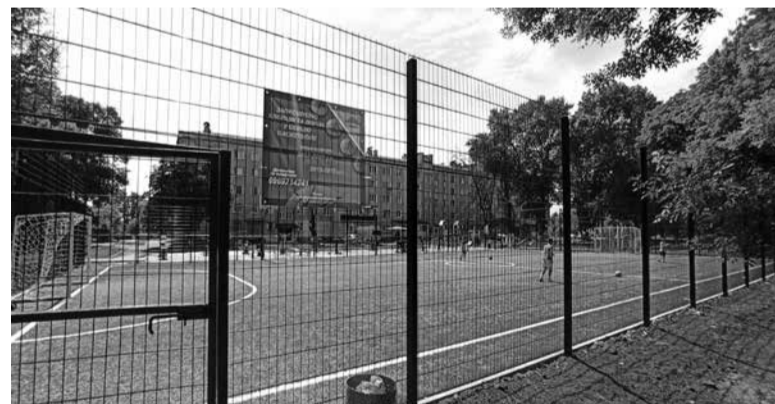
Майданчик вже активно облюбували маленькі спортсмени