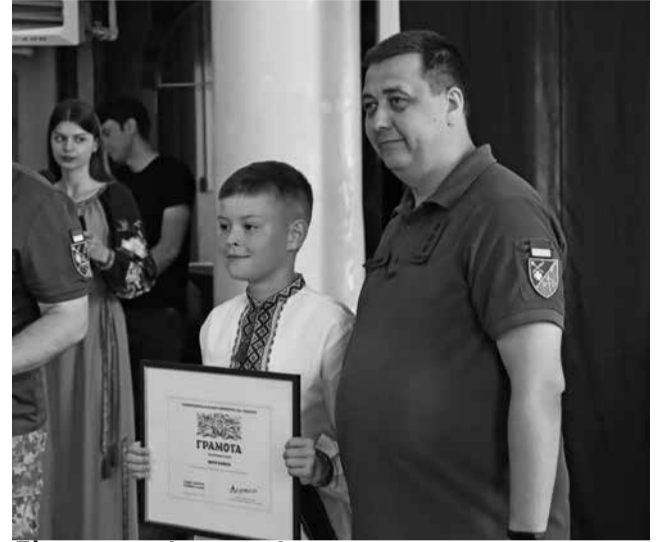
Діти охоче фотографувалися з грамотами та подарунками

Визнання ■ У Драмтеатрі 8 червня нагородили дітей із Тернопільщини, які у час повномасштабної війни допомагають українській армії та зробили щось вагомим. Військові подякували малечі за їхню дорослу позицію і вручили грамоти від Головнокомандувача ЗСУ Валерія Залужного. Історії маленьких волонтерів та як пройшло дійство – у матеріалі