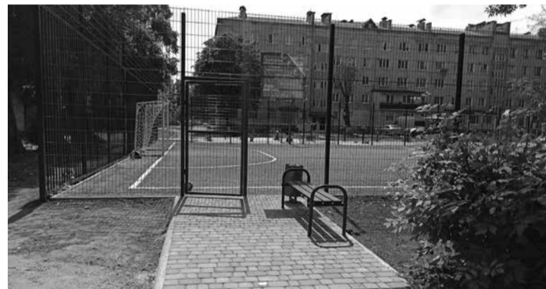
Біля обох входів на майданчик виклали доріжки з бруківки

До слова, це вже 41 спортивний майданчик, який облаштували у Тернополі. Переглянути всі спортивні локації у Тернополі можна на інтерактивній карті спортивних майданчиків.