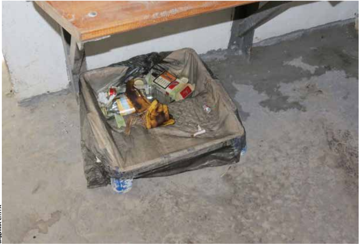
На проспекті Бандери в укритті було багато сміття

Підлога була брудна. Там були потьокки та сліди калюж. Сміття майже не було. Неприємного запаху ми теж не помітили.