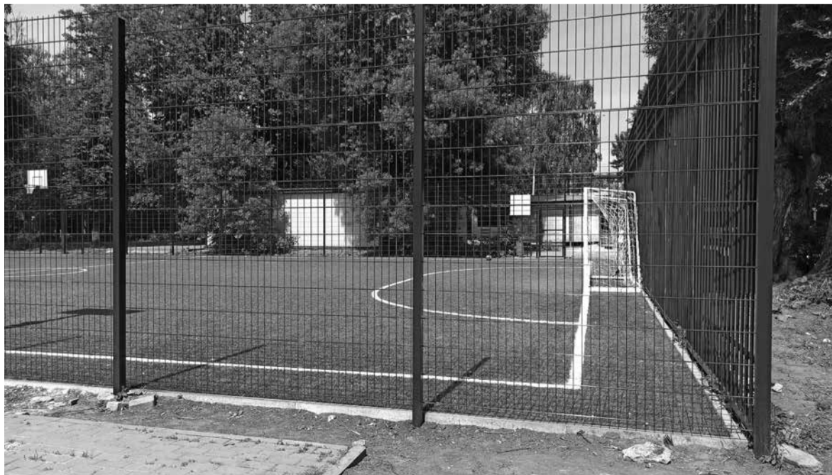
На оновленій ділянці облаштували сучасне футбольне поле