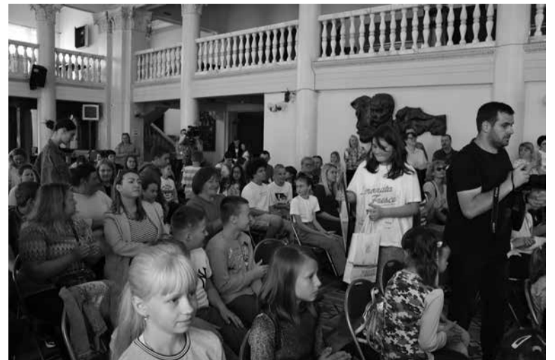
На другому поверсі театру 8 червня було людно – малеча прийшла з батьками

– У нас вдома є велика плантація цієї ягоди. Станіслав якось