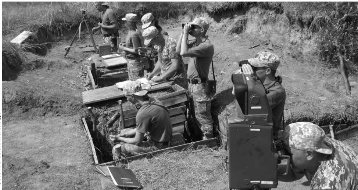
Навчання у центрі підготовки офіцерів запасу студенти ЗУНУ проходять два роки

Військова освіта та професійна військова освіта — два різні поняття. Аби майбутні студенти не плутали і обирали дійсно те, що їм до вподоби, Міністерство оборони України надає чітке роз'яснення. Якщо говорити про військову освіту, то це формальний вид. Її можна здобувати одночасно з профільною середньою, професійною (професійно-технічною), фаховою передвищою чи вищою освітою. Крім того, ви можете отримати послуги з підготовки офіцерського складу в системі багаторівневої професійної військової освіти, без здобуття вищої. Фахівці надають освітні послуги