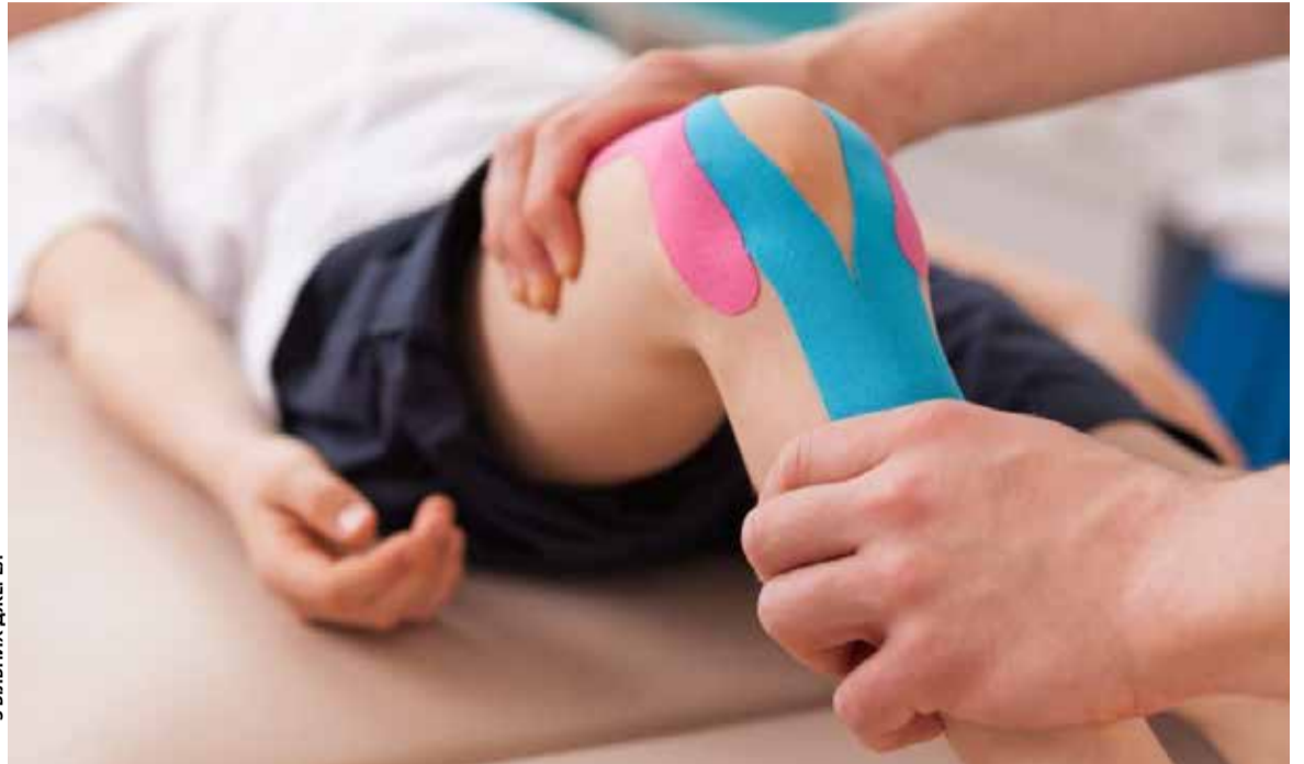
Лише за рекомендацією лікаря можна брати спеціальне взуття. Крім того, медики не радять доношувати його після когось

А 29 червня о 13.00 — зустріч із дитячим ортопедом, профілактичні поради від справжніх професіоналів. Поради педіатра: як спланувати режим дня.