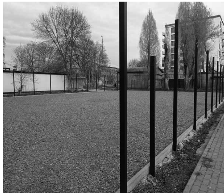
Раніше на спортмайданчику не було покриття, а лише щербини