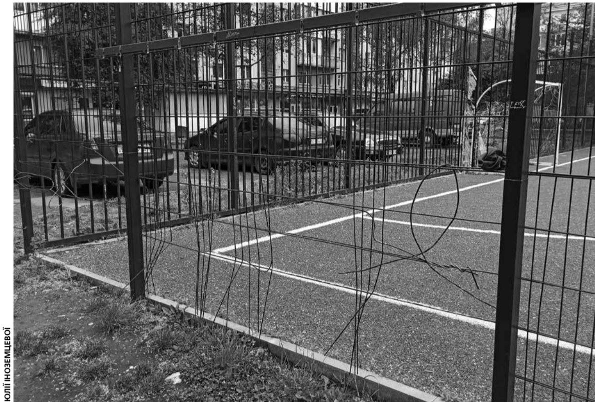
Металева огорожа по всьому периметру зламана і дротів не вистачає

На запитання, куди звертатися тернополянам, якщо майданчик