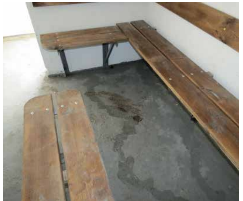
Підлога в захисній споруді біля Кооперативного коледжу була брудна