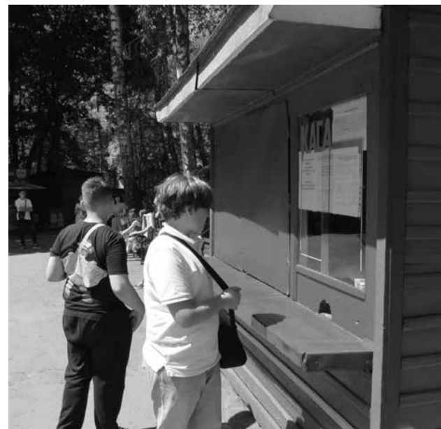
Цикл катання на колесі огляду — 5 хвилин