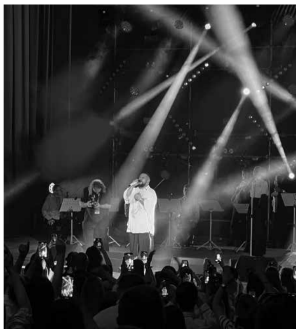
На концерті Монатіка на сцену вийшов тернополянин з букетом троянд, який освідчився своїй коханій та запропонував одружитися