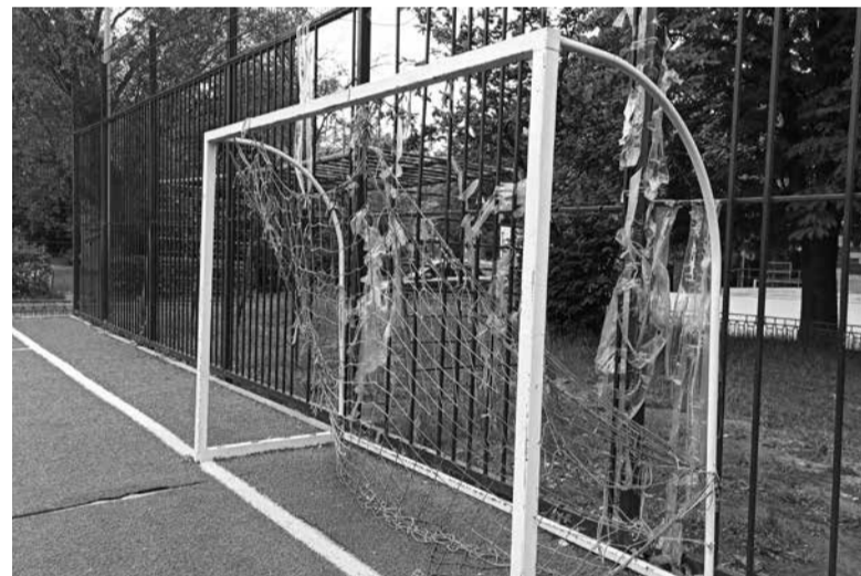
Сітка на футбольних воротах порвана і ледве тримається