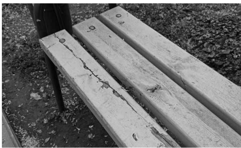
Встановлені біля майданчика лавки потріскалися і на них облущилася фарба

Про це говорять і мешканці прилеглих будинків. Під час відвідин локації 12 червня наша журналістка зустріла на місці пенсіонерку Ганну. Жінка живе