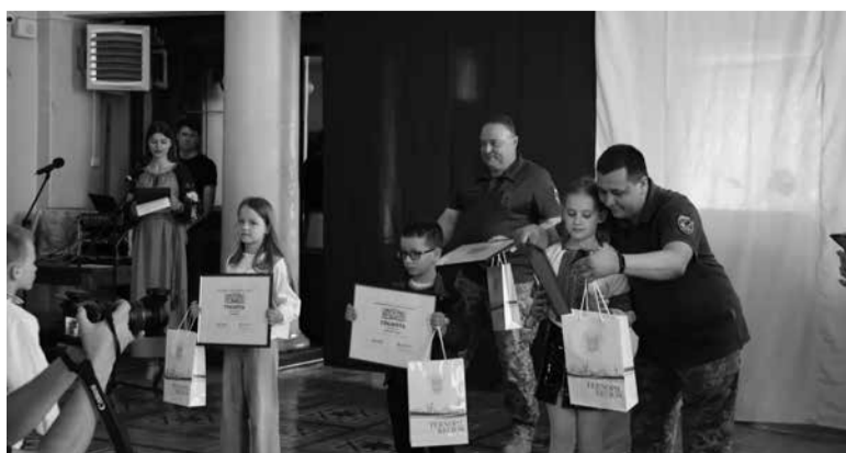
Військові нагородили юних волонтерів грамотами від Головнокомандувача Збройних сил Валерія Залужного

Після завершення святкового дійства дітей розважали аніматори – Пес Патрон та Україночка.