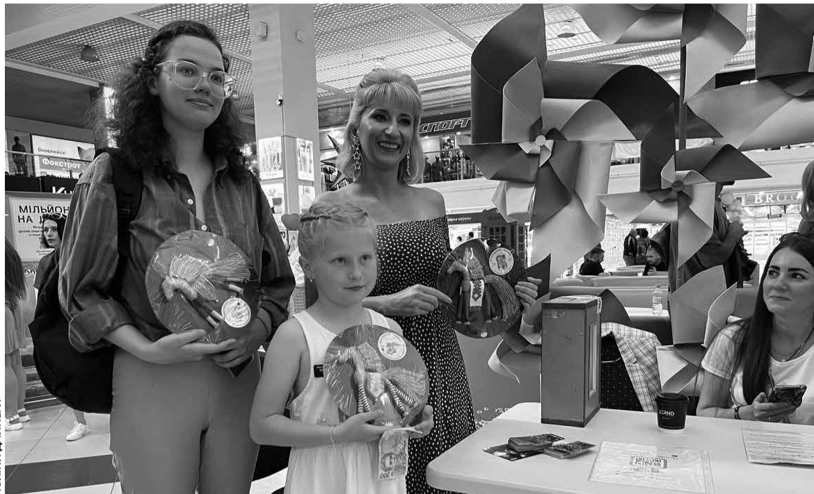
Дівчата викупили під час аукціону коніків, які скачуть до Перемоги

Кам'яну карту України продавали за 2500 гривень, а кофту з підписом Валерія Залужного за 10000 гривень. Активно присутні у залі тернопільяни купували солом'яних коніків,