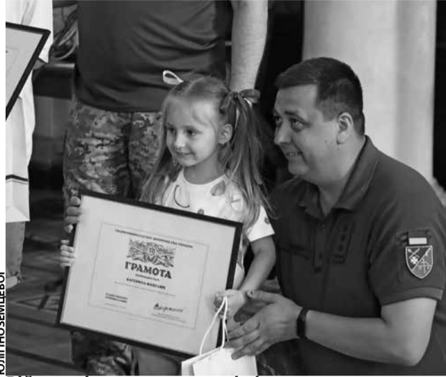
Військові вручили малечі відзнаки та з кожним зробили спільне фото