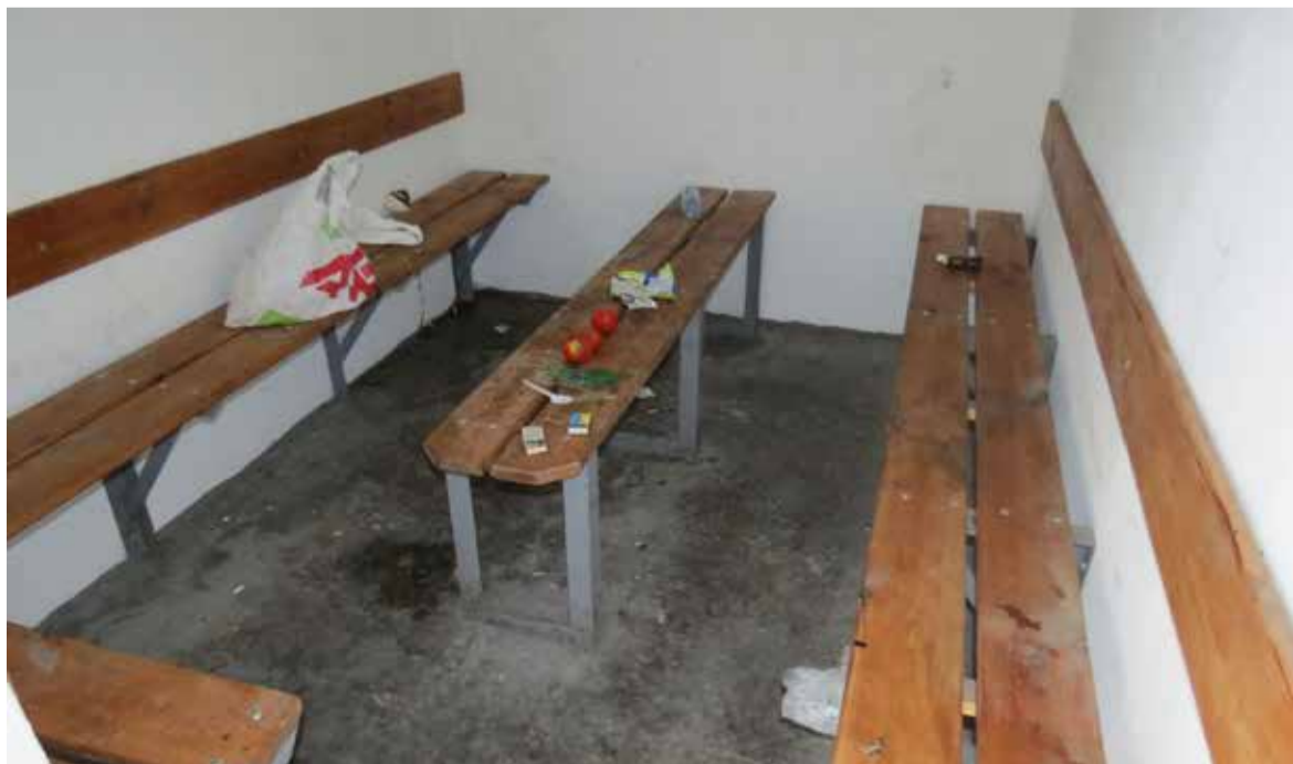
В укритті біля автовокзалу пиячили та залишили купу сміття