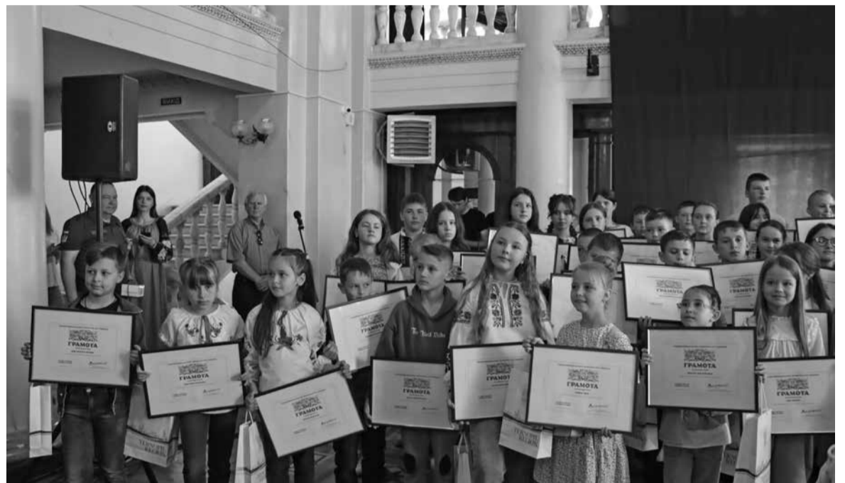
Всього грамоти від Головнокомандувача ЗСУ отримали 72 дитини з усієї області

Опісля, під гучні оплески, військові нагородили юних волон-