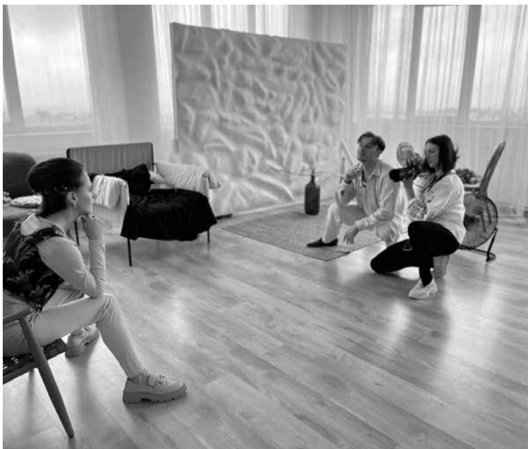
Фотограф та стиліст підказували учасницям вдалі пози