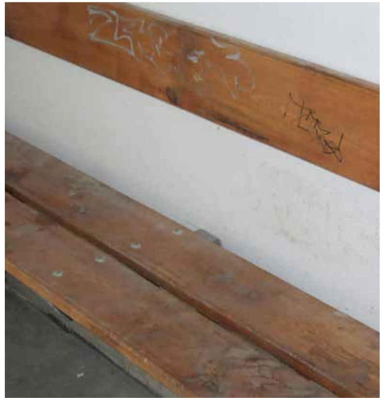
Лавки в укритті на Дружбі розмальовані

Впродовж тижня робоча група оглянула 304 захисних споруди цивільного захисту (будівлі, споруди, приміщення). За результатами обстежень з них не придатні — 20 об'єктів. Укриття, які закриті або до яких є зауваження, перевіряють повторно, після чого будуть прийняті відповідні заходи.