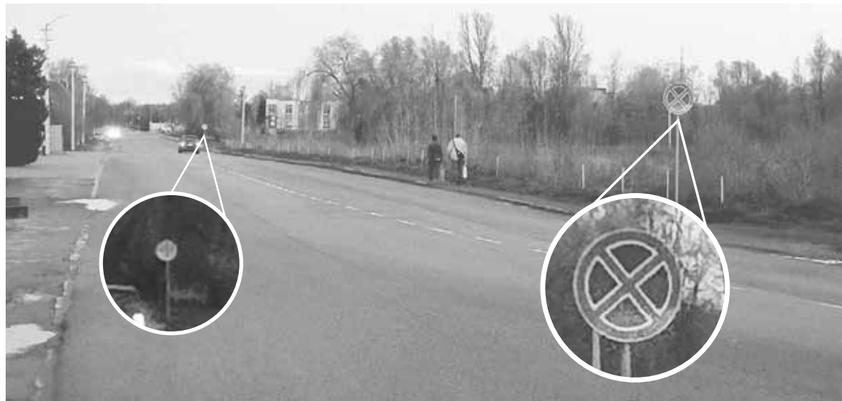
На Довженка біля будівельної бази встановили знаки «Зупинку заборонено». Ввечері автівок тут немає, а от вдень — тут так само запарковано