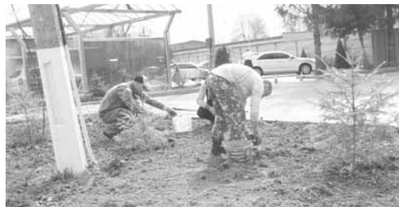
Висадили ялинки і вибирають каміння. Мабуть, будуть засаджувати клумбу

Відбулися зміни і біля управління освіти. Засипали колію, що проклали автівкою квітником. Кипить робота будівельників біля доріжок тротуарів, а Державний прапор на флагштоці не тільки розкрутили, а й замінили на новий.