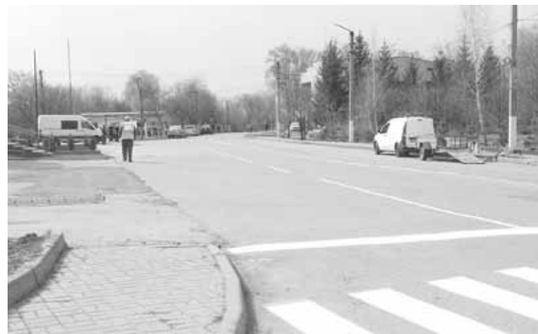
Чепурять провулок Кондрацького. Навіть дорожню розмітку оновили