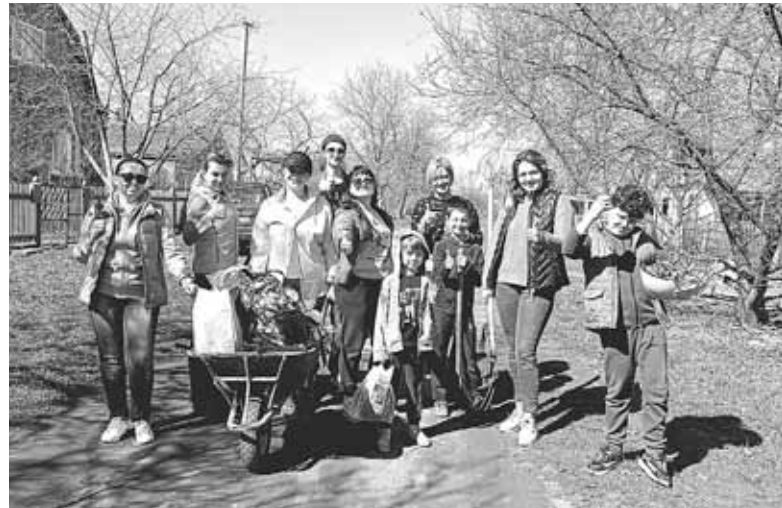
Прибирати Махаринецький ліс козятинчани зібралися у неділю, 31 березня. Того дня була тепла погода без опадів

Саме за округ № 9, до якого входить посьолок. Усі пакети повантажили на трактор і вивезли на сміттєзвалище. А ми, в свою чергу, нагадуємо читачам, що ліс — це не смітник, а куточок живої природи, про який ми повинні дбати.