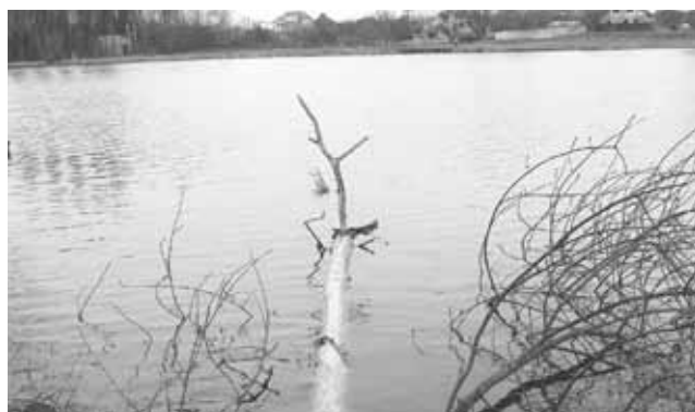
Дерева у Водокачці. Бобри обгризли кору, «натякають», що стовбури треба витягнути з води