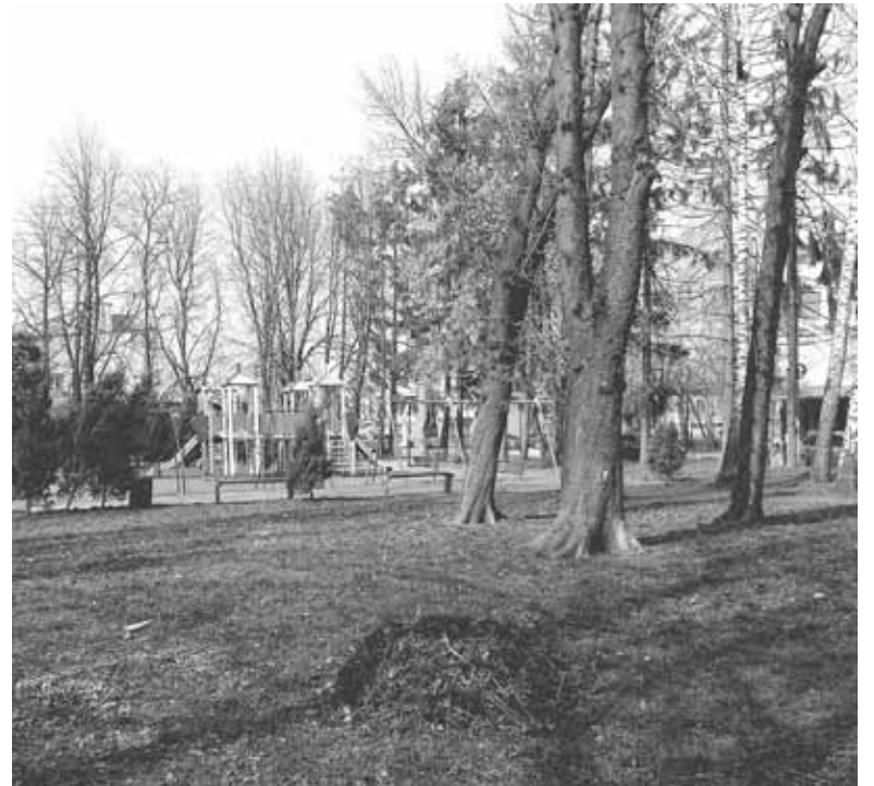
У сквері нині два майданчики. Навіть сучасний не пристосований для дітей з інвалідністю