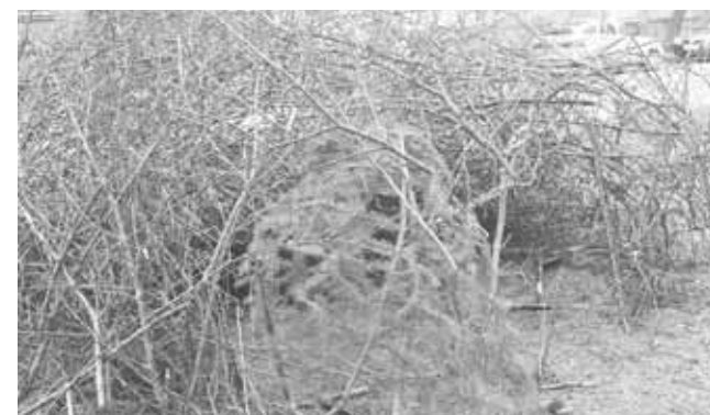
Це вже не просто купа гілля. Тут діти влаштували схованку