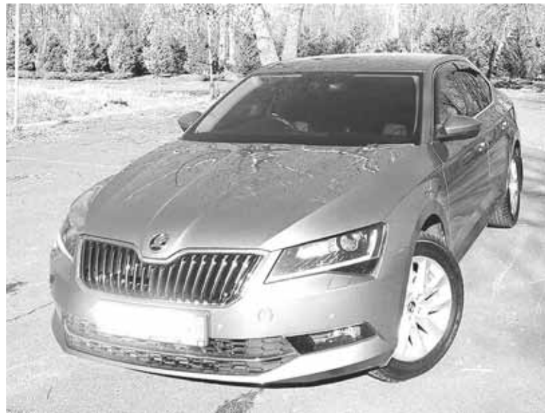
Подібна автівка — один зі службових автомобілів нашого виконкому. Машину придбали у 2018 році

Минулого року виконавчий комітет Козятинської міської ради придбав ще один службовий автомобіль — Renault Duster, 2022 року випуску. За цю машину заплатили 841 055 гривень і 40 копійок. Попри те, що власником автівки є виконком, користується транспортним засобом Служба безпеки України. Тому скільки