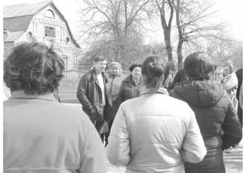
У суботу, 30 березня, прибічників створення кооперативу зібралося більше, ніж було минулого разу. Щоправда, було немало людей, які почули про водогін у селі уперше

У Сигналі, за інформацією сигнальців, збір у кооператив був 5 тисяч гривень, а зараз ще додають по 3 тисячі гривень. Мешканцям багатоквартирних будинків підведення води до їх квартир обійшлося дешевше. Тому що витрати на обладнан-