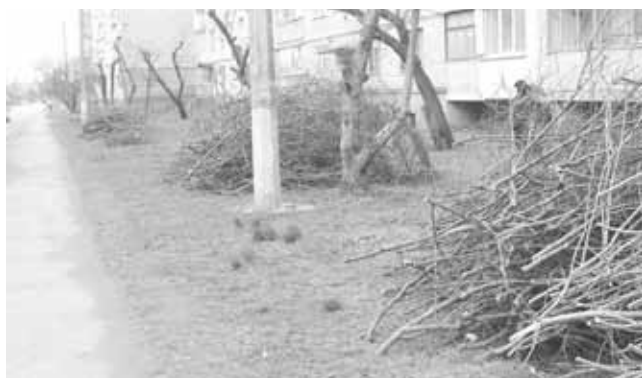
Настригли на декілька років наперед. Коли заберуть це гілля?