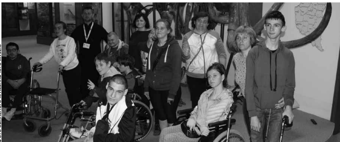
У музеї відкрили ліфт, тепер він доступний для людей з інвалідністю