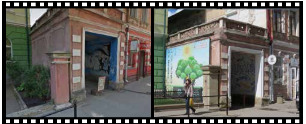
БУЛО: В арці на вході до вулиці був мурал на музичну тему