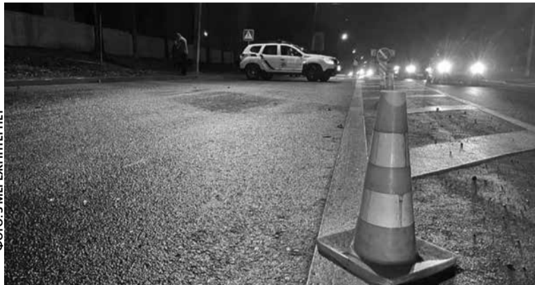
Серед причин, які призвели до аварій — перехід у невстановленому місці та раптовий вихід на дорогу

в разі руху узбіччям чи краєм проїжджої частини, пішохід зобов'язаний йти назустріч руху транспортних засобів; ■ у темну пору доби та в умовах недостатньої видимості, рухаючись проїзною частиною чи узбіччям, повинен використовувати світлоповертальні елементи (стрічку, наклейку, жилет тощо) або бути в одязі, який має світлоповертальні елементи, для своєчасного їх виявлення іншими учасниками дорожнього руху.