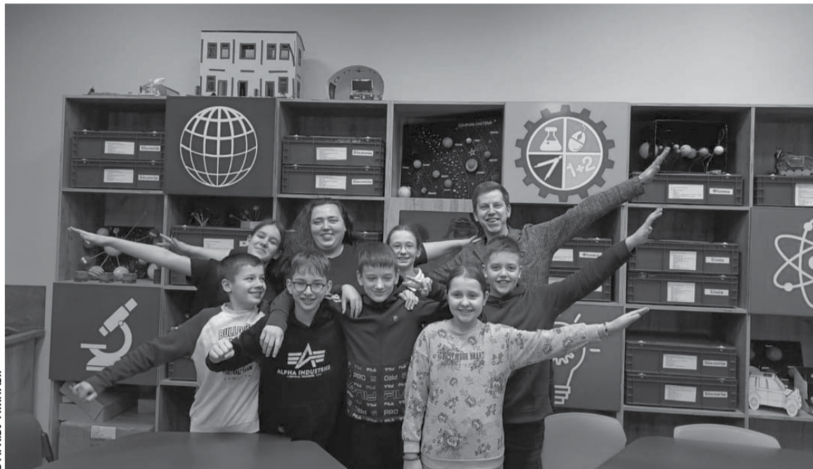
З АРХІВУ ГІМНАЗІЇ

вона обрала учнів 6-их класів, які добре працювали на уроках, і сформувала команду учасників на олімпіаду, — пояснює директор. — За правилами, які релевантні у всьому світі, вистава не повинна була перевищувати восьми хвилин, діти повинні були збирати чеки на всі витрати, пов'язані із підготовкою декорацій (у нас пішло 150 доларів), описувати все, що вико-