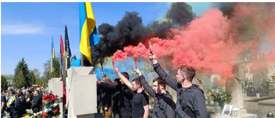
Під час похорону запалювали димові шашки та вмикали музику, щоб вшанувати Героїв