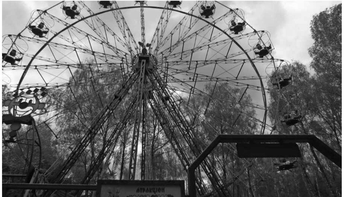
Минулого року колесо огляду не працювало з міркувань безпеки