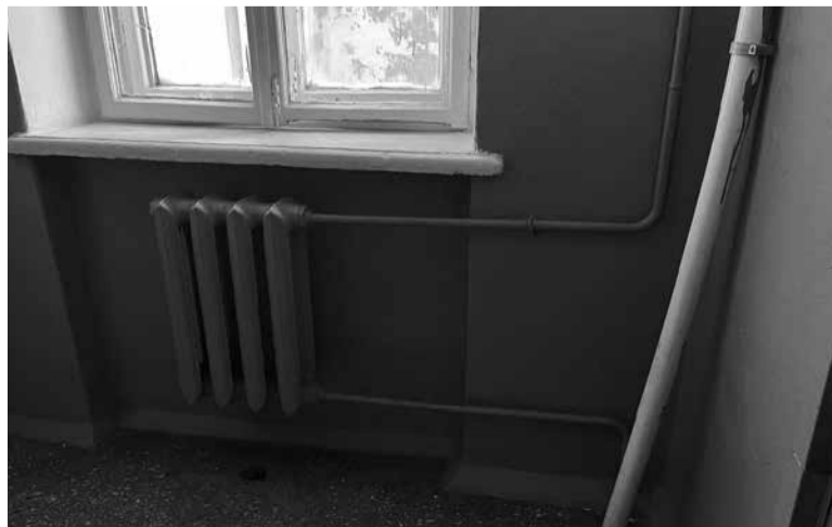
Управителі мають відповідати за порядок, чистоту як у багатоквартирному будинку, так і на його території

У разі необхідності перегляду ціни будь-які зміни можливі виключно за рішенням співвласників будинку, для прийняття якого необхідно провести збори та набрати понад 50% голосів «за». Тобто зміна ціни в односторонньому порядку неможлива, якщо це не передбачено договором.