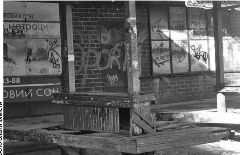
Лавки поламані, фарба вже роками облущена, а навколо безлад — така ситуація на зупинці поруч з «Універсамом»

— Якщо ми не можемо чітко визначити суб'єкта, який зобов'язаний відповідно до певного договору чи рішення міської влади здійснювати благоустрій на цій території, то суб'єктом, відповідальним за порядок, будуть відповідні органи міської влади, — пояснив адвокат. — Скажімо, комунальні підприємства міської ради, які саме створені з метою благоустрою. Тобто, якщо міська рада не може перекинути відповідальність за благоустрій