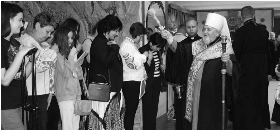
На заході представники духовенства благословили працівників музею

Також представники духовенства виконали молитву та заспівали патріотичну пісню «Ой у лузі червона калина», після чого освятили ліфт. Тепер музей став доступний для людей з інвалідністю. Тож колектив запрошує усіх тернополян та гостей міста приходити, щоб дізнатися про історію Тернопільщини.