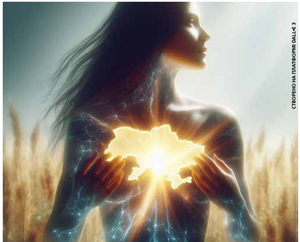
СТВОРЕНО НА ПЛАТФОРМІ DALL-E 3