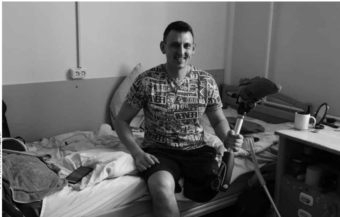
Військовий отримав серйозну травму під час евакуації побратима

— Намагаюся достатньо часу приділяти вправам, аби набрати фізичних кондицій та зменшити