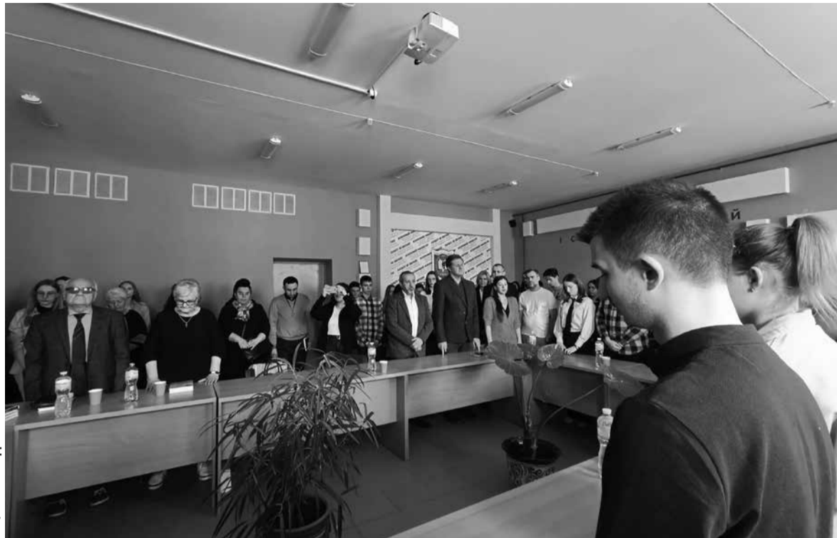
Захід розпочали з хвилини мовчання у пам'ять про полеглого військового