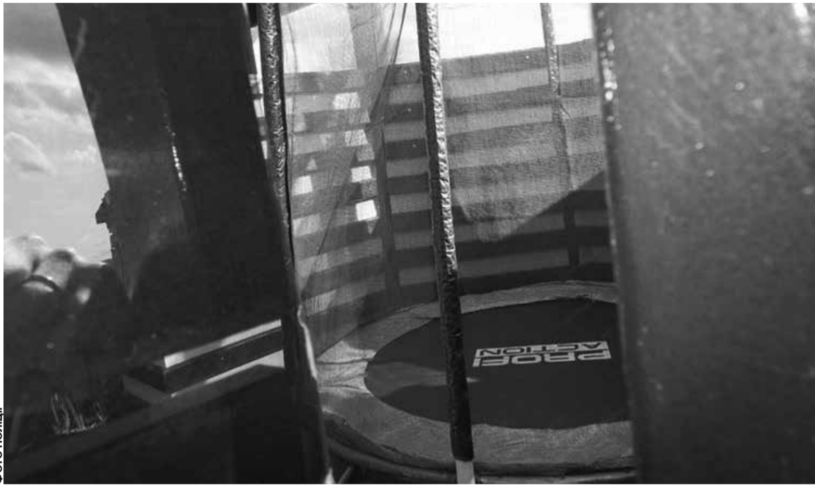
В одному з приміщень надбудови площею 3 на 9 метрів розташований тренажерний зал і батут

— Нам вже дали відповідь на ті питання, які ми поставили експертам, — повідомив 11 квітня журналістів очільник поліції Тер-