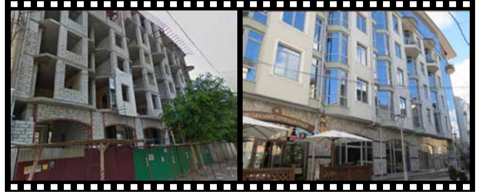
БУЛО: У травні 2015 на вулиці тривало будівництво