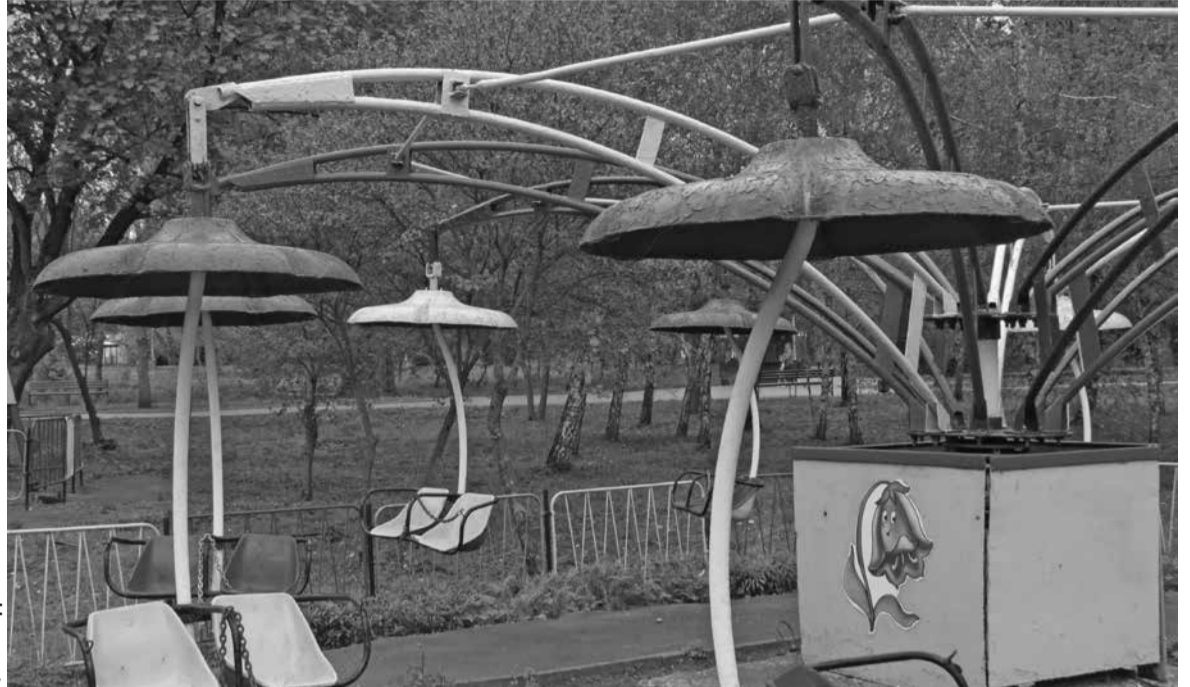
Ціни на розваги планують підняти цього року

Журналісти, відповідно, знову звернулися до міськради з проханням надати копії документів про суб'єкта господарювання, у постійному користуванні якого ділянка. Нам відмовили, проте запевнили, що їх ми зможемо отримати у відповіді на запит. Тоді ми поцікавились, хто ж тепер має навести лад. Мар'яна