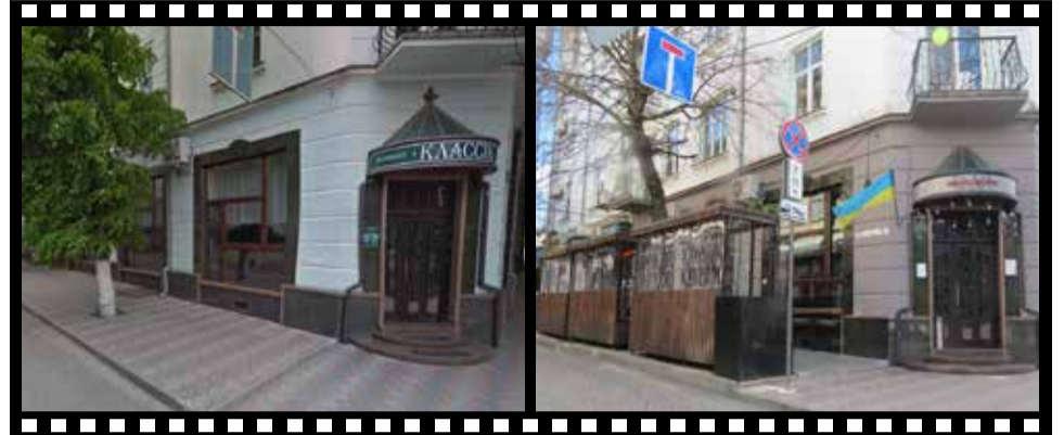
БУЛО: На розі вулиці раніше працював ресторан «Класік»